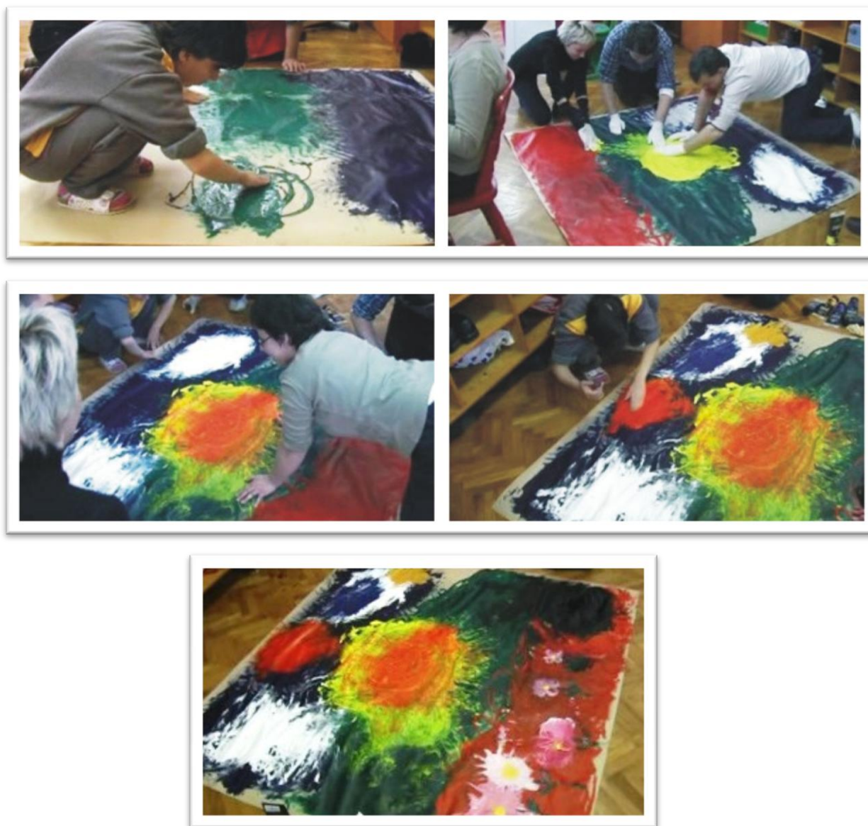
Slika 6. Slikanje rukama

Uostalom, projekt je rezultirao širenjem socijalne svijesti studenata Akademije Likovnih Umjetnosti.