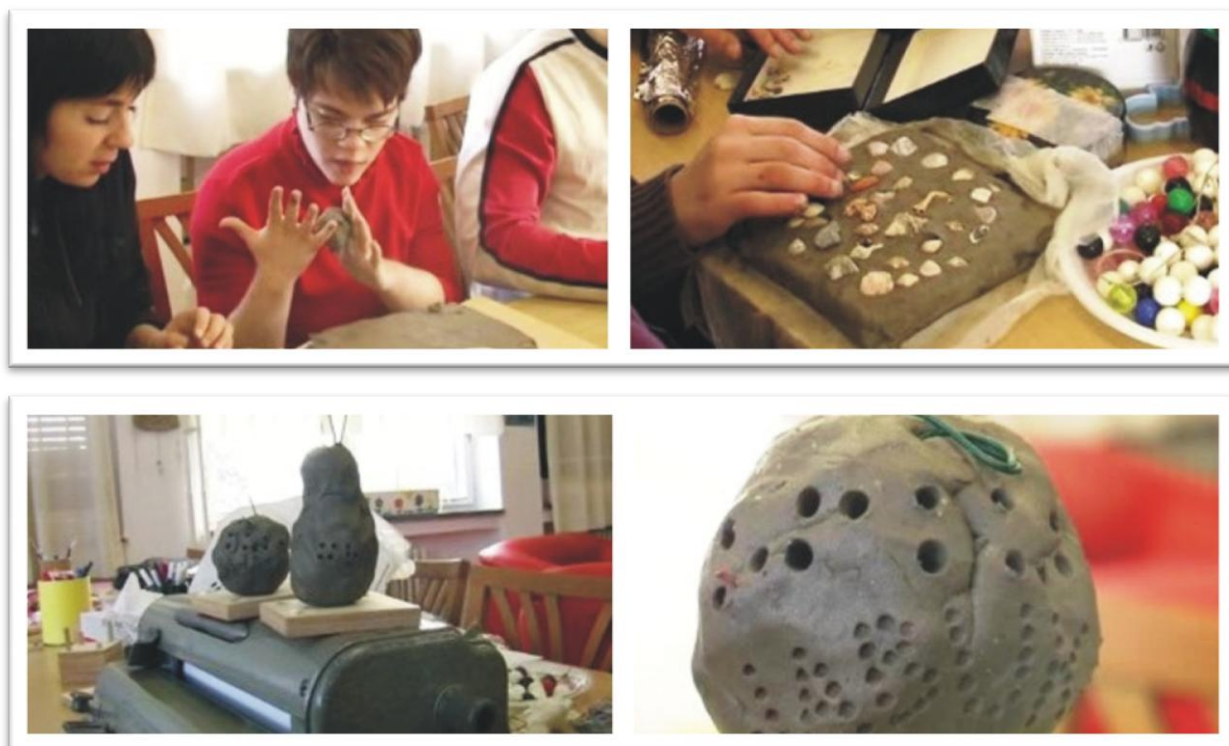
Slika 4. Modeliranje reljefa i skulptura u glini