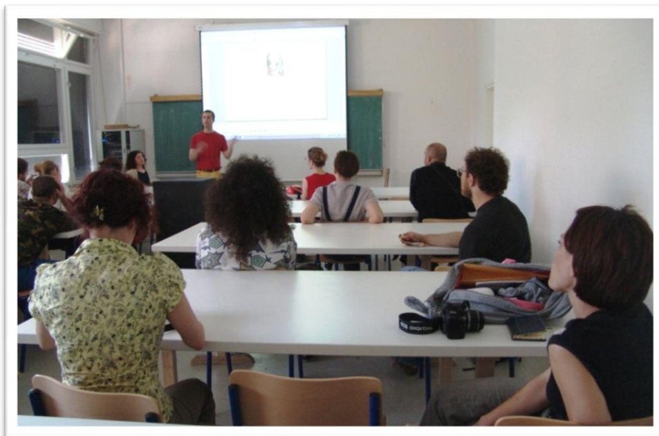
Slika 2. Javno predavanje „Kreativnost i terapija“

i izložbe koje su izvedene u svrhu integracije mladih osoba s invaliditetom u javni i kulturni život grada Zagreba.