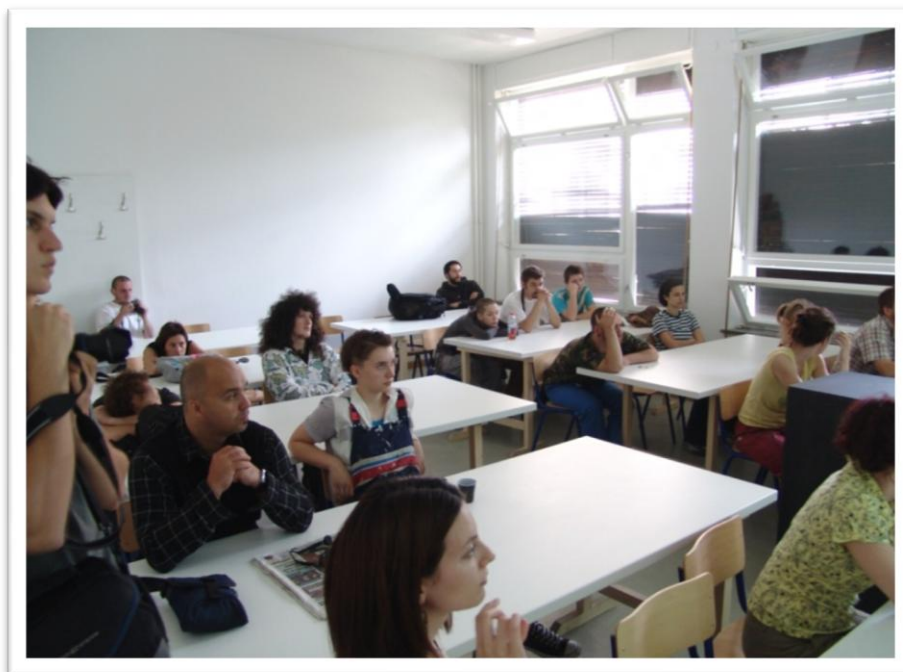
Slika 3. Javno predavanje „Kreativnost i terapija“

Na održanom predavanju prisustvovali su profesori, studenti i koordinatori aktivnosti na Akademiji Likovnih Umjetnosti (Slika 3). Po završetku predavanja zainteresiranim studentima ponuđeno je sudjelovanje u drugoj fazi ovog projekta.