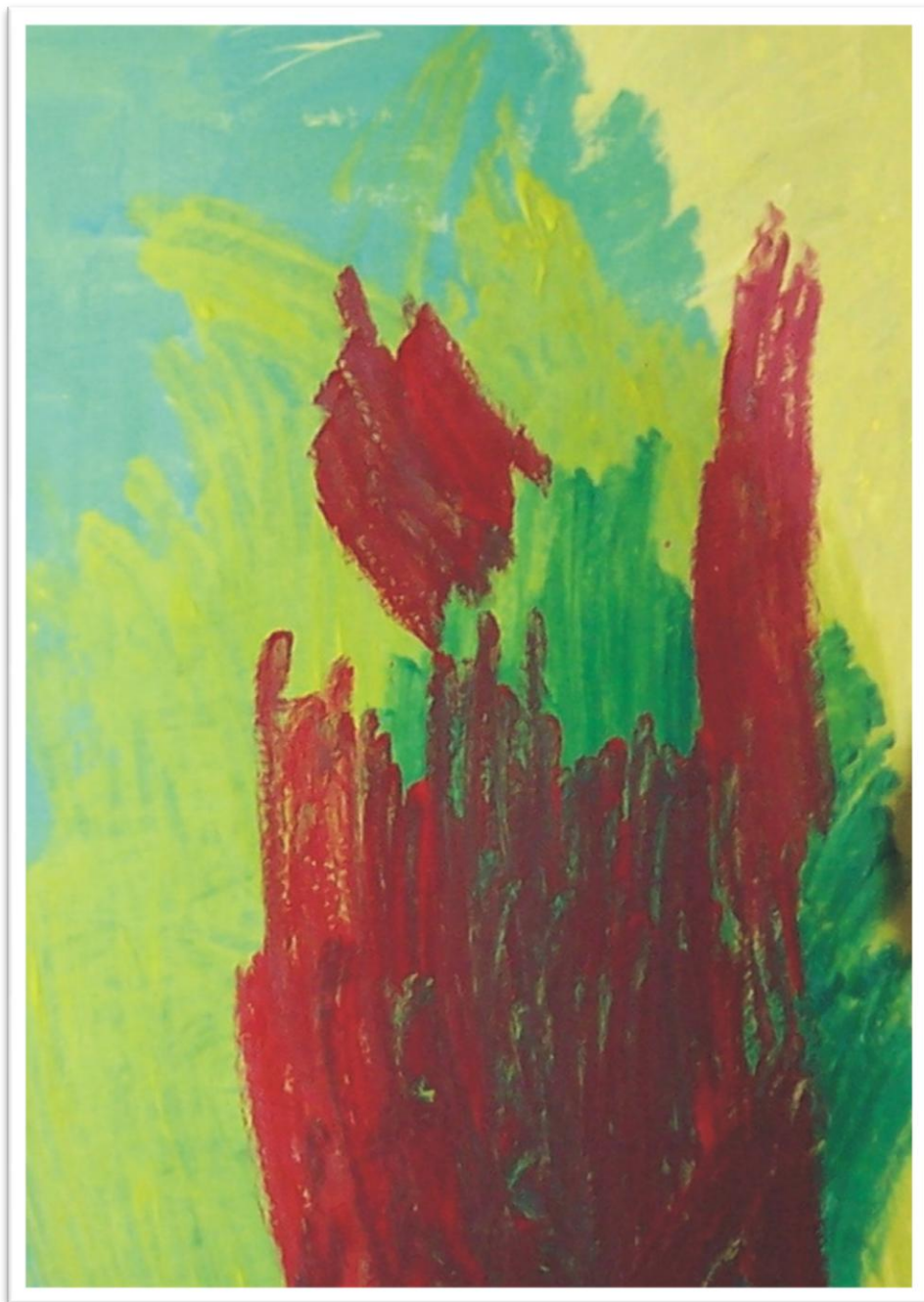
Segment slike Z. H.

(18 god., umjerene kognitivne poteškoće, ostatak vida 3%)