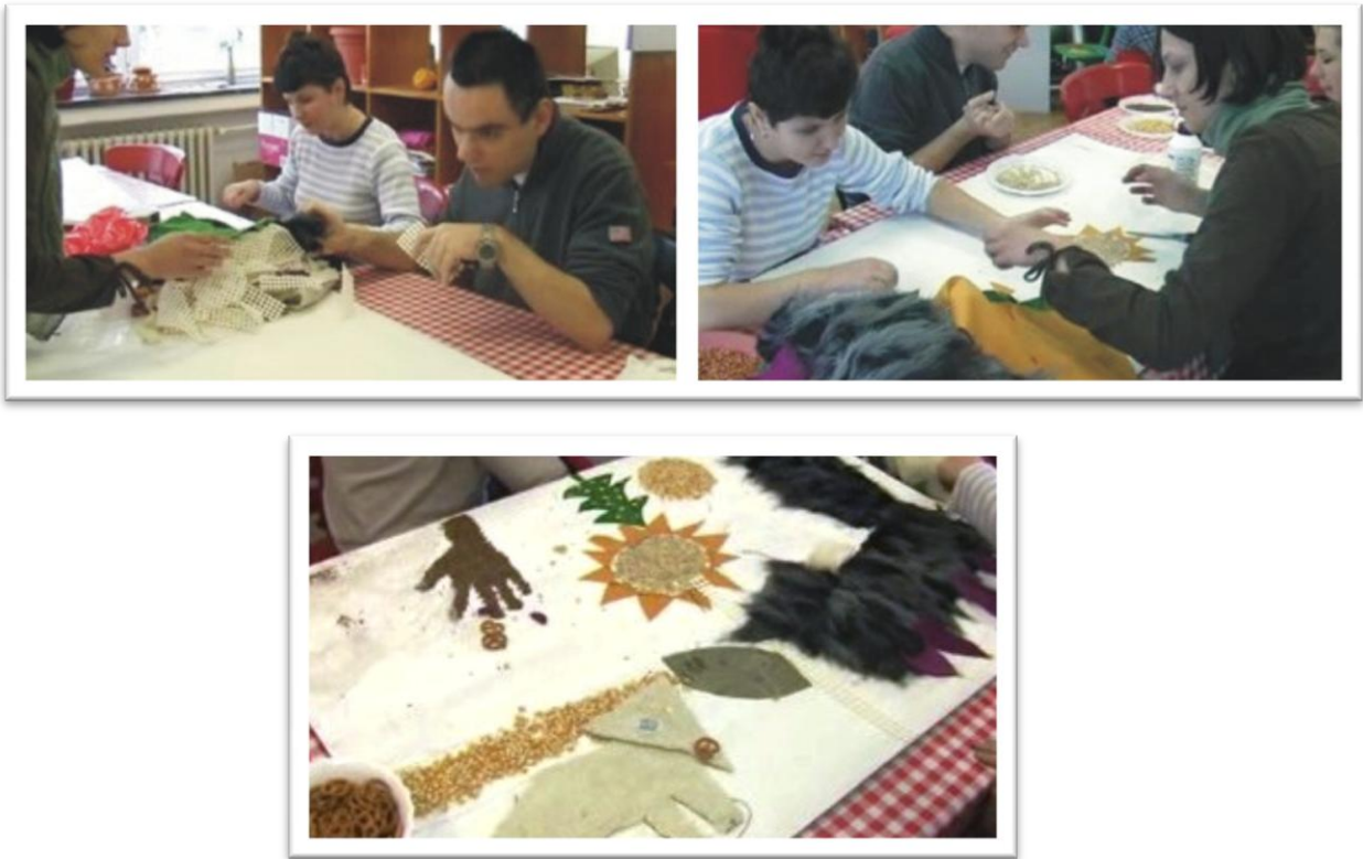
Slika 5. Apliciranje dvodimezionalnih prikaza u različitim taktilnim materijalima