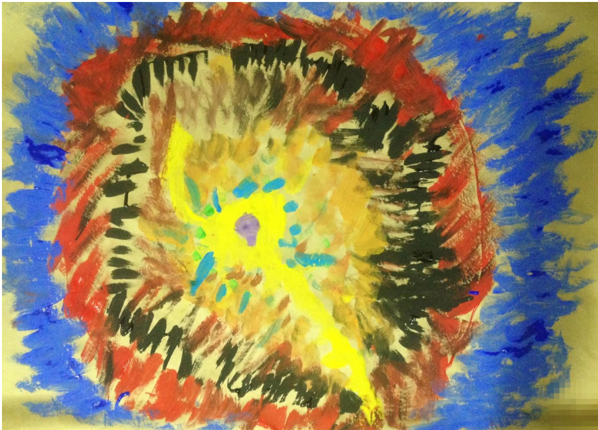
Slika 2. Kaos – rad polaznice.

ISHODI: Sudionici će osvijestiti cijelo tijelo i njegovu aktivnu ulogu u kreativnom stvaralačkom procesu. Nadalje, prepuštanjem intuitivnom slikanju vođenom emocijama i podsvjesnim porivima, smanjit će vlastite inhibicije i strah od konačnog ishoda djela. Zatim će prepoznati ponavljajuće obrasce te ih sistematizirati unutar novog djela. Na taj način će sintetizirati svoje misli i doživljaje u jednu koherentnu cjelinu.