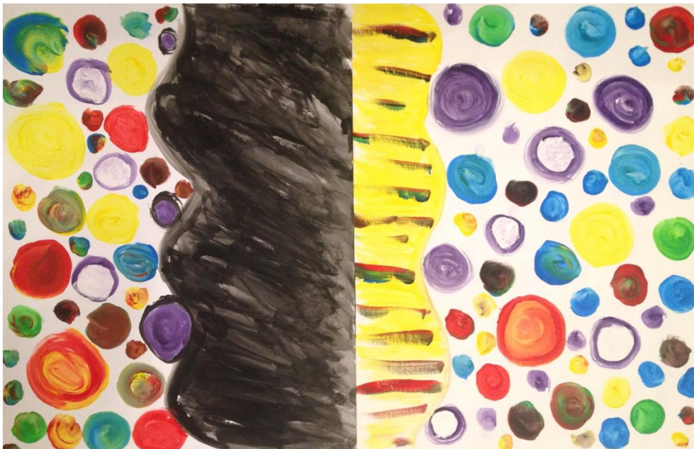
Slika 1. Skala emocija – rad polaznice

ISHODI: Osvijestiti emocionalna stanja kroz koje osoba prolazi u posljednje vrijeme, reflektirati na ta stanja, zašto i kako do njih dolazi. Ideja je potaknuti i razmišljanje o pozitivnijem dijelu spektra skale emocija te potaknuti procese koji vode u taj dio emocionalnog života.