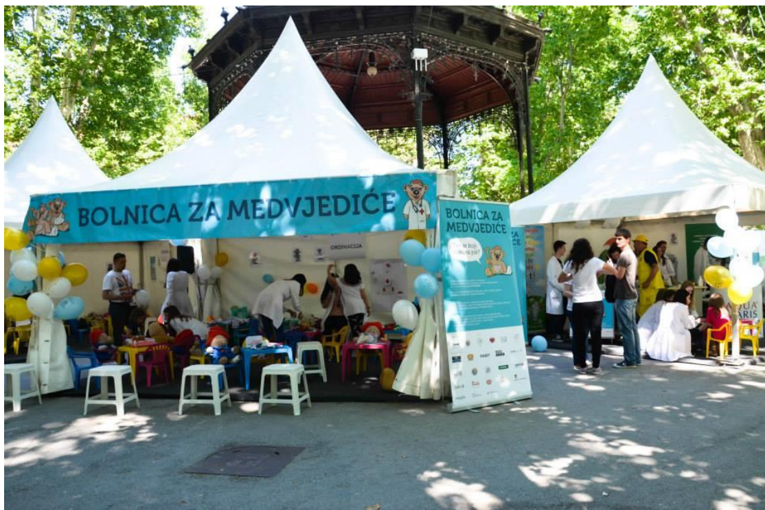
SLIKA 8. ŠATORI POSTAVLJENI U PARKU ZRINJEVAC U SKLOPU PROJEKTA TBH (SVIBANJ 2015.)