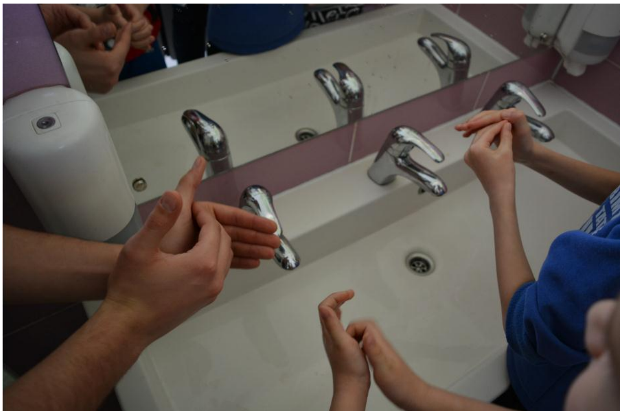
SLIKA 6. DEMONSTRACIJA PRAVILNOG PRANJA RUKU U SANITARNOM ČVORU VRTIĆA (DV TREŠNJEVKA)