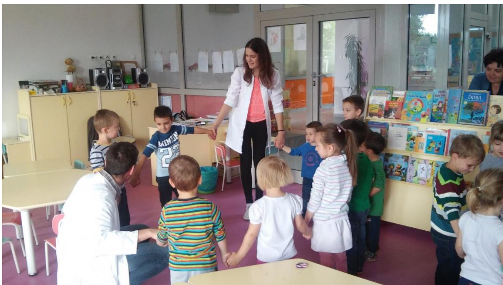
SLIKA 3. IGRA PRENOŠENJA VALA KOJOM POKAZUJEMO NAČIN NA KOJI SE PRLJAVŠTINA PRENOSI S RUKE NA RUKU (DV JARUN)