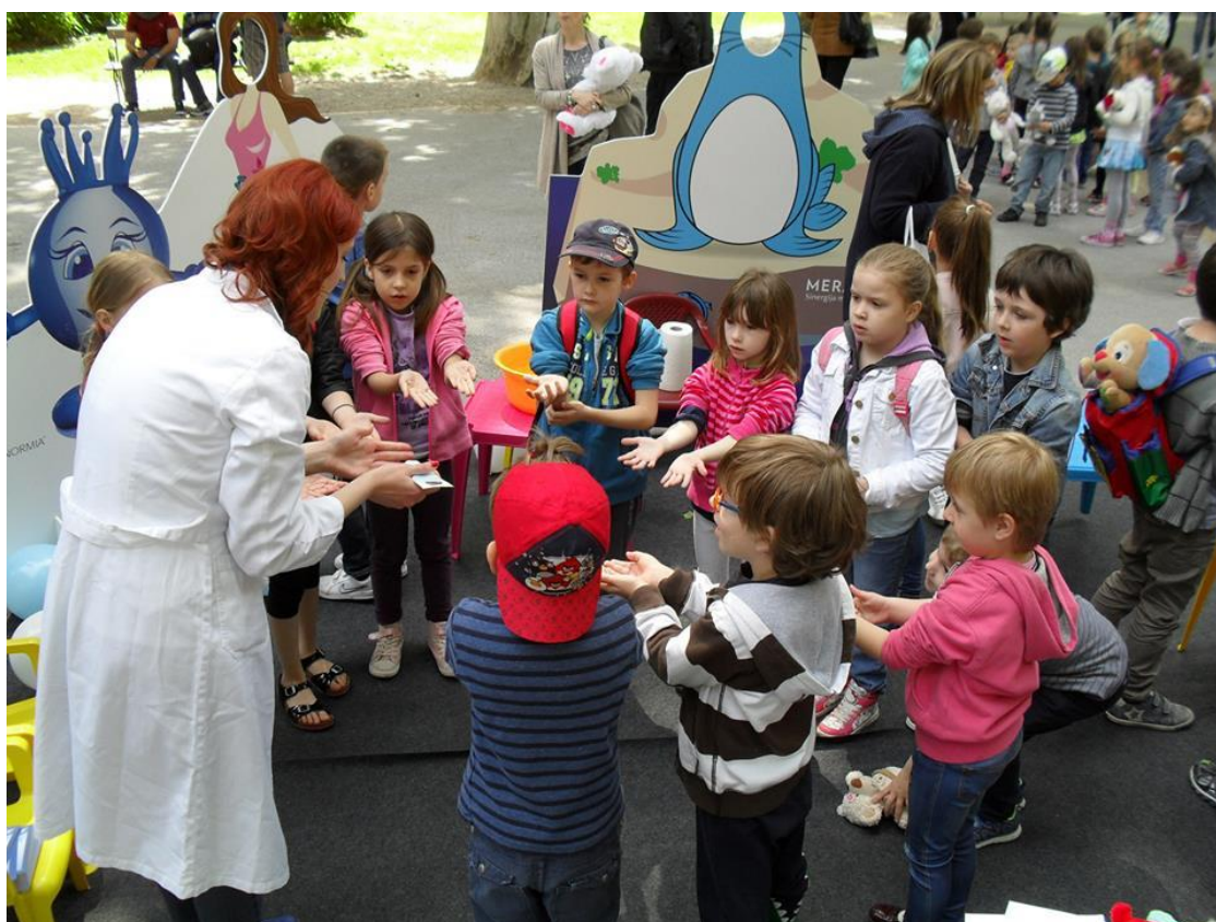
SLIKA 9. INTERAKTIVNE RADIONICE CPSAPUNČIČA U PARKU ZRINJEVAC U SKLOPU TBH (SVIBANJ 2015.)