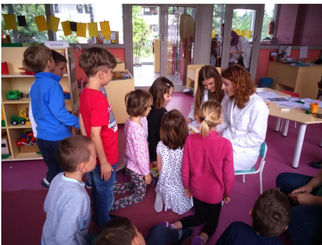
SLIKA 4. ČITANJE PRIČE S TEMATIKOM VEZANOM UZ HIGIJENU RUKU (DV JARUN)