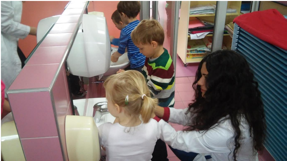
SLIKA 5. DEMONSTRACIJA PRAVILNOG PRANJA RUKU U SANITARNOM ČVORU VRTIĆA (DV JARUN)