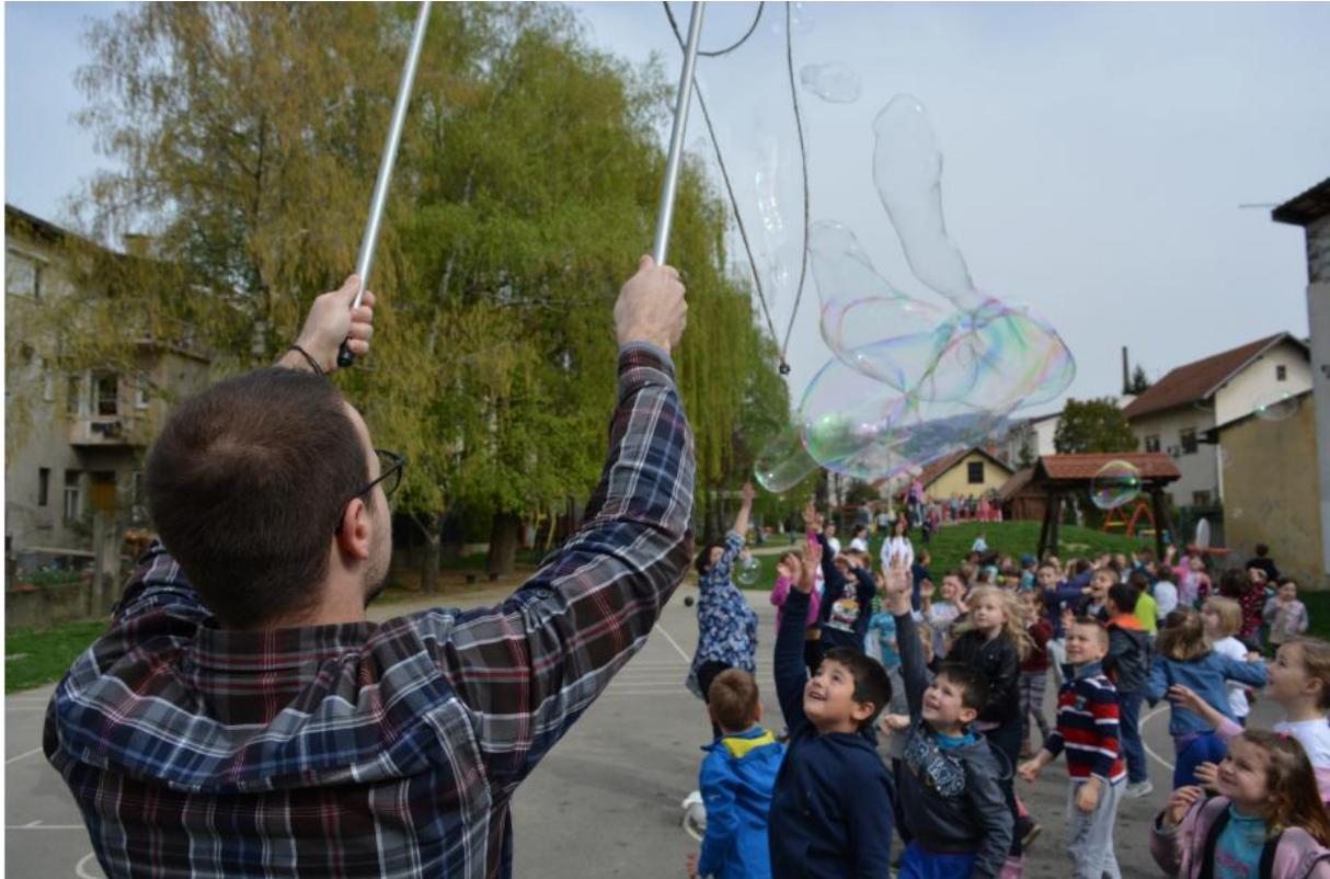
SLIKA 7. PRAVLJENJE VELIKIH BALONA OD SAPUNICE NA DJEČJEM IGRALIŠTU (DV PETAR PAN)