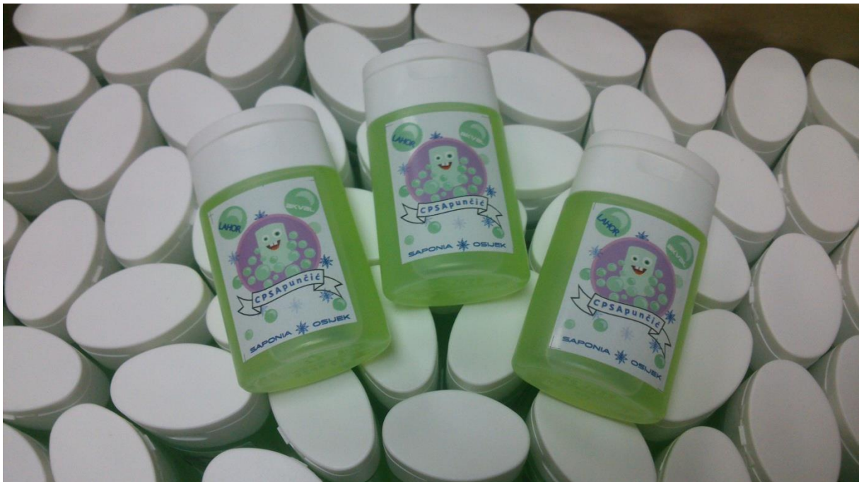
SLIKA 2. SAPUNČIĆI KOJE JE ZA POTREBE PROJEKTA DONIRALA TVRTKA „SAPONIA OSIJEK“

U želji da što više obogatimo naše radionice odlučili smo se obratiti i sponzorima, a prvi koji je pozitivno odgovorio na naše molbe bila je „Saponia Osijek d.d.“. Prema našem idejnom rješenju Saponia nam je donirala male tekuće sapunčiče, posebno dizajnirane i osmišljene za ovaj projekt, koje smo dijelili u vrtićima svakom djetetu koje je prošlo kroz edukaciju. Suradnja s ovom domaćom tvrtkom od iznimne nam je važnosti te ju planiramo nastaviti i u budućnosti.