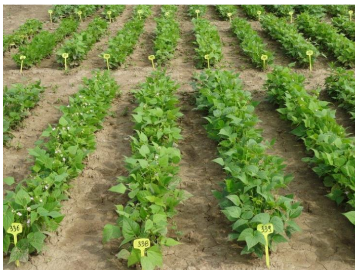
Slika 1. Poljski pokus

Poljski pokus je bio postavljen na Agronomskom fakultetu Sveučilišta u Zagrebu na pokušalištu Zavoda za sjemenarstvo tijekom vegetacijske sezone 2014. godine (Slika 1.). U istraživanjima je korišteno 338 tradicijskih kultivara graha, prikupljenih iz svih dijelova Hrvatske u sklopu projekta „Genetska osnova količine bioaktivnih hranjivih tvari hrvatskih tradicijskih kultivara graha“ koji financira Hrvatska zaklada za znanost, na osnovi liste deskriptora.