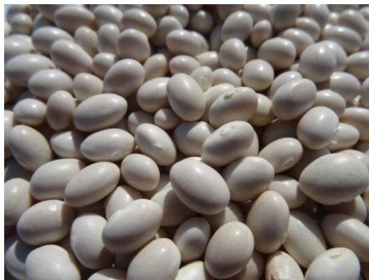
Slika 4. Biser