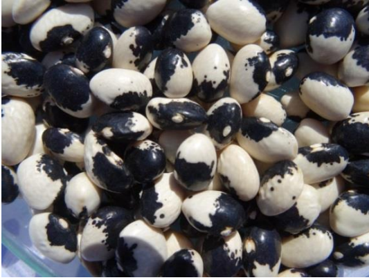
Slika 5. Dan noć