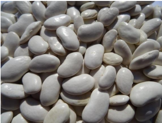
Slika 7. Tetovac