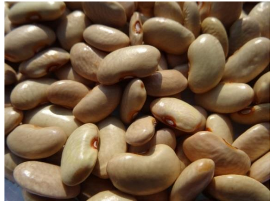
Slika 8. Kukuruzar