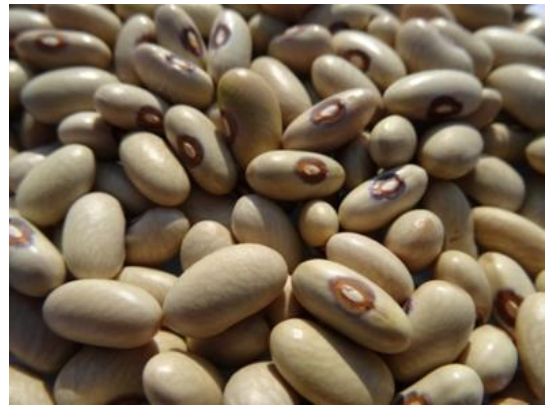
Slika 3. Zelenčec