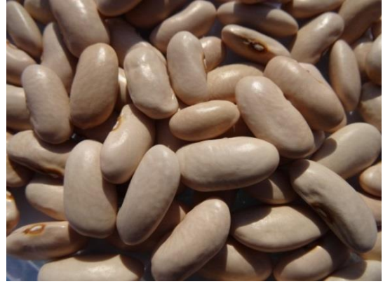
Slika 6. Puter