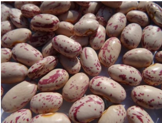
Slika 2. Trešnjevac

Ispitivane primke graha odvajaju se u dvije osnovne skupine unutar kojih postoji nekoliko podskupina. Svojstva QL01 (Boja zastavica) i QL02 (Boja krila) osnovna su svojstva koja su zajednička populacijama graha koje spadaju u dvije osnovne skupine. O navedenim svojstvima ovisna su i sva ostala ispitivana kvalitativna svojstva koja odvajaju analizirane populacije u podskupine. Manju skupinu od 120 primki čine tradicijski kultivari koje karakterizira bijela boja cvijeta dok veću skupinu čine one s ljubičastim cvijetom. Unutar te dvije skupine primke su razvrstane u sedam podskupina, odnosno morfotipova: trešnjevac (Slika 2.), zelenčec (Slika 3.), biser (Slika 4.), dan noć (Slika 5.), puter (Slika 6.), tetovac (Slika 7.) i kukuruzar (Slika 8.).