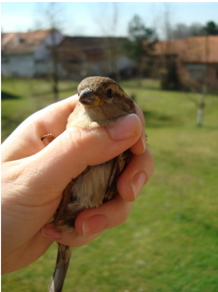
Slika 2. Ženka vrapca ( Passer domesticus )

Poljski vrabac (sl. 3.) živi na otvorenim šumskim područjima, uz obale rijeka, u vrtovima i parkovima; uglavnom u blizini naselja. Velik je 14 cm. Tjeme mu je kestenjasto, trtica žućkastosmeđa, a na krilu ima dvostruku krilnu prugu. U poljskog vrapca ne postoji spolni dimorfizam pa je mužjaka i ženku nemoguće razlikovati. Zbog toga je molekularno određivanje spola vrlo bitno kod ove vrste.