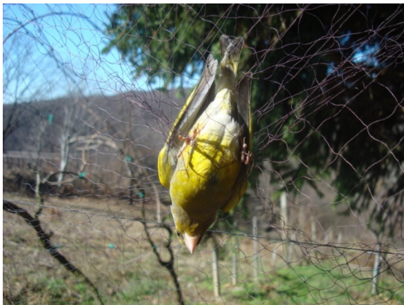
Slika 4. Zelendur ( Carduelis chloris ) u mreži