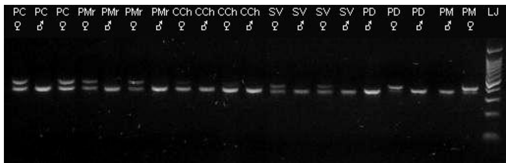
Slika 7. Rezultati dobiveni reakcijom PCR s parom početnica P2/P8 u vrsta iz reda vrapčarki ( Parus caeruleus –PC, Parus major –PMr, Carduelis chloris –CCh, Sturnus vulgaris –SV, Passer domesticus –PD, Passer montanus –PM). LJ je biljeg molekulske težine.