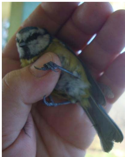
Slika 1. Plavetna sjenica ( Parus caeruleus )

Plavetna sjenica (sl. 1.) česta je u bjelogoričnim šumama, gradskim parkovima i vrtovima. Velika je svega 11,5 cm, a teška 9 do 12 grama. Pretežito je plave i žute boje s karakterističnim svjetloplavim tjemnom. Mužjak i ženka vrlo su slični, ali mužjaka možemo razlikovati od ženke po sjajnijem i intenzivnije plavom perju na glavi, repu i krilima. Ovakvo određivanje spola subjektivno je, a time i podložno pogreškama pa se ne treba isključiti mogućnost pogrešnog određivanja spola na terenu. Biometrijska obilježja previše se podudaraju da bi se spol mogao pouzdano utvrditi (npr. duljina repa u mužjaka je 49-54 mm, a u ženke 47-52 mm).