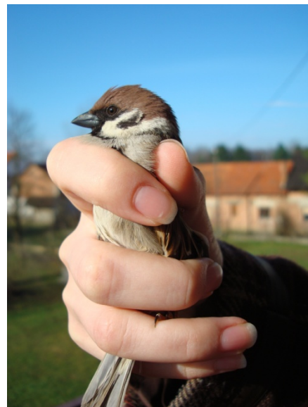
Slika 3. Poljski vrabac ( Passer montanus )

Zelendur je ptica koja obitava na rubovima šuma, u vrtovima i parkovima; češće na staništima s vazdazelenom vegetacijom nego na listopadnim područjima. Veličine je 14,5 cm. Mužjaka i ženku trebalo bi razlikovati po obojenosti: mužjak je svjetlije, žutozeleno obojan