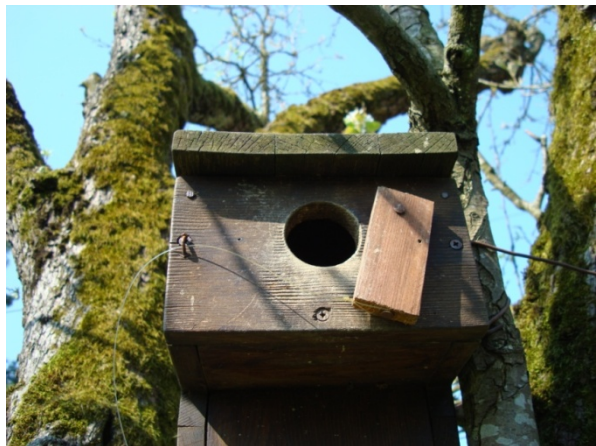
Slika 5. Klopka na škrinjici za gniježđenje čvorka ( Sturnus vulgaris )