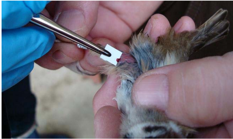
Slika 6. Uzimanje uzorka krvi poljskog vrapca ( Passer montanus ) s FTA karticom