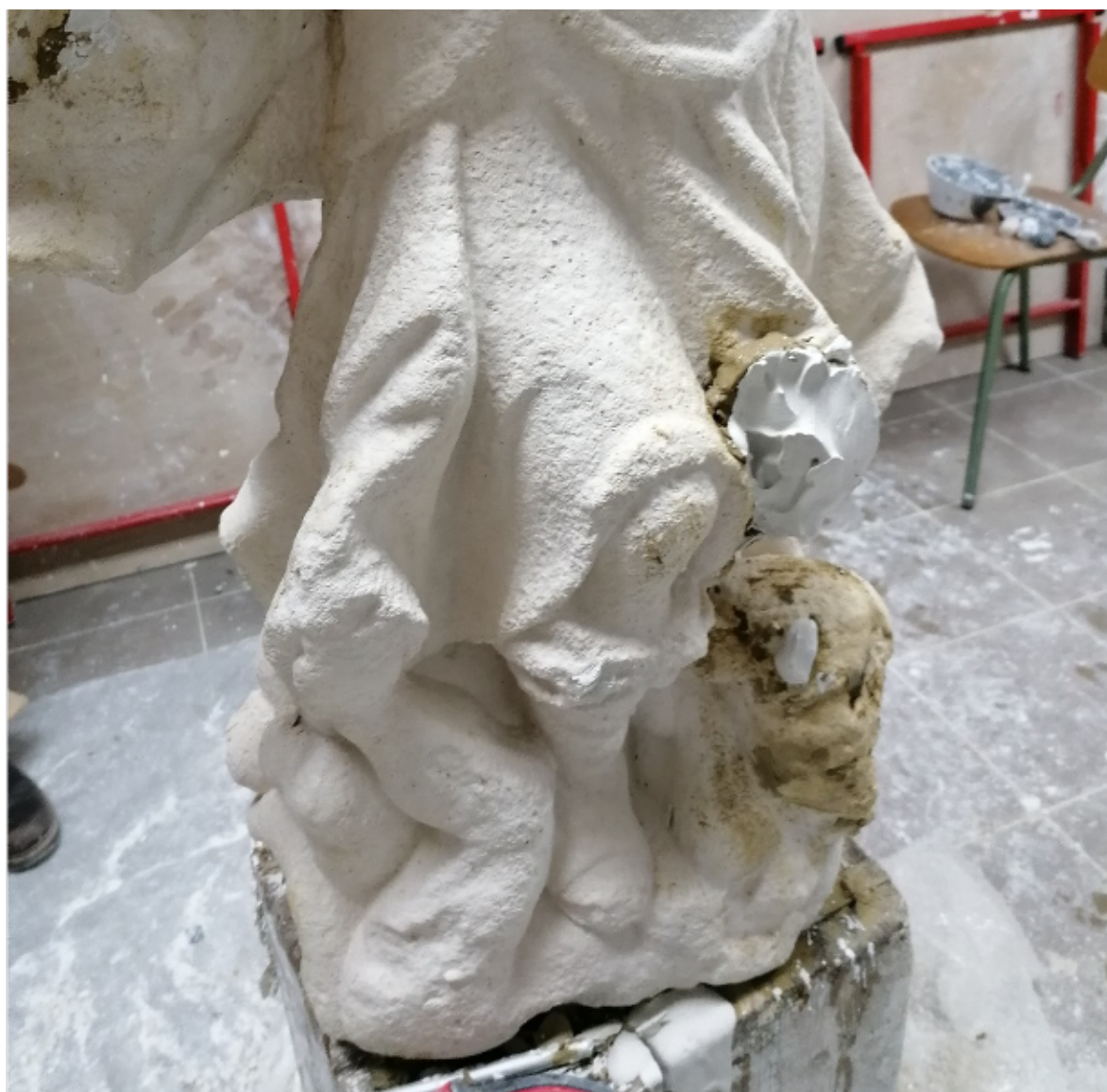
Slike 37 – 39. Lijevanje u gipsu, snimila E. Baričević 2020.