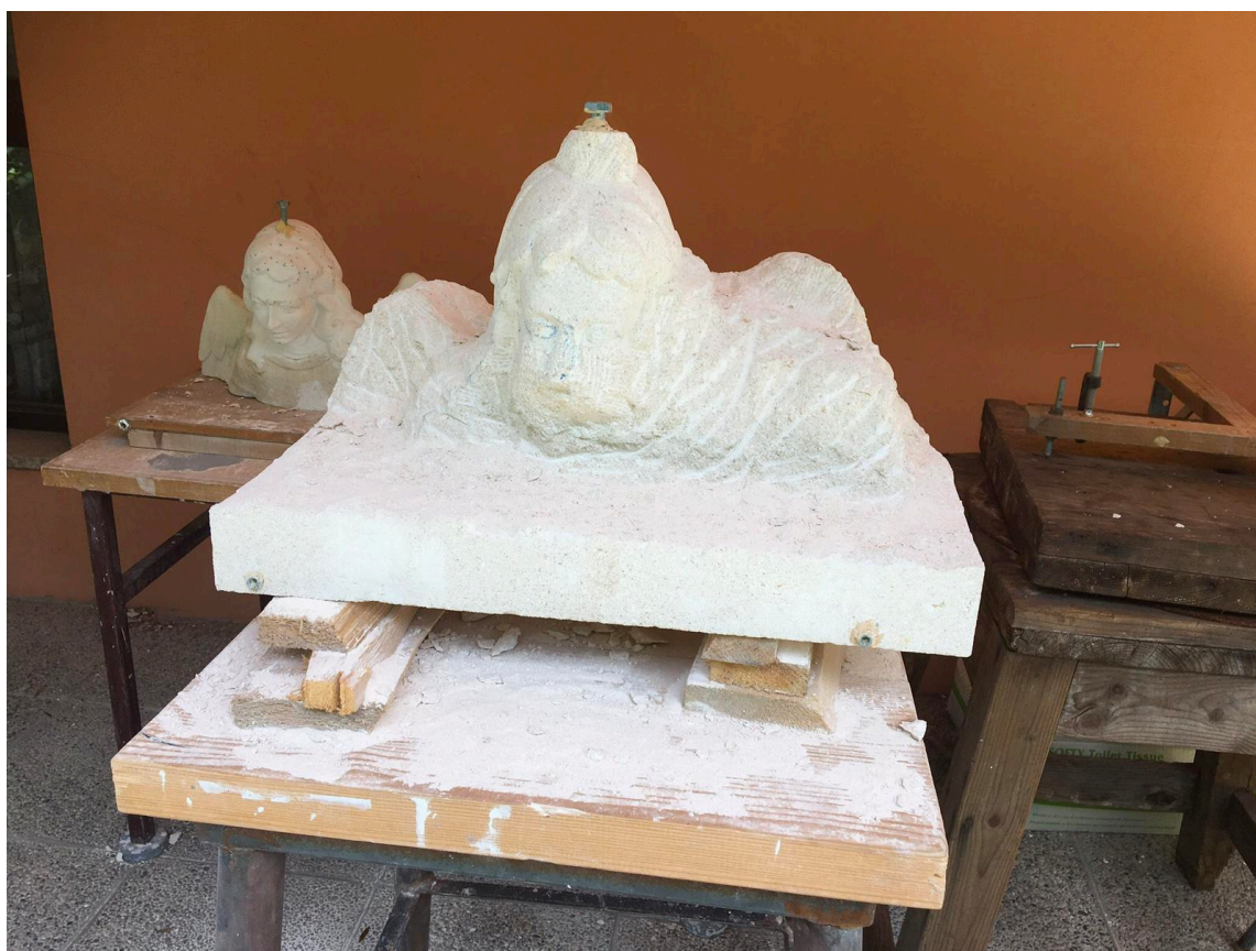
Slike 54 – 55. Klesanje dijelova kopije u kamenu, snimila I. Blažičko 2020.