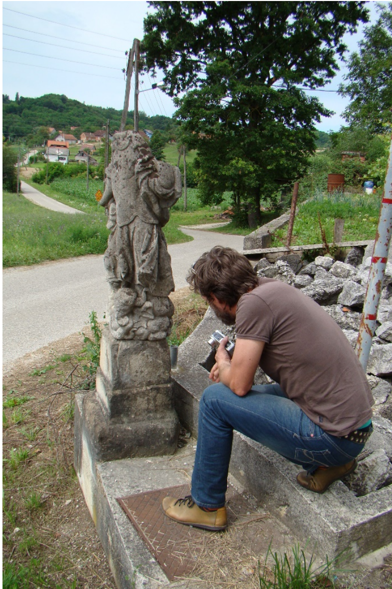
Slika 6. Dijagnostika in situ