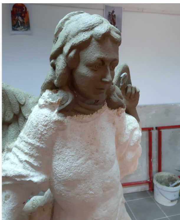
Slike 30 – 32. Prednja i stražnja strana skulpture nakon rekonstrukcije nedostajućih dijelova, snimila E. Baričević 2020.