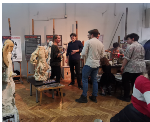
Slike 56 – 58. Noć Muzeja na Akademiji likovnih umjetnosti Sveučilišta u Zagrebu, Ilica 85; 31. siječnja 2020., snimila I. Blažičko 2020.