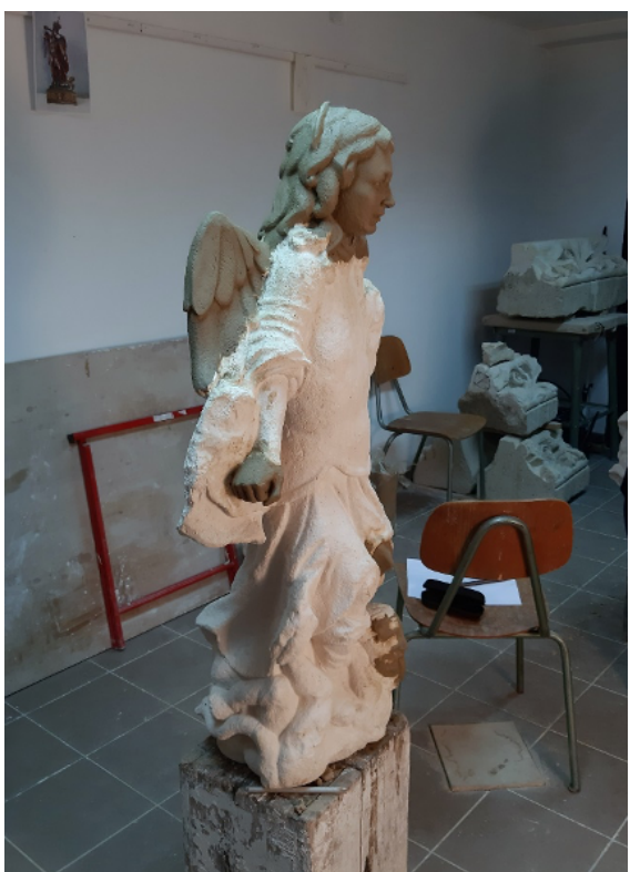
Slike 26 – 29. Različite varijacije rekonstrukcija nedostajućih dijelova u glini, snimila I. Blažičko 2020.