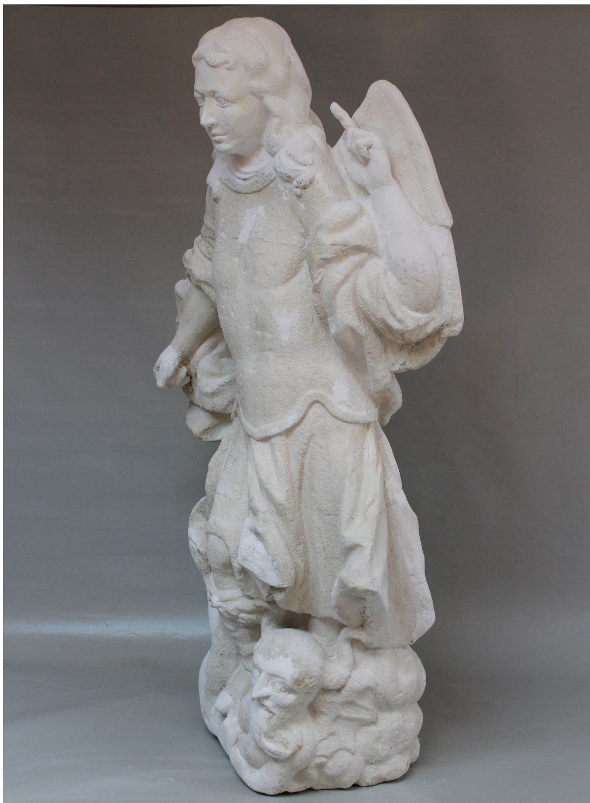
Slika 47. Rekonstruirana skulptura – gipsani odljev s rekonstruiranim dijelovima, snimila E. Baričević 2020.