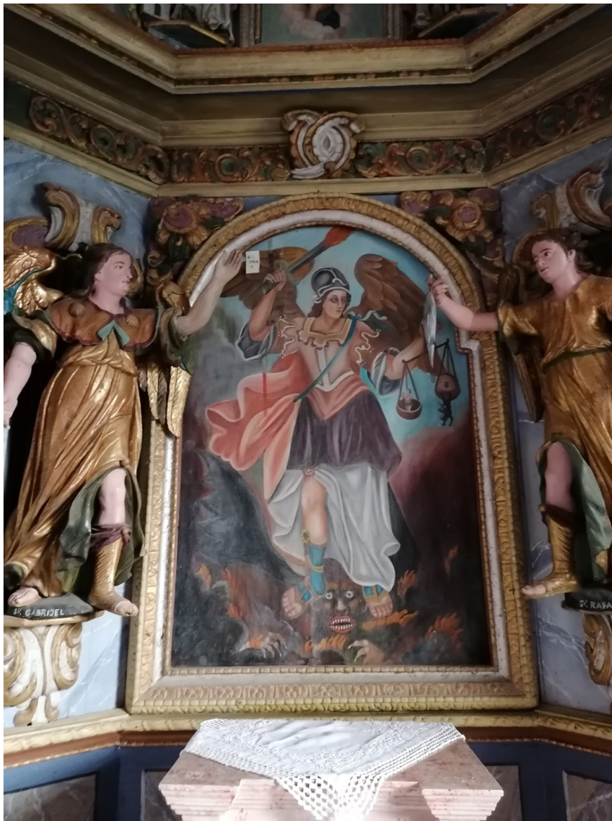
Slika 5. Oltarna slika sv. Mihaela s glavnog oltara u kapeli sv. Mihaela u Sopotu, snimila E. Baričević 2019.g.

Sveti Mihael često je supstitut pretkršćanskih božanstava, pa se velik broj crkava kojima je titular nalazi na vrhovima bregova koji su nekada bili posvećeni poganskim kultovima. Njegov lik ili kapela postavljani su pred gradskim vratima ili nad njima radi obrane od zlih sila. Radi zaštite grada lik mu je često postavljan i na vrhove zvonika. 1