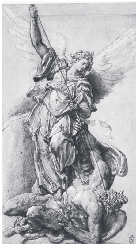
Slike 11 – 12. Hubert Gerhard, Arkandeo Mihael pobjeđuje Sotonu (1588.), München, isusovačka St. Michaelskirche (lijevo). Peter Candid, Arkandeo Mihael pobjeđuje Sotonu (1588.-1597.), Dresden, Staatliche Kunstsammlungen, Kupferstichkabinett (desno).