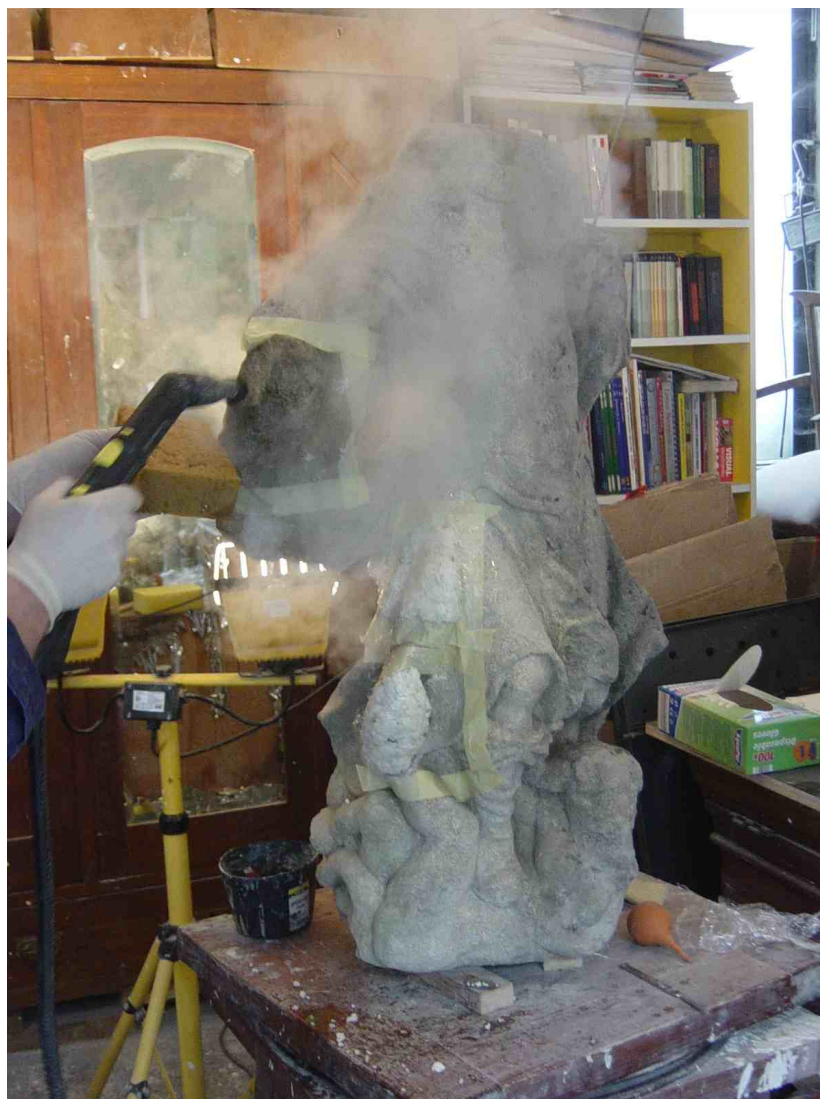
Slika 16. Čišćenje skulpture, snimio A. Novoselec, 2018.

Radovi su započeti probama čišćenja kojima se utvrdilo koje su metode površinskog čišćenja najpogodnije. Iz rezultata zaključeno je kako će najdjelotvornije čistiti vodena para u kombinaciji s algicidima i fungicidima, te se provelo čišćenje parom, te uz pomoć spužve. Nakon toga su nanesene paste i oblozi koje su uklonile preostale nečistoće. Nečistoće su uklonjene na zadovoljavajući način i u zadovoljavajućoj mjeri, a skulptura je konsolidirana.