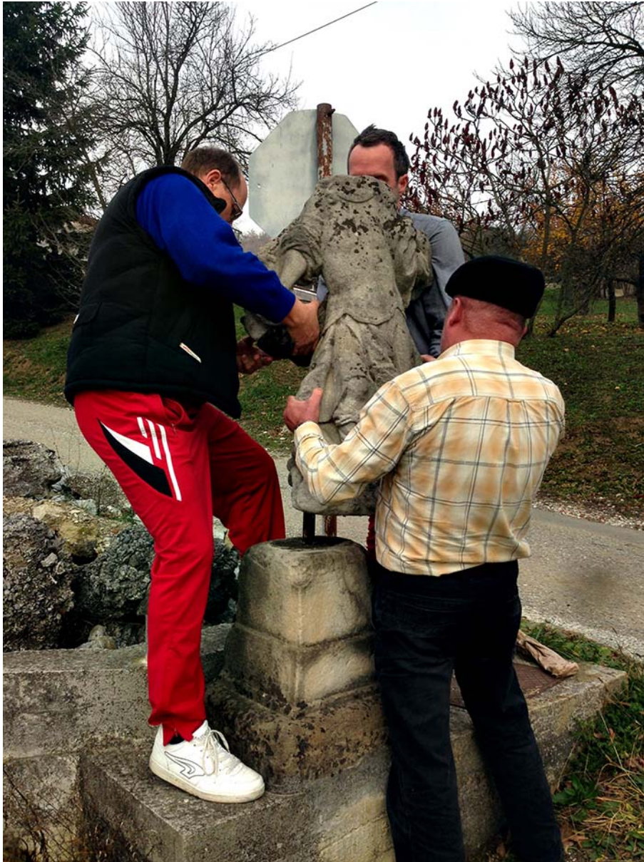
Slika 7. Demontiranje skulpture, uz pomoć lokalnih stanovnika, studeni 2017.