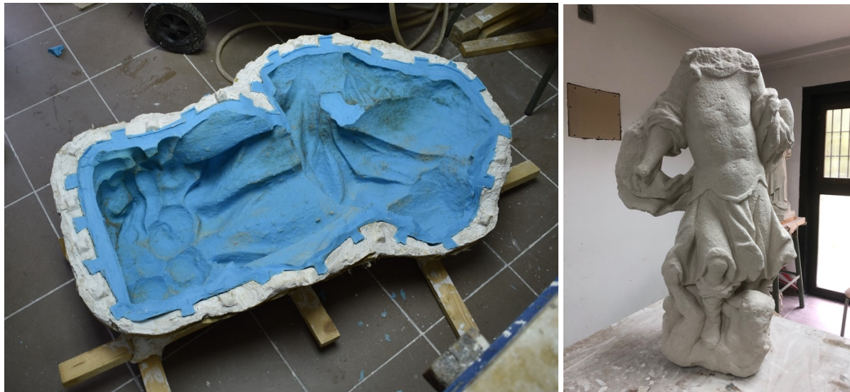
Slike 20 – 21. Kalup od silikonske gume; kopija skulpture u gipsu, snimio D. Pekić 2019.

Nakon toga kolege studenti su izradili kalup od silikonske gume prema izvornoj skulpturi, te potom uz pomoć kalupa i gipsanu kopiju.