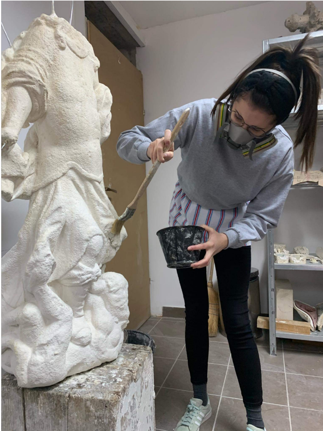
Slika 22. Konsolidiranje gipsane kopije, snimio R. Erdelji 2020.