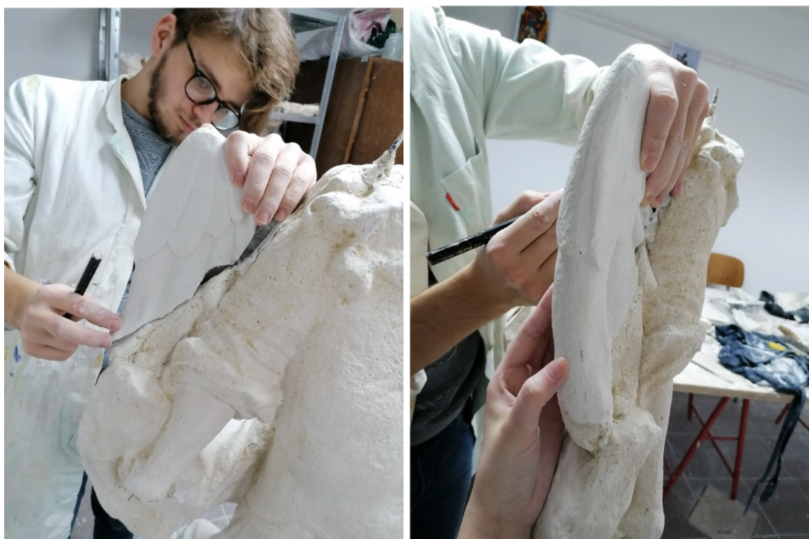
Slike 41 – 42. Apliciranje rekonstruiranih dijelova skulpture na gipsani kalup, snimila E. Baričević 2020.