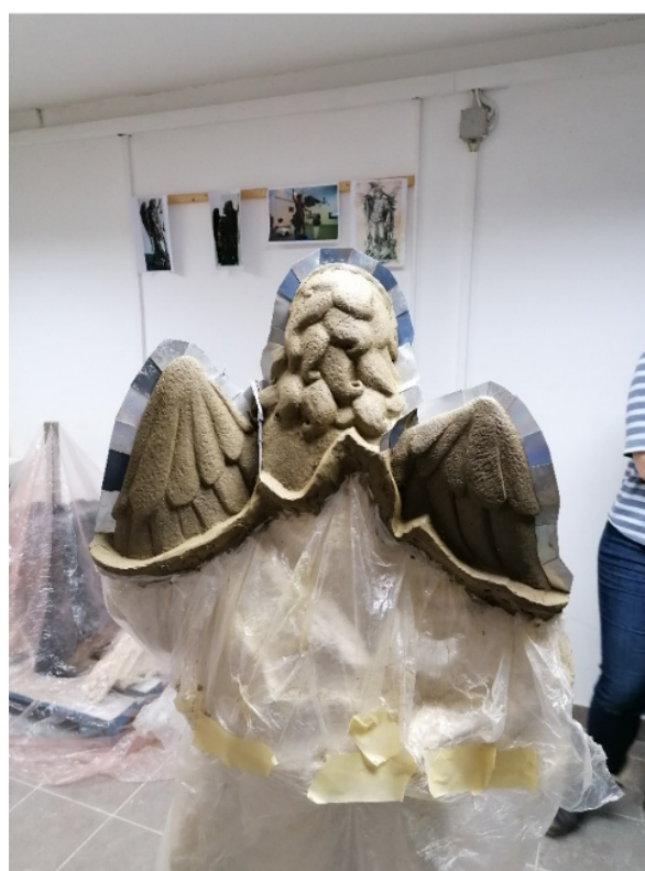
Slike 33 – 36. Pripreme za lijevanje u gipsu, snimila E. Baričević 2020.