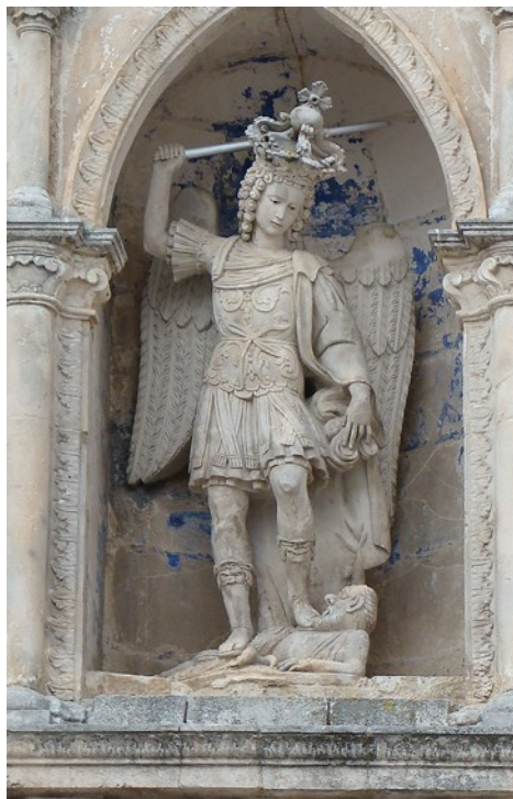
Slike 13 – 14. Primjer drvene polikromirane skulpture Sv. Mihaela (sredina 18. st.?), Muzej Slavonije (lijevo). Skulptura sv. Mihaela s visoko podignutim mačem u svetištu Monte Sant'Angelo, Gargano, Italija (desno).