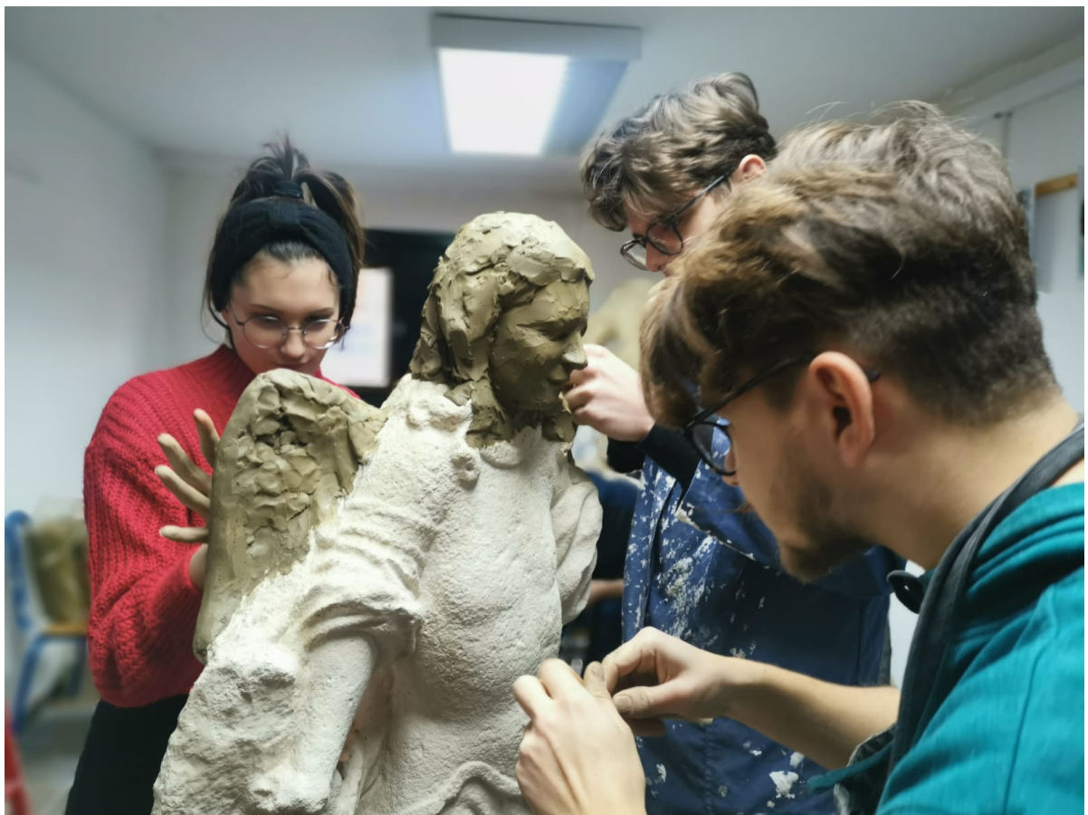
Slike 23 – 25. Početak i tijek rekonstrukcije u glini 2020.