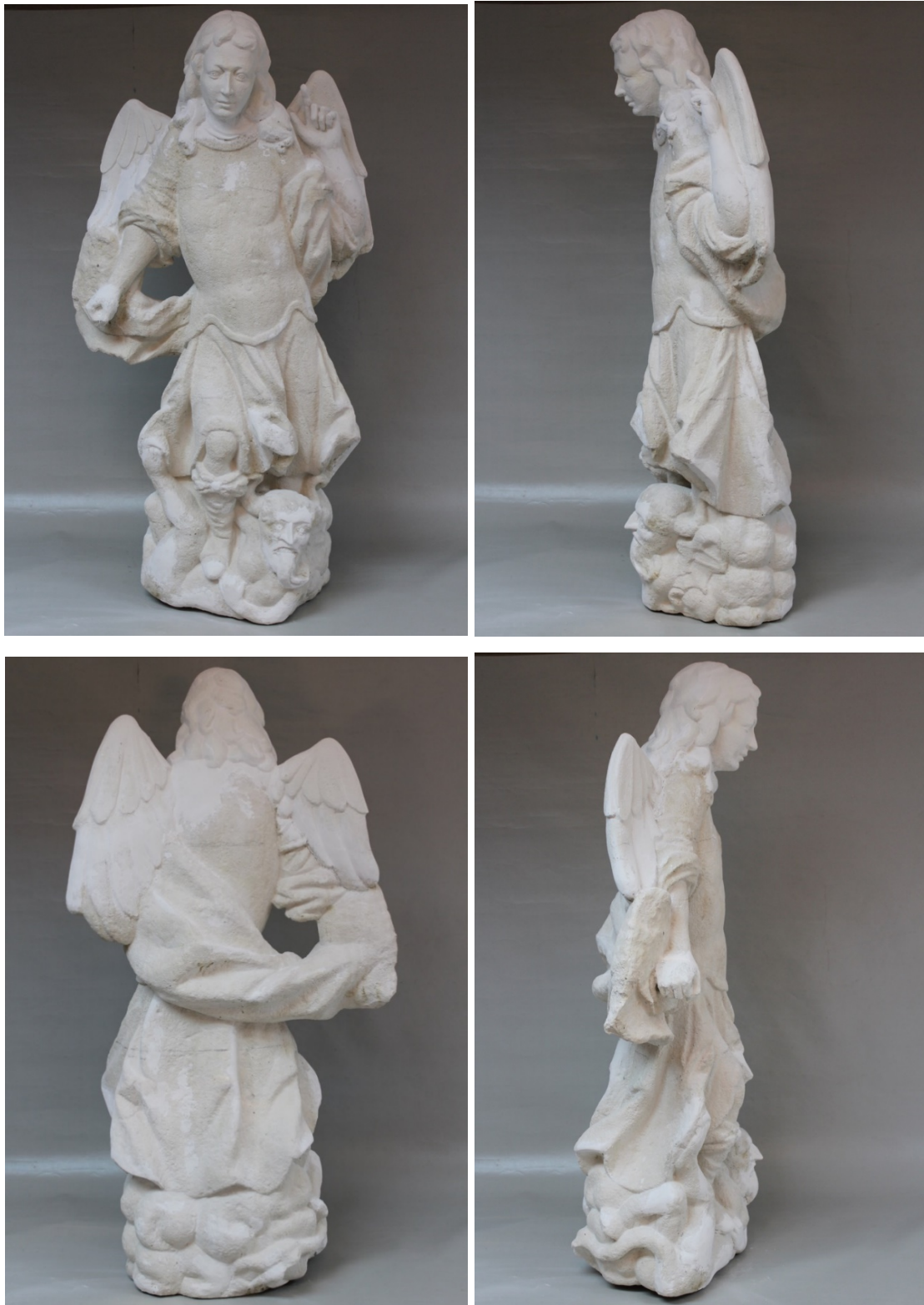
Slike 43. – 46. Fotografije rekonstruirane skulpture – gipsanog odljeva s rekonstruiranim dijelovima, snimila E. Baričević 2020.