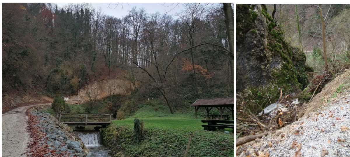
Slike 3 – 4. Lokalitet Vražja peč, snimila Z. Jembrih, listopad 2018.

Detaljan istraživački rad, brojne konzultacije i pronalaženje komparativnih primjera pridonijeli su izradi kopije na kojoj su rekonstruirani nedostajući dijelovi skulpture.