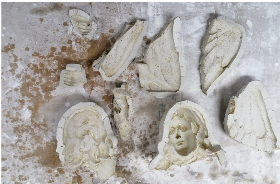
Slika 40. Gipsani kalupi, snimila E. Baričević 2020.