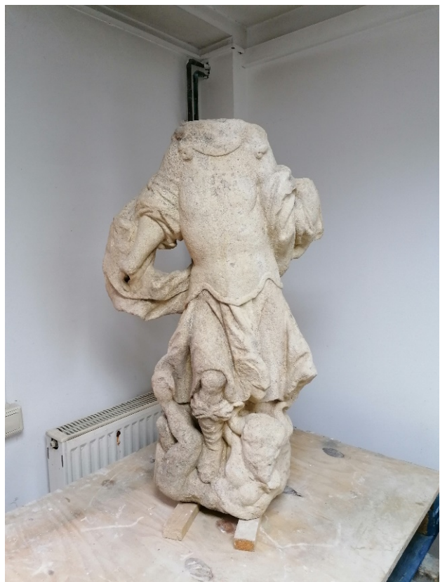
Slike 18 – 19. Skulptura tijekom i nakon čišćenja 2018.