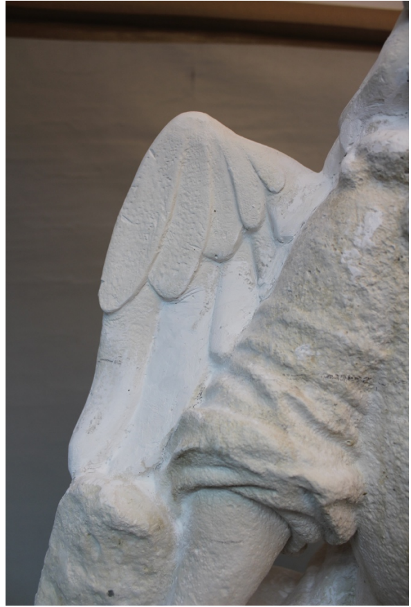
Slike 48 – 49. Detalji rekonstruiranih dijelova, snimila E. Baričević 2020.