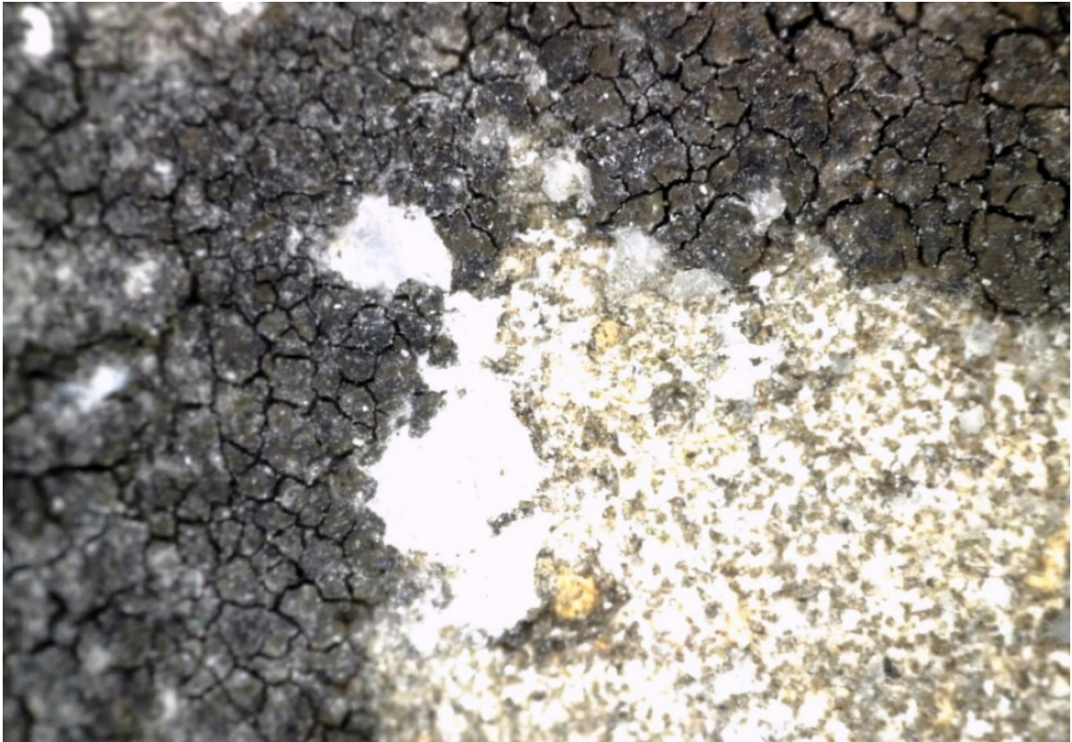
Slika 17. Snimka kamene površine skulpture dino – lite mikroskopom, snimio A. Novoselec 2018.