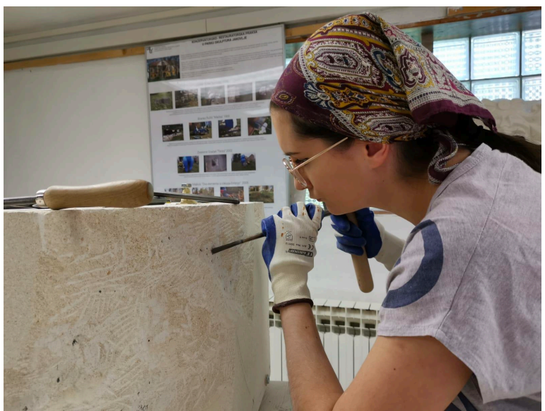
Slike 51 – 53. Punktiranje i klesanje dijelova kopije u kamenu, snimila I. Blažičko 2020.