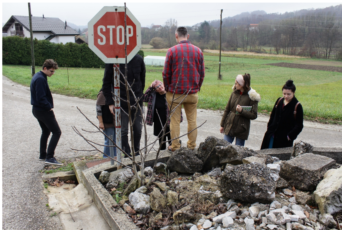
Slika 9. Mjesto pronalaska skulpture na raskršću Višnjevac - Sopot - Vražja peć, snimio R. Erdelji, siječanj 2019.

Zatim je provedeno istraživanje i fotografiranje terena – mjesta pronalaska skulpture na raskršću Višnjevac - Sopot - Vražja peć; lokaliteta Vražja peć i potoka Sopotnica.