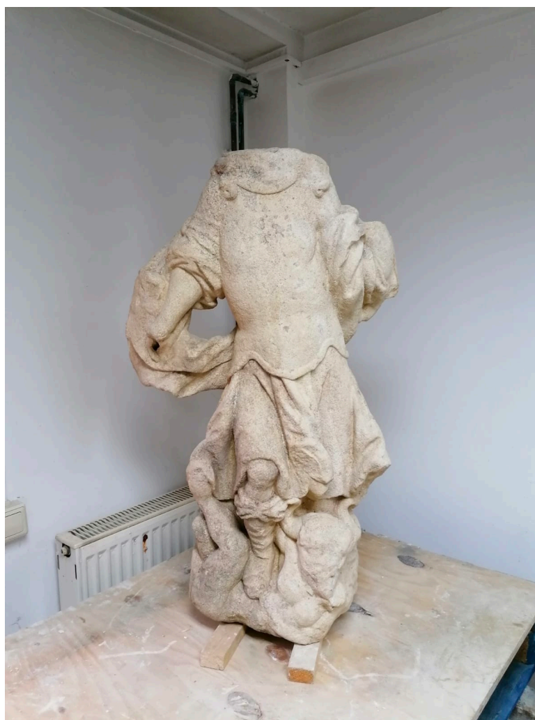
Slika 15. Fotografija izvorne skulpture, snimila E. Baričević 2019.

Skulptura, iako jako oštećena atmosferskim, biološkim, mehaničkim i naposljetku vandalskim utjecajima, nije potpuno izgubila svoj izvorni izgled. Manji, ali još vidljivi broj bitnih mjesta na kamenoj površini sadrži tragove izrade skulpture - poput tragova ravnog dlijeta i tzv. gradine koji nam govore o obradi površine izvorne skulpture, odnosno o obradi tradicionalnim alatima koji datiraju još iz doba antike, a koriste se i danas. Postoje mnoge vrste kamena, ali samo određene vrste su pogodne za klesanje u ekonomskom i fizičkom smislu s obzirom na područje pronalaska skulpture. Struktura površine skulpture i njezin školjkasti sastav nam govore da se radi o vrsti pješčenjaka.