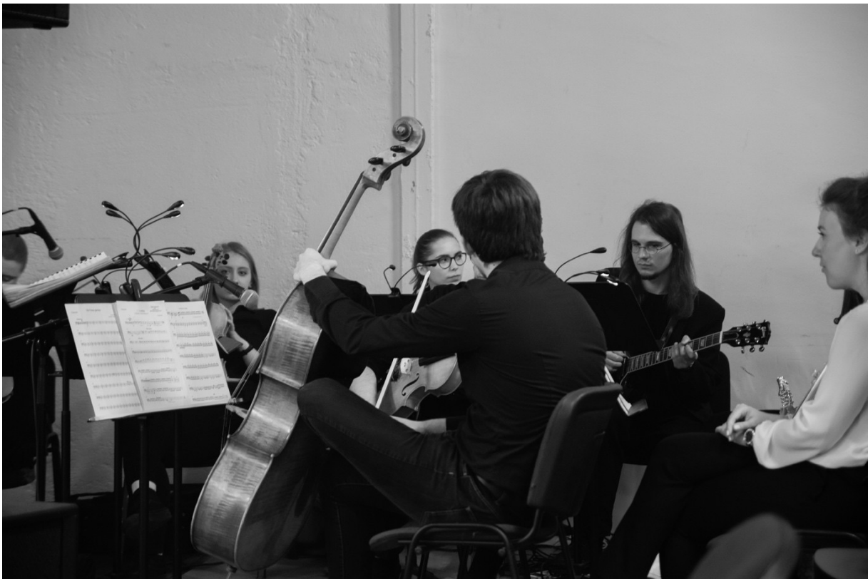
Slika 11. Orkestar tijekom jedne od izvedbi u F22

Tijekom probi studenti odsjeka novinarstva Fakulteta političkih znanosti snimili su 3 sata materijala s više lokacija (Dvorana Akademije dramske umjetnosti F22, GK Komedija, prostor Učiteljskog fakulteta, šivaće radione Tekstilno-tehnološkog fakulteta) i o procesu stvaranja glazbeno-scenskog djela napravili dokumentarni film od 16 minuta.