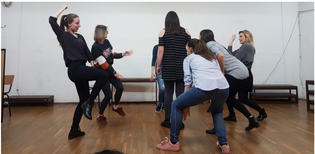
Slika 1. Pjevačko-scenske probe na Učiteljskom fakultetu