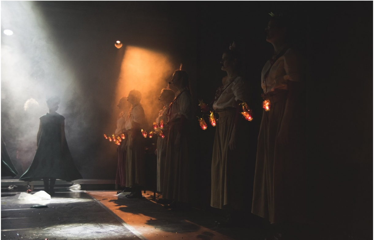
Slika 8. Izvođači na sceni tijekom jedne od izvedbi u F22