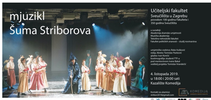
Slika 12. Plakat za svečanu izvedbu u GK

Svečana izvedba povodom 100 godina postojanja Učiteljskog fakulteta, 4. listopada 2019. održana je u GK Komedija.