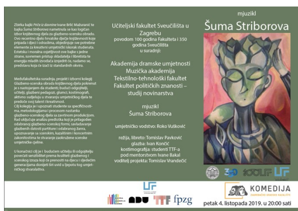
Slika 13. Tiskana programska knjižica za izvedbu u GK Komedija

Svečana izvedba povodom 100 godina postojanja Učiteljskog fakulteta, 4. listopada 2019. održana je u GK Komedija.