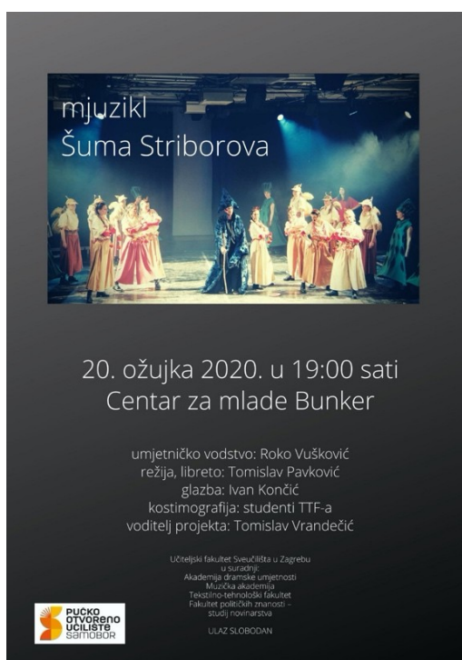
Slika 21. Plakat za izvedbu u Samoboru