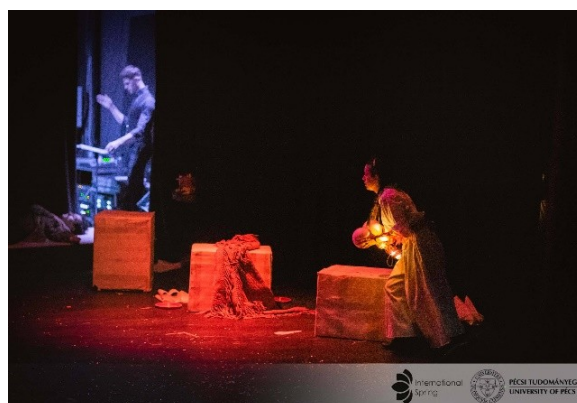
Slika 19. Izvođači tijekom izvedbe u Pečuhu