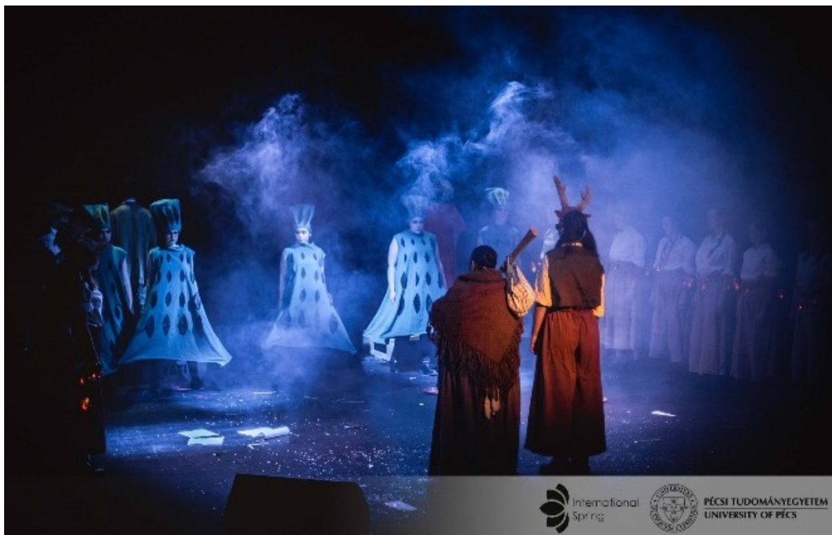
Slika 17. Izvođači tijekom izvedbe u Pečuhu