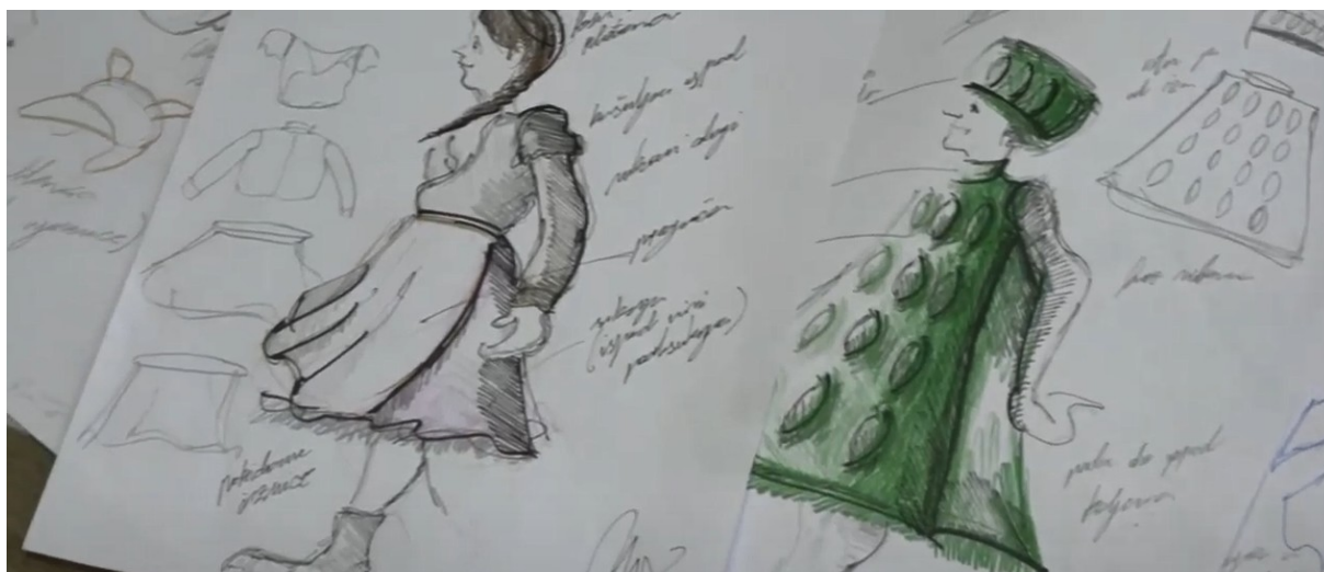
Slika 3. Skice kostima

stražna suradnica Đurđica Kocijančić i asistentica Sanja Jakupec.