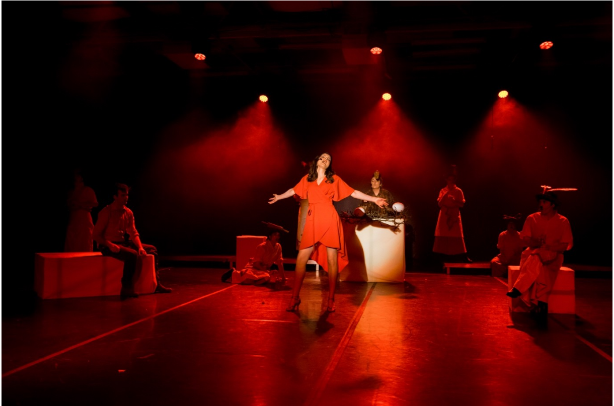
Slika 7. Izvođači na sceni tijekom jedne od izvedbi u F22