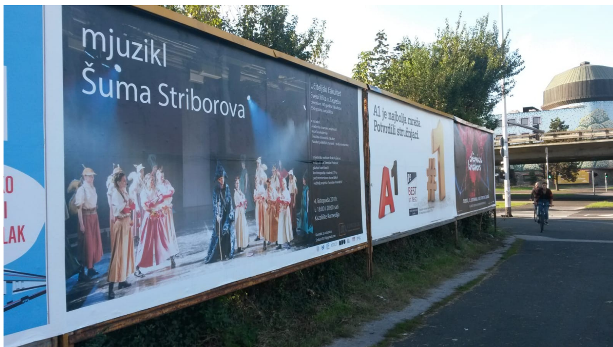
Slika 22. Jumbo plakat za svečanu izvedbu u GK Komedija