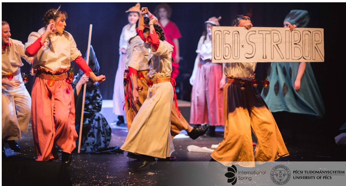
Slika 20. Izvođači tijekom izvedbe u Pečuhu