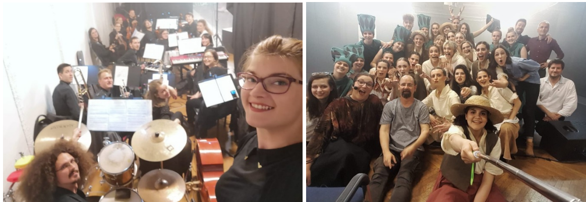
Slika 5. Orkestar i pjevači na probi u F22

U trećoj fazi rada studenti su na zajedničkim probama pjevača i orkestra izvodili mjuzikl scenu po scenu i tako usklađivali glumački i instrumentalni dio predstave.