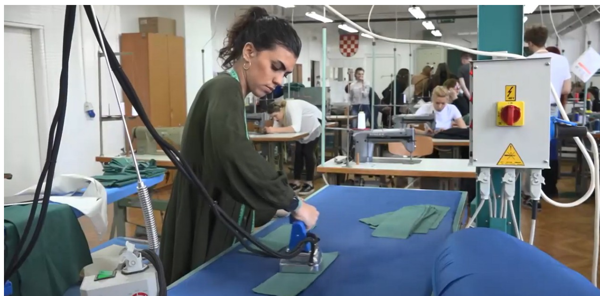
Slika 4. Izrada kostima u radionici TTF-a