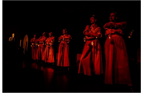
Slika 10. Izvođači na sceni