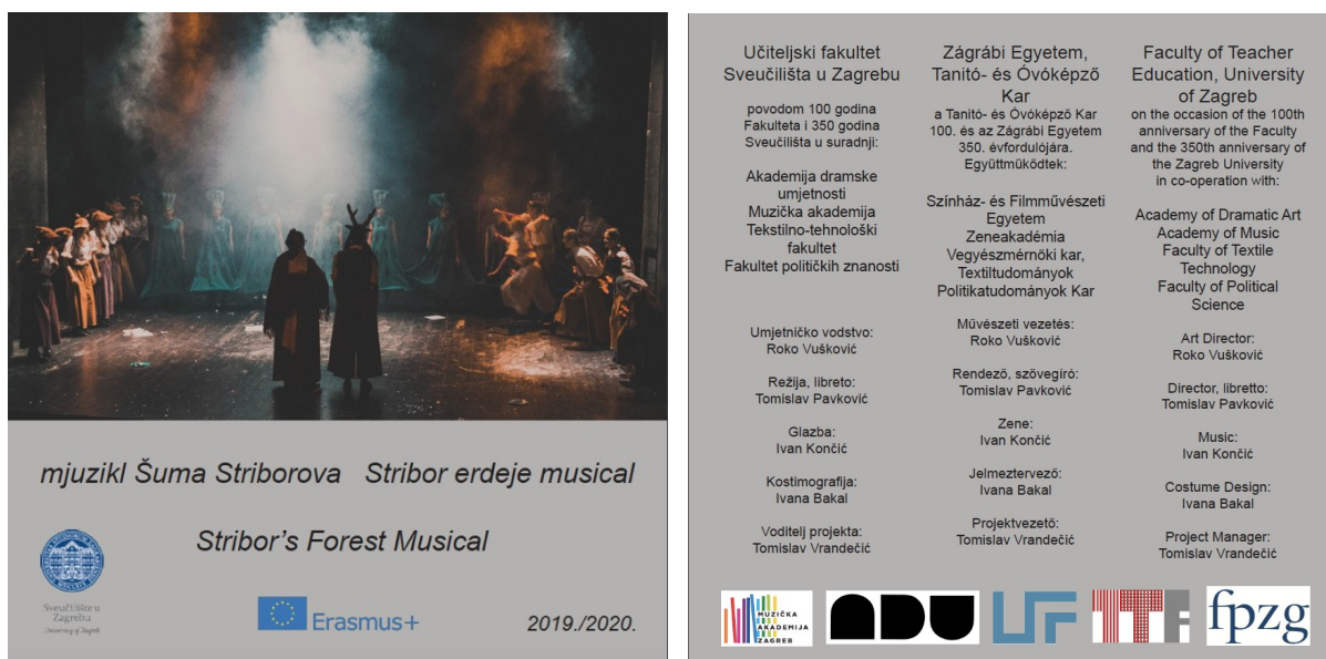
Slika 16. Katalog (prva i posljednja strana) za izvedbu u Hrvatskom kazalištu u Pečuhu

Nastup u Hrvatskom kazalištu u Pečuhu 5. ožujka 2020., u organizaciji Ureda za međunarodnu suradnju Sveučilišta u Zagrebu, gđe. Branke Rošćić i Sveučilišta u Pečuhu u sklopu međunarodnih dana Sveučilišta u Pečuhu.