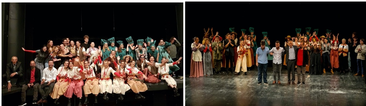
Slika 15. Izvođači i mentori prije i nakon svečane izvedbe u GK Komedija