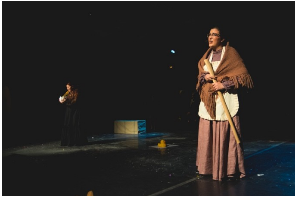
Slika 9. Izvođači na sceni