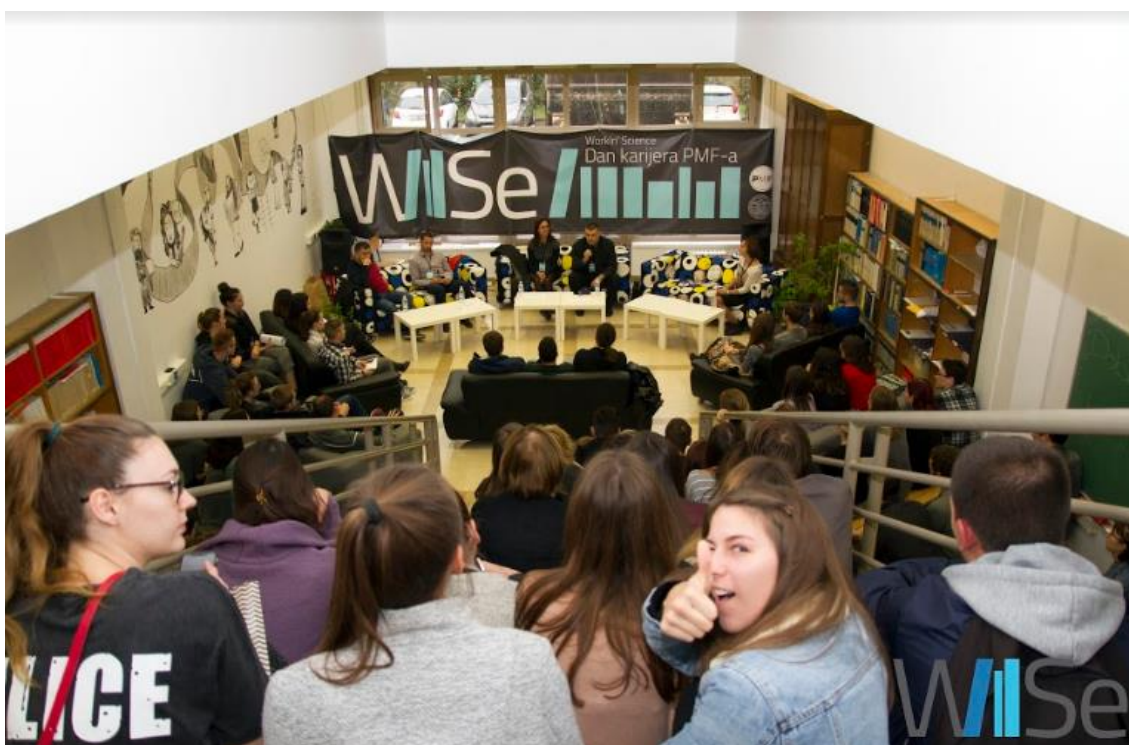
Slika 4. Okrugli stol

Uz Okrugle stolove odsjeka održan je i Nastavnički okrugli stol kako bi se potaknula želja za radom u školstvu, prosvjeti te općenito rad s djecom. Studentu nastavničkih smjerova dobili su uvid i savjete za interakciju s djecom i učenicima svih uzrasta.