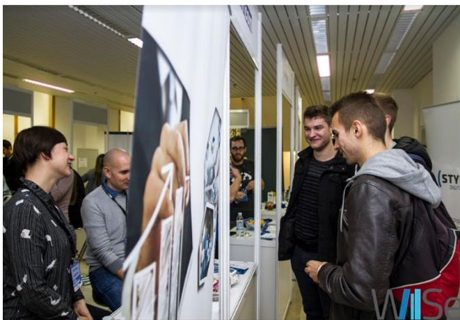
Slika 1. izložbeni prostor

Za izložbeni prostor bile su predviđene tri etaže (slika 2.) u prostorima Kemijskog odsjeka Prirodoslovno-matematičkog fakulteta. Tvrtkama je uz prostor bio osiguran