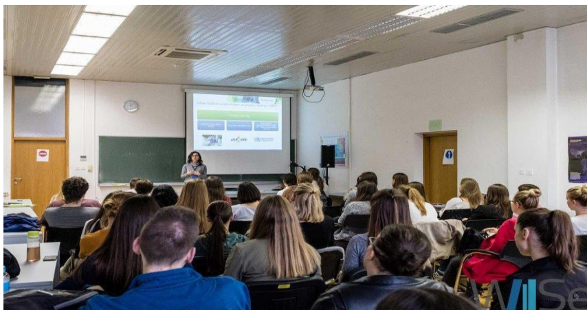
Slika 3. predavanja

Osim na izložbenim prostorima, neke tvrtke su se odlučile predstaviti i putem predavanja (slika 3.) na kojima su mogle pobliže prikazati radnu atmosferu koja vlada u njihovim prostorima i spektar mogućnosti koje nude svojim zaposlenicima. Predavanja su održavana paralelno u dvije predavaonice Kemijskog odsjeka. Predavanjima su upravljali moderatori, a tvrtkama je za predavanje na raspolaganju bilo pola sata vremena. U prostorijama Geološkog odsjeka održavala su se predavanja profesora koji su završili neke od nastavničkih smjerova Prirodoslovno-matematičkog fakulteta.