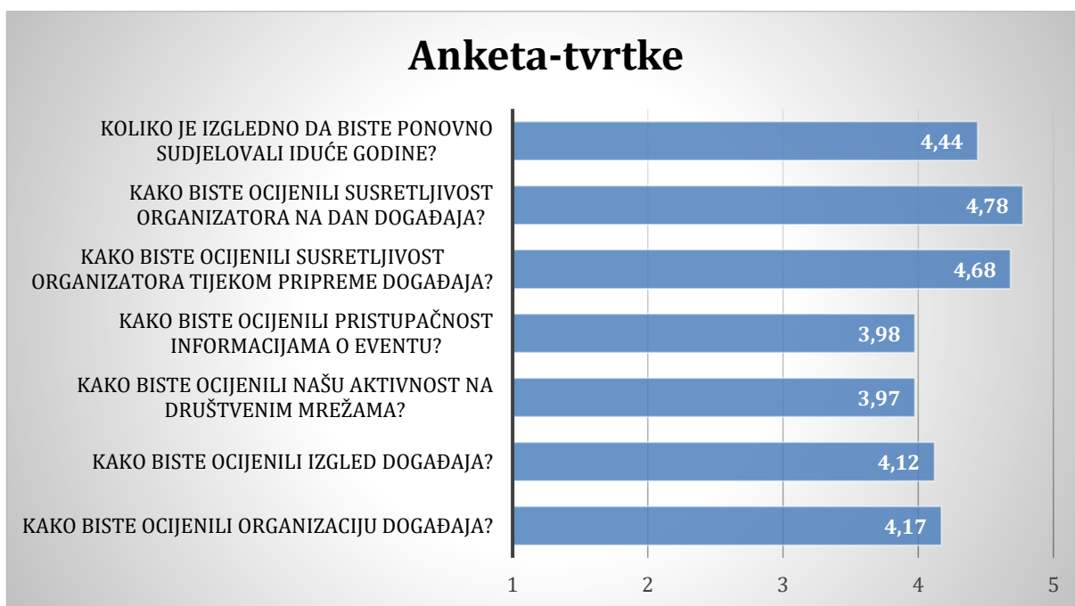
Slika 5. rezultati anketa tvrtki

U anketama obuhvaćena su pitanja od organizacije i izgleda samog događaja preko aktivnosti na društvenim mrežama do iskazivanja želje za ponovnim sudjelovanjem. Zaprimiti rezultati su odlični (slike 5. i 6.); sve ispitivane stavke ocjenjene su vrlo dobro ili odlično. Komunikativnost i susretljivost organizatora je dobila najviše pohvala. No, ima i sugestija i kritika poput snalaženja u prostoru fakulteta, postavljanja dodatnih uputa i smjernica, kao i prijedlog da se krene ranije i bolje u promociji. Svi ovi komentari predstavljaju prostor za razvoj i napredovanje u izvedbi događaja na čemu će, svakako, biti fokus u daljnjem planiraju Dana karijera.