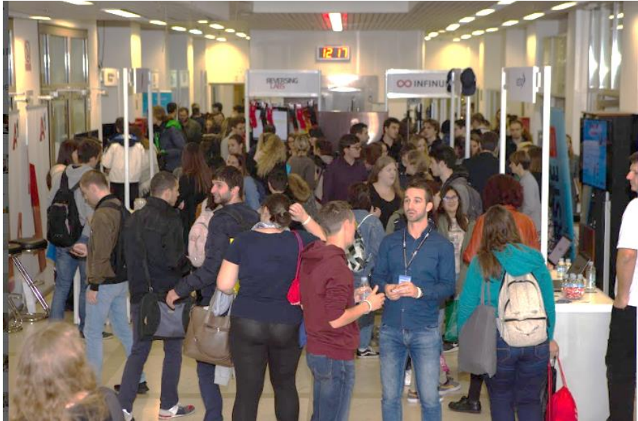
Slika 2. posjećenost eventa