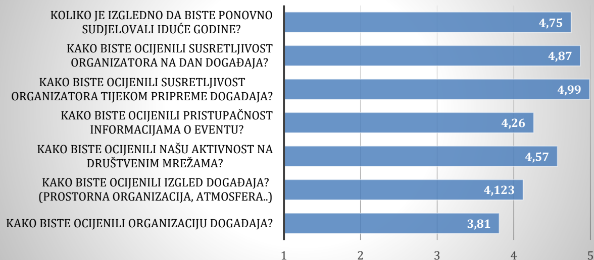
Slika 6. rezultati anketa nastavnika