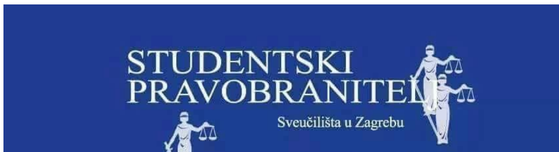
Slika 5. Logotip studentskog pravobranitelja Sveučilišta u Zagrebu