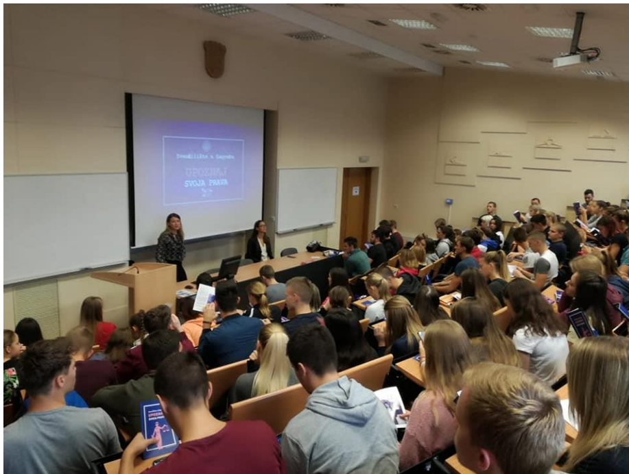
Slika 4. Predavanje „Upoznaj svoja prava“ na Kineziološkoma fakultetu Sveučilišta u Zagrebu

18.10.2018. Prehrambeno biotehnološki fakultet, 16h 19.10.2018. Stomatološki fakultet, 15.30h 23.10.2018. Rudarsko geološko naftni fakultet, 16h 24.10.2018. Geotehnički fakultet, 13h 24.10.2018. Fakultet organizacije i informatike, 15h 25.10.2018. Katoličko bogoslovni fakultet, 12h 25.10.2018. Farmaceutsko biokemijski fakultet, 15h 26.10.2018. Medicinski fakultet, 13h 5.12.2018. Agronomski fakultet, 14h 5.12.2018. Prirodoslovno matematički fakultet, 17h 6.12.2018. Fakultet kemijskog inženjerstva i tehnologije, 14h 10.12.2018. Fakultet elektrotehnike i računarstva, 12h 12.12.2018. Metalurški fakultet, 11h 18.12.2018. Fakultet filozofije i religijskih znanosti, 10h 10.1.2019. Tekstilno tehnološki fakultet, 12h