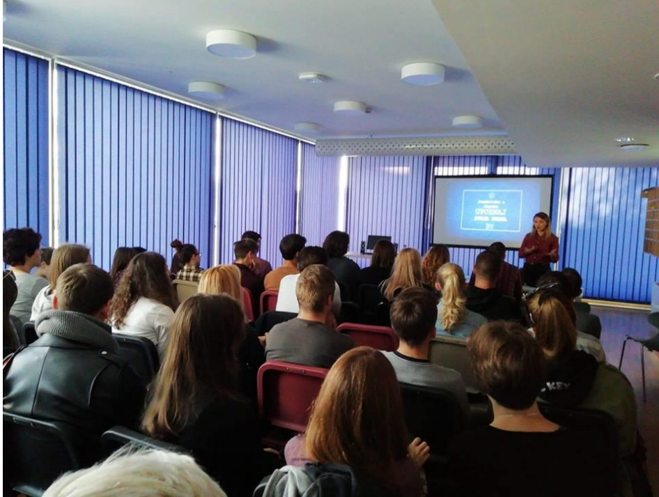
Slika 5. Predavanje „Upoznaj svoja prava“ na Muzičkoj akademiji Sveučilišta u Zagrebu

Osim ciklusa predavanja odlučili smo, ono što je možda i najbliže i najdostupnije mladim generacijama, pokrenuti kampanju na društvenim mrežama preko službene Facebook stranice Studentskog pravobranitelja Sveučilišta u Zagrebu, „Upoznaj svoja prava“ gdje u kraćim vremenskim razdobljima objavljujemo najčešća pitanja i odgovore, a koji su sadržani u brošuri ili su se pojavili u radu studentske pravobraniteljice. Odaziv, odnosno, pregled takvih objava je izniman, što nas je poučilo kako treba koristiti blagodati tehnologije 21. stoljeća te internetska sučelja poput društvenih mreža za komunikaciju sa studentskom populacijom.