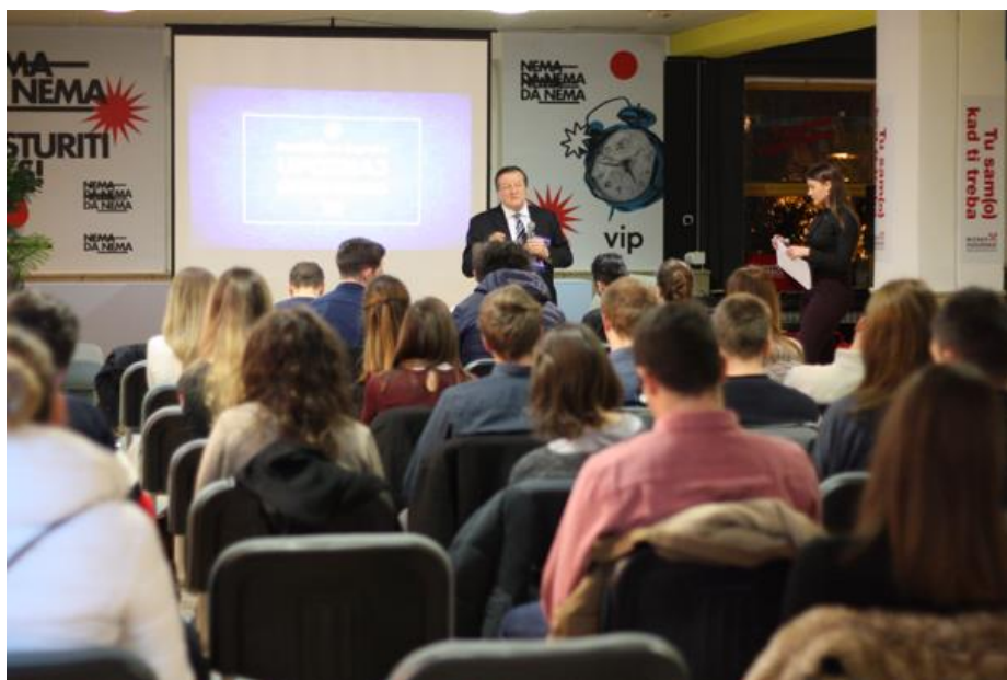
Slika 3. Rektor Sveučilišta u Zagrebu, prof. dr. sc. Damir Boras s okupljenim studentima u prostoru Stabla znanja

Osim centralnog i prvog predavanja u Studentskom centru i dobrog prihvaćanja predavanja od strane okupljenih studenata odlučili smo posjetiti studente i na njihovim matičnim fakultetima. Do sada je projekt „Upoznaj svoja prava“ posjetio gotovo sve sastavnice Sveučilišta u Zagrebu, a predavanja su održana kako slijedi: