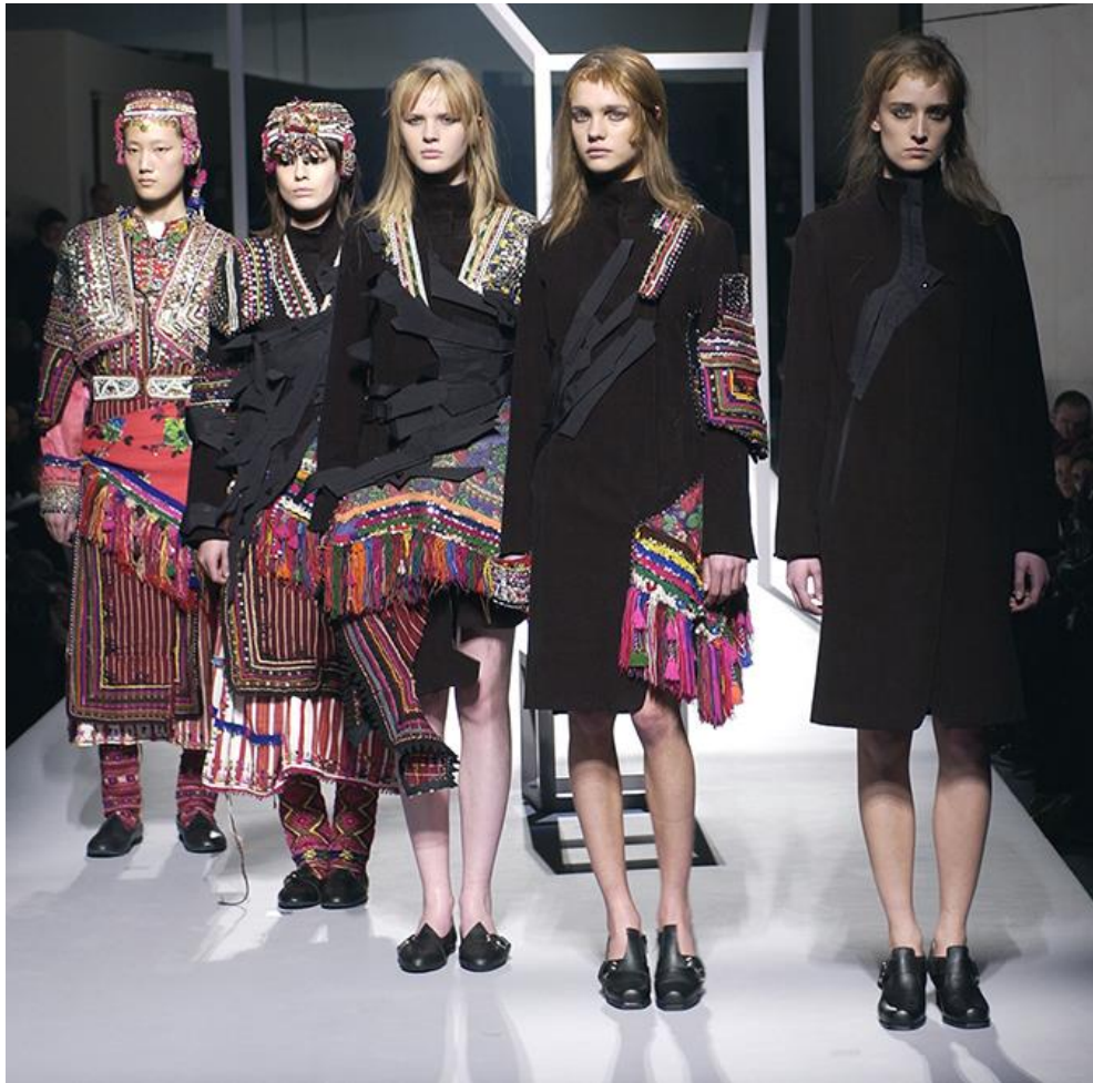
Slika 5. Ambimorphous , kolekcija jesen/zima 2002.