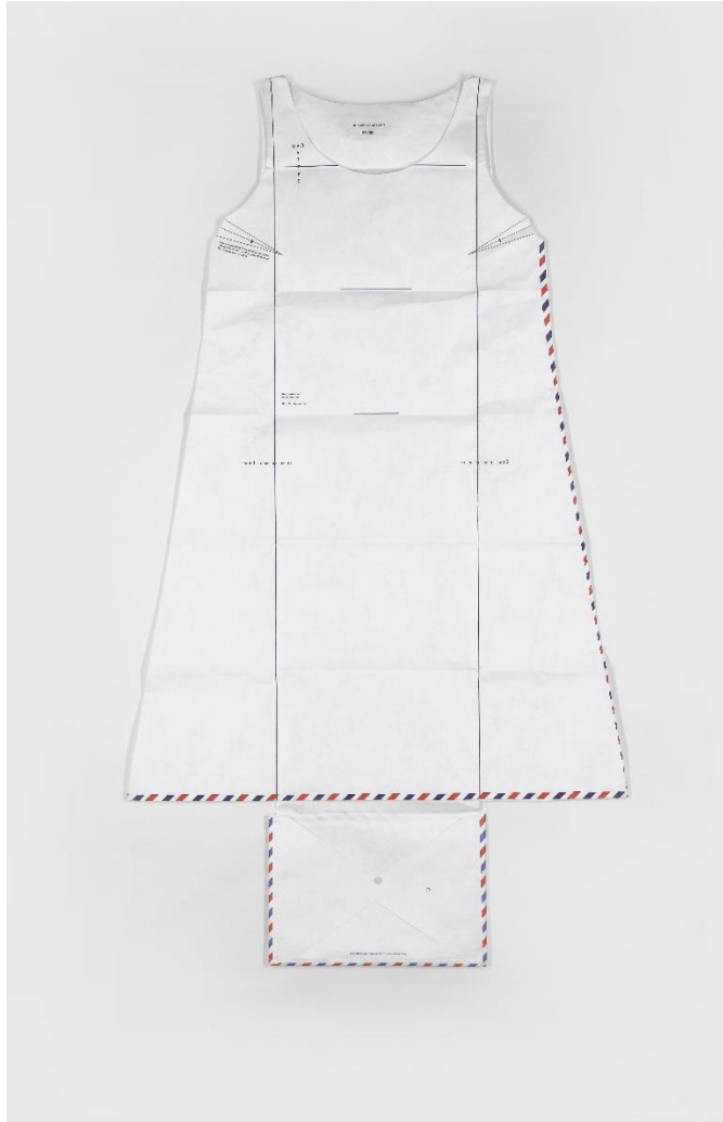
Slika 3. Airmail Dress , 1999.