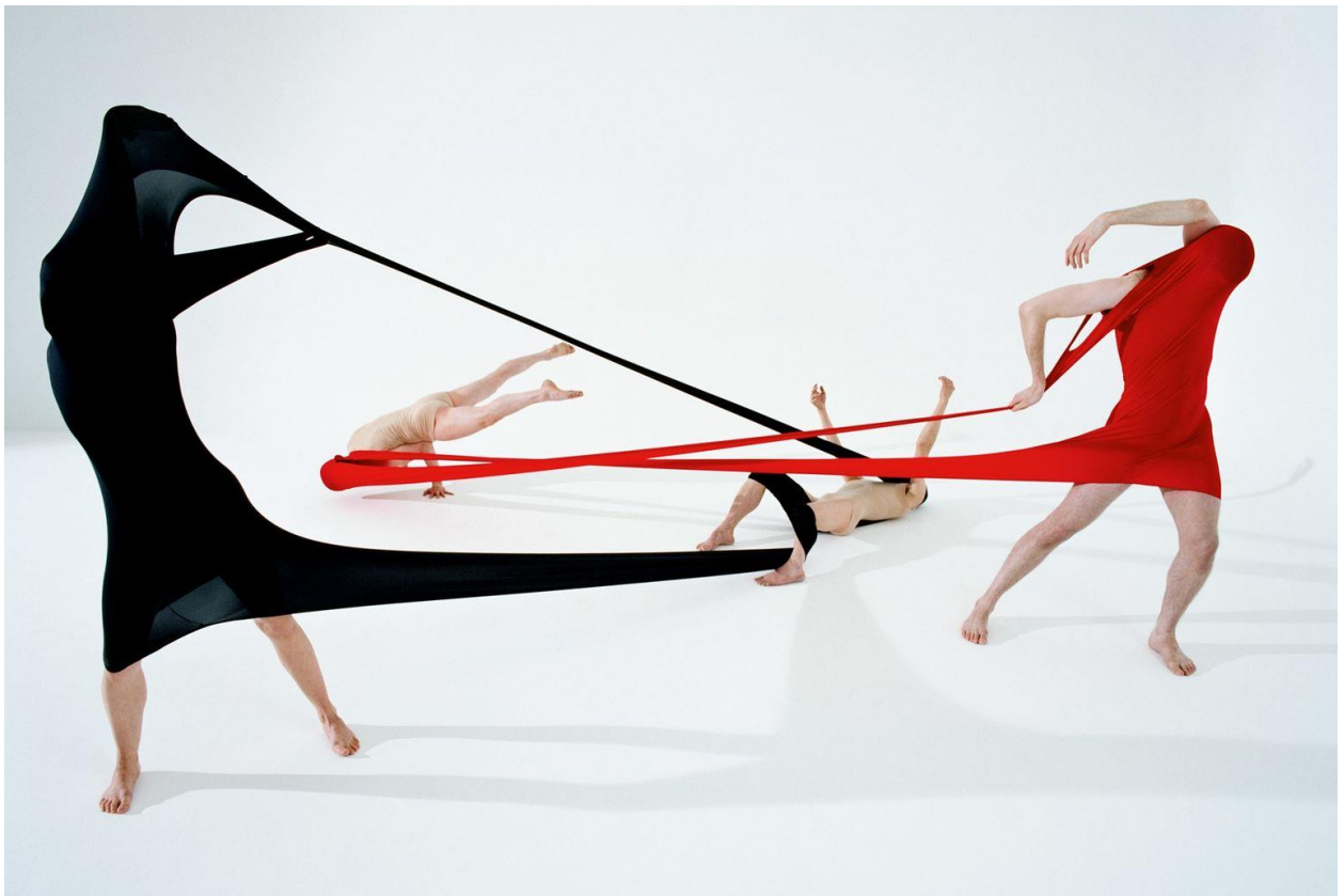
Slika 4. Elastic Body, Gravity Fatigue , 2015.