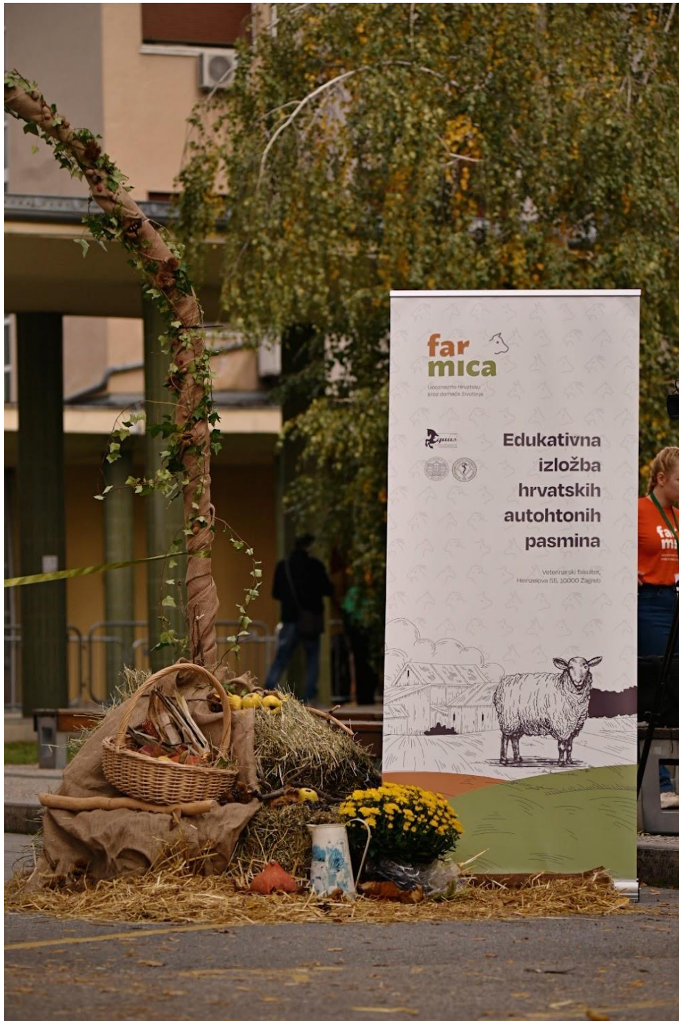
Slika 7.: dekoracije i promo materijali