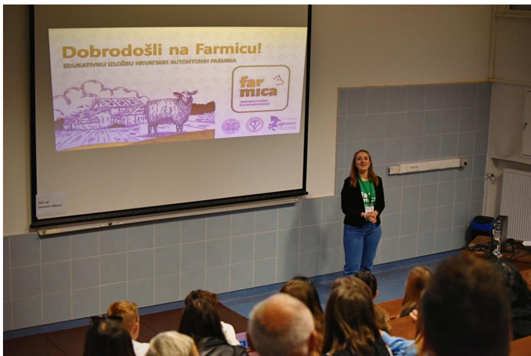
Slika 18: predavanje za učenike

Edukacijom odgojno-obrazovnih kadrova osiguravamo da ova grana i način života na selu, koji su polako zasjenjeni razvojem industrijskog stočarstva, ne odlazi u zaborav i nastavlja se cijeniti kao nematerijalna kulturna baština u općoj i akademskoj zajednici. Iz tih, a i ostalih razloga, U.S.V.M. "EQUUS" teži ka uključivanju osnovnih i srednjih škola te ostalih odgojno-obrazovnih institucija u provedbu projekta kroz edukativna predavanja.