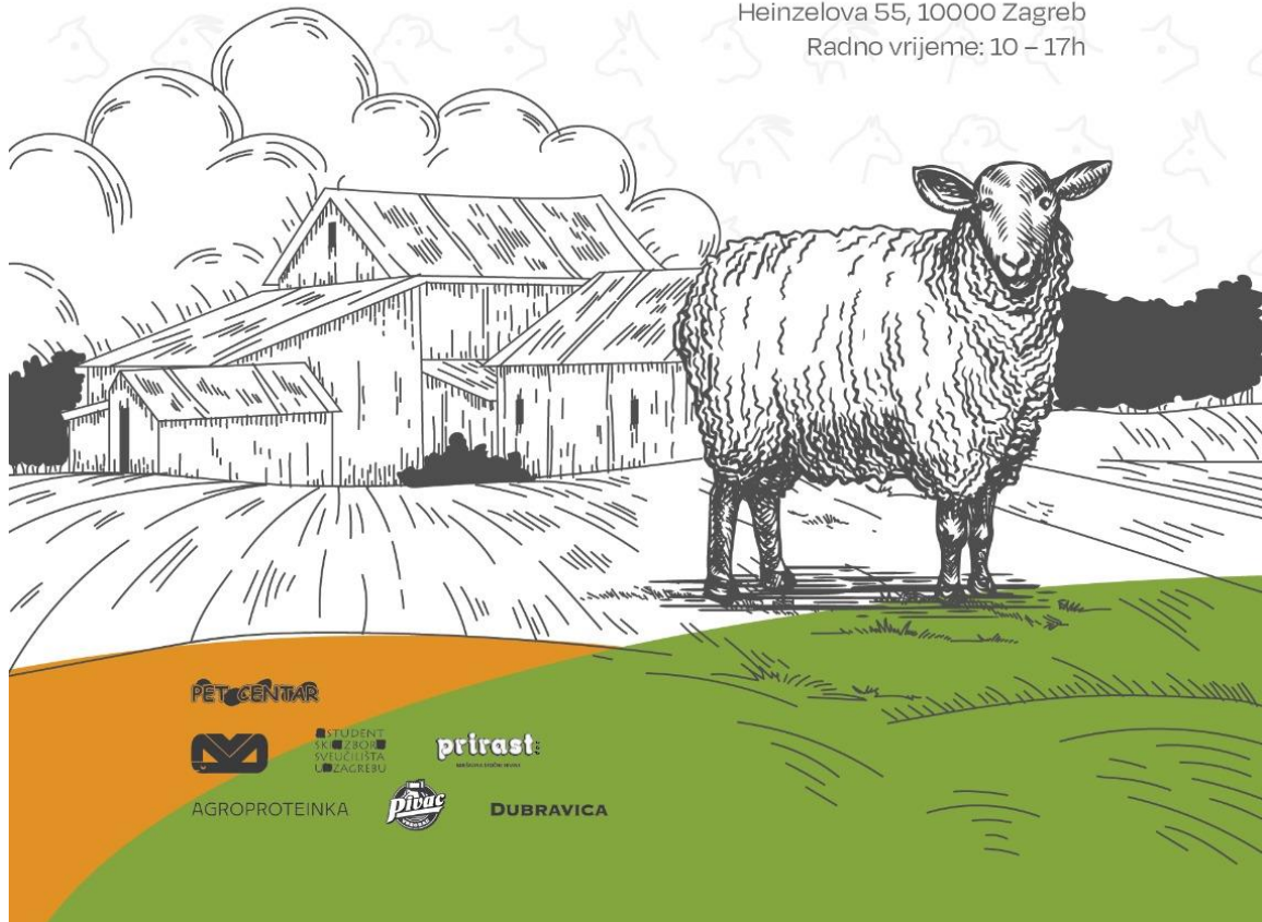
Slika 21.: promotivni plakat za izložbu

Veterinarski fakultet, Heinzelova 55, 10000 Zagreb Radno vrijeme: 10 – 17h