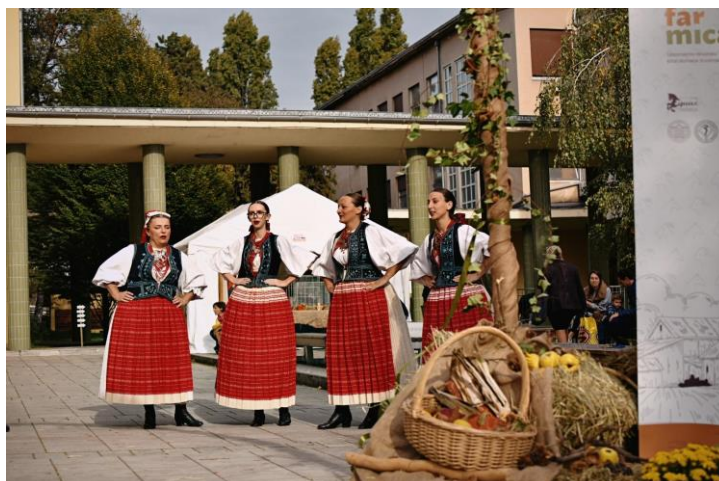
Slika 12: KUD Sveta Ana

Na otvaranju izložbe nastupilo je Kulturno umjetničko društvo Sveta Ana u tradicionalnim nošnjama i uz tradicionalne korake hrvatskih plesova. Smatra se da je folklor, tj. tradicionalni ples, usko vezan za autohtone pasmine kao što su boškarin i buša, jer kroz priče koje su se pričale u pjesmama folkloru su bili česta tema. Također je folklor dio nematerijalne kulturne baštine, u što se nadamo da će se jednog dana službeno ubrojiti i autohtone hrvatske pasmine.