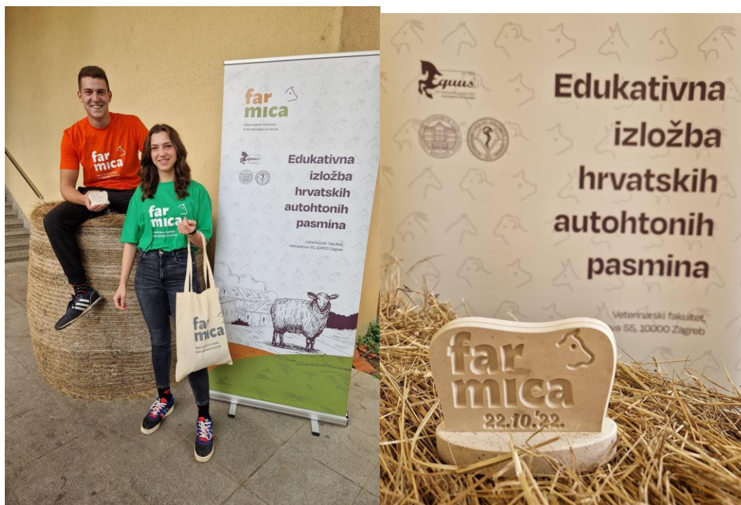
Slike 19. i 20.: promotivni materijal za izložbu

O uspješnosti izložbe, osim brojnih posjetitelja, posvjedočila je i velika medijska popraćenost na televizijskim i radijskim postajama, informativnim mrežnim portalima (Prvi i Drugi program hrvatskog radija, Radio Sljeme, Antena, Top radio, Radio student, HRT1 – emisije Magazin i Dobro jutro, HRT4 - Sveučilišna Hrvatska, Z1 televizija, portali Belizagrebgrad, Agroklub, Veterina, srednja.hr, studentski.hr, poslovni.hr, infokiosk.net te objava događaja na stayhappening.com i allevents.in) i društvenim mrežama (društvene mreže Udruge, projekta, Veterinarskog fakulteta, sudionika i izlagača, službeni Facebook profil ministrice poljoprivrede Marije Vučković) što je snažan poticaj da se izložba organizira i sljedeće akademske godine kako bi se istaknula potreba za njegovanjem i održavanjem ovog oblika hrvatske proizvodnje. Također se veliki naglasak stavljao na postavljanje promotivnih materijala (letci, plakati, roll up banneri, promotivna majice i torbe, oglasne ploče i slično) sa karakterističnim grafičkim dizajnom koji je lako pamtljiv i asocira na sadržaj izložbe.