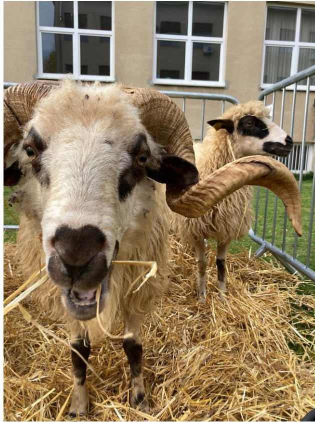
Slike 2., 3., 4., 5. i 6.: izložbene životinje

Ispred svake pripadajuće životinje postavljen je bio štafelaj (ljubaznošću ALU) na kojeg je bila naslonjena kappa ploča dimenzija 100 x 70 centimetara, na kojima su bile otisnute kratke činjenice o predmetnim pasminama. Prolazi između životinjskih nastambi bili su dekorirani u farmerskom stilu uz pomoć motiva koji se često nalaze na farmama kao što su bale sijena, košare, cvijeće, a sve je to doprinijelo tome da je kampus Veterinarskog fakulteta dobio dušu malog sajma na taj dan. Ulaz na izložbu bio je moguć sa sva tri ulaza na Veterinarski fakultet - s Darwinove, Heinzelove i Planinske ulice, a kako se posjetioци ne bi izgubili postavljeni su putokazi usmjereni na određene vrste životinja.