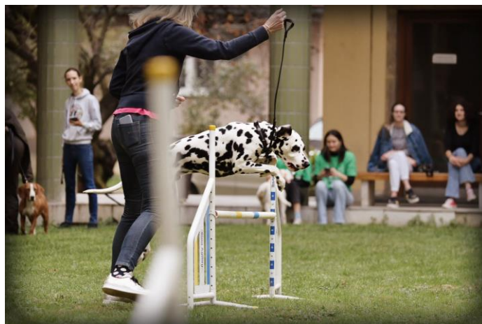
Slika 13: agility demonstracija

Organiziralo se i nekoliko demonstracija sa psima - od agility nastupa do poslušnosti i dresure, u sklopu kojeg su posjetitelji imali priliku čuti nešto o pripitomljavanju i povijesnom suživotu psa i čovjeka. Sve hrvatske autohtone pasmine su radne, većinski lovne i ovčarske, stoga su putem ovakvih demonstracija vlasnici prikazali sve sposobnosti svojih mezimaca i radnih partnera.