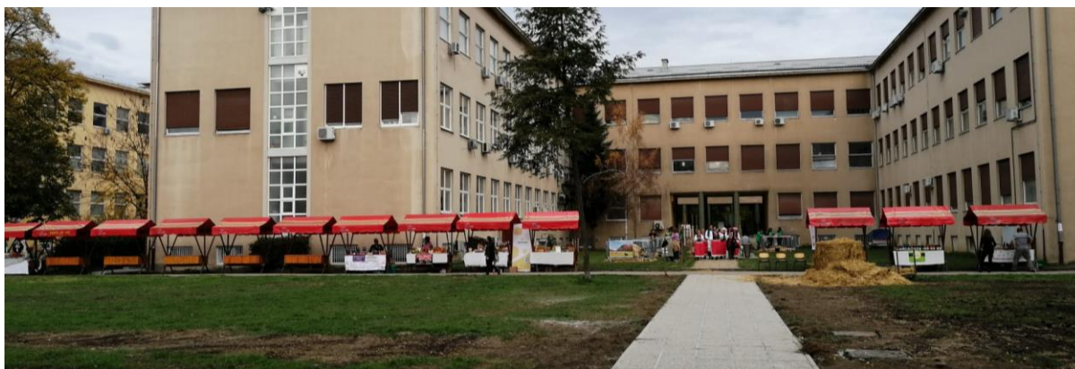
Slika 8.: štandovi sa OPGovima

U prolazu između pretklinika i klinika smjestilo se desetak štandova na kojem su pozvani OPGovi plasirali kako sebe, tako i svoje proizvode. Od meda do jabuka preko vune i rakije - svi proizvodi su bili s potpisom hrvatske proizvodnje i odražavali ono najbolje što hrvatska poljoprivreda može donijeti.