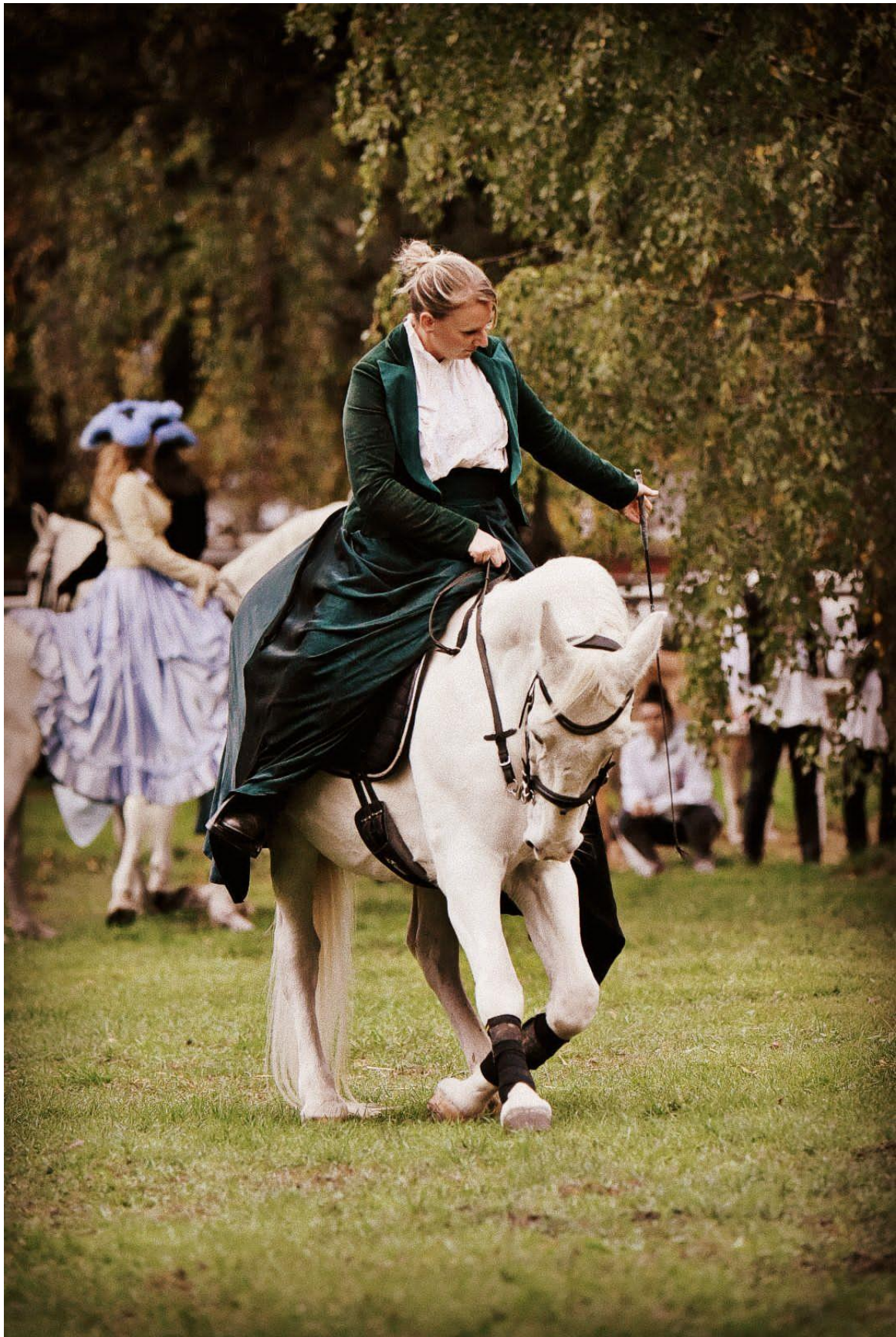
Slike 15., 16. i 17.: lipicanska barokna raskoš