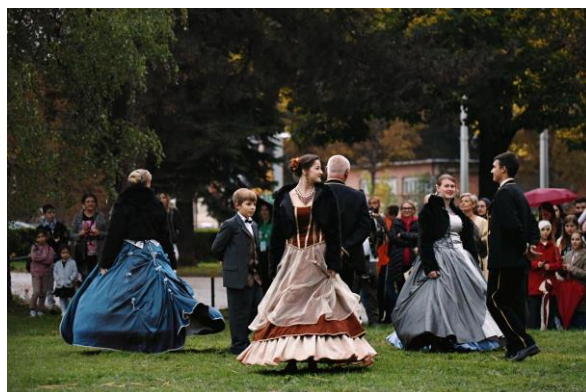
Slika 14: barokni ples

Kao šećer na kraju održao se scenski nastup lipicanske barokne raskoši u izvedbi partnerske Udruga De Nobiles Croatia. Izvela se glazbeno-scenska prezentacija baroknog umjetničkog jahanja kao sjajne slike hrvatske plemićke baštine. Uz scenski prigodnu glazbu, objasnilo se o uzgoju i namjeni carskih paradnih konja kroz zadnjih nekoliko stoljeća. Kako bi scena bila raskošnija i precizno predstavljala stanje visokog plemstva tog doba, uz konje i jahače nastupili su i sokolari s lovnim pticama. Lipiscanci su iznimno važna autohtona pasmina i sigurno najpredstavljanija naša pasmina u svijetu.