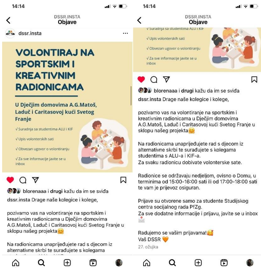
Slika 10. Instagram objava poziva za volontiranje