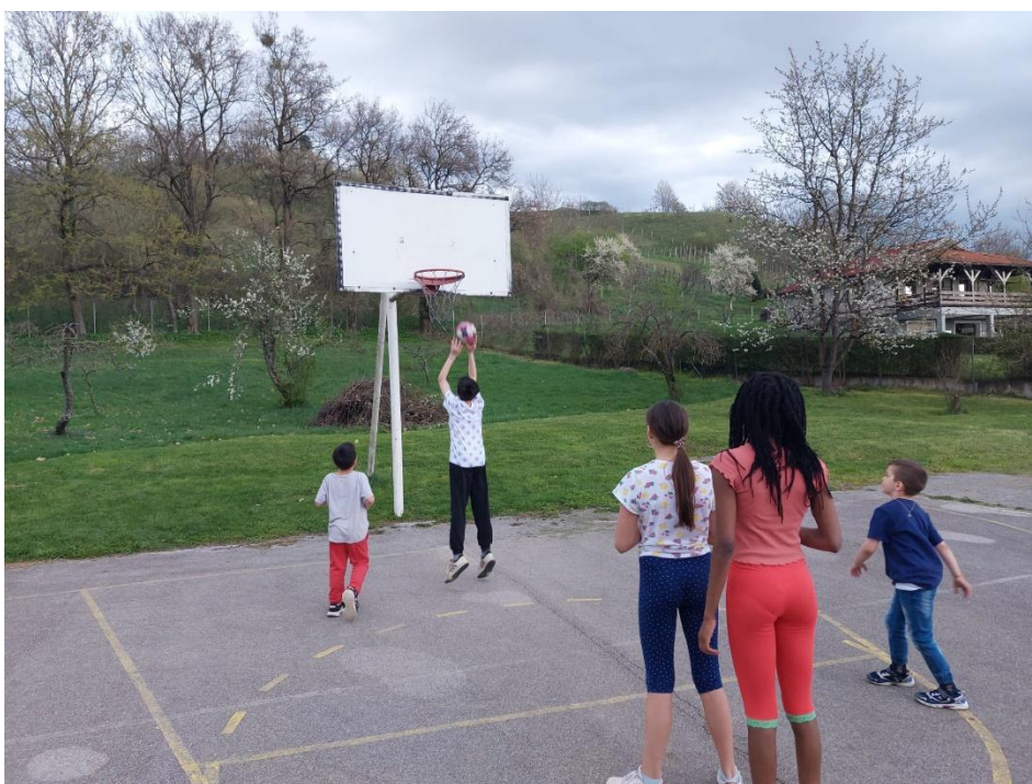
Slika 3. Izvođenje odabranog sporta - košarka