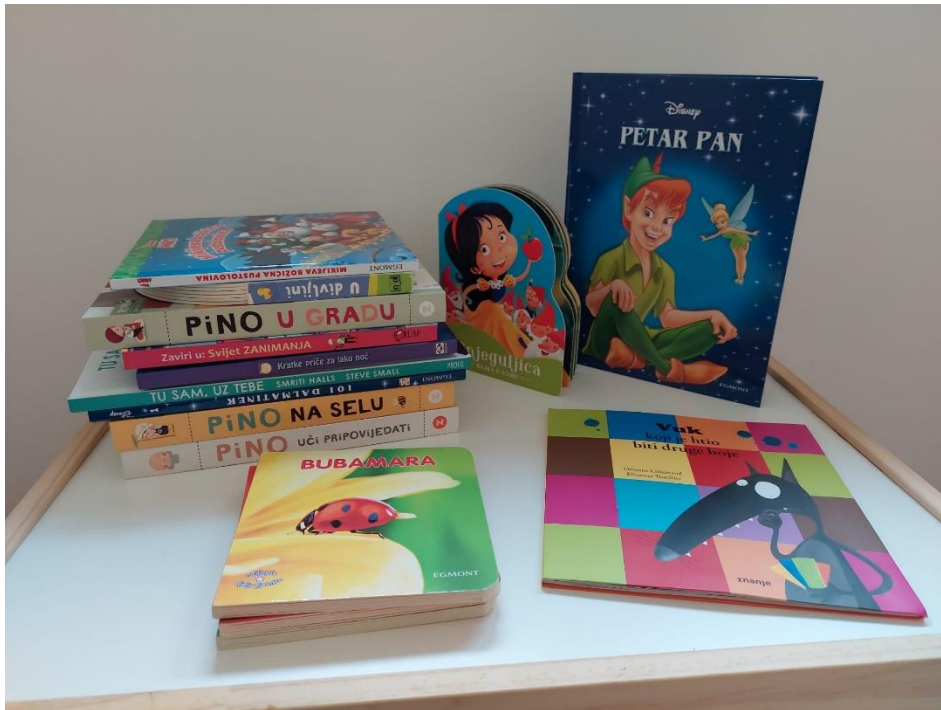
Slika 8. Donacija knjiga za djecu za čitanje prije počinka

Tijekom provedbe projekta s mentoricama, prof. dr. sc. Brankom Sladović - Franz i izv. prof. dr. sc. Vanjom Branicom, dogovoreno je kontinuirano provođenje supervizije za studente socijalnog rada koja će se održati u tri susreta tijekom travnja, svibnja i lipnja, odnosno svakih mjesec dana. Supervizija je važan segment za stručnjake u području socijalnog rada i valja ju primjenjivati već u akademskoj zajednici, „ona je naj snažnije oružje za smanjivanje profesionalnog stresa i osjećaja profesionalne osamljenosti, najpoticajnije okruženje za učenje novih vještina i promišljanje pristupa u radu“ (Ajduković, Potočki, Sladović, 1999., str. 29.). Supervizije su organizirane kako bi se pružila podrška i pomoć studentima da se nose s izazovnim situacijama tijekom provođenja radionica u Dječjim domovima kao i da uče na temelju svog iskustva i time unapređuju vlastite kompetencije.