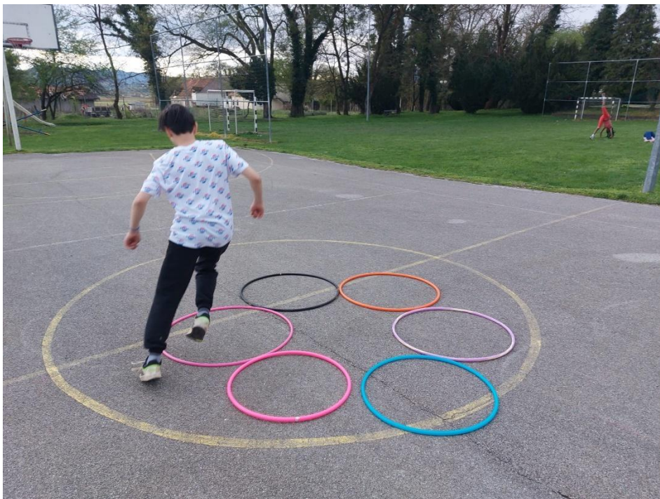
Slika 2. Izvođenje vježbe koordinacije i ravnoteže