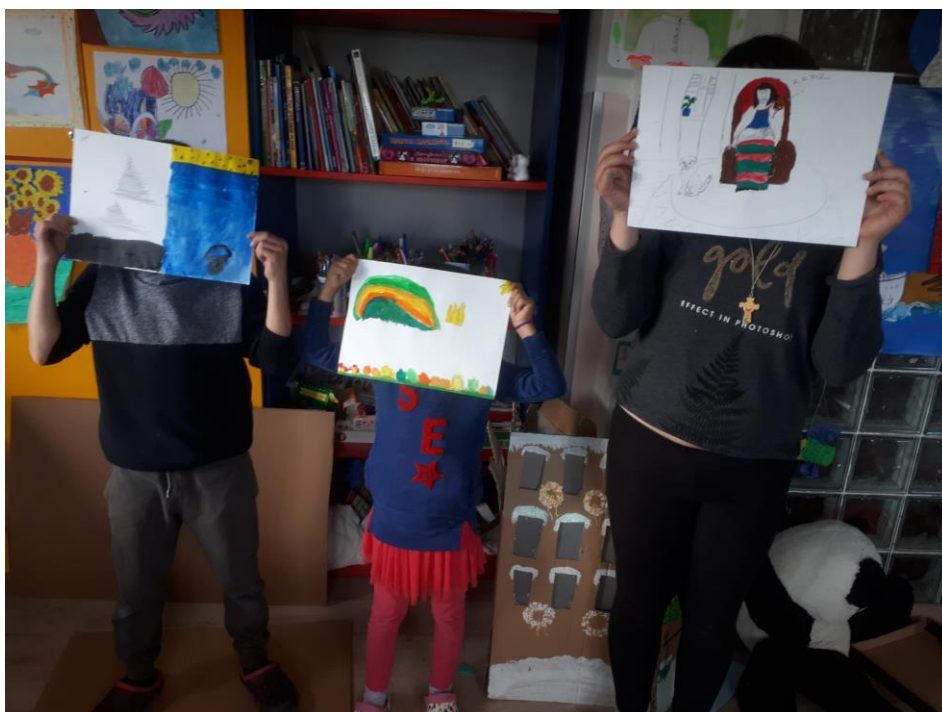
Slika 7. Izrada kreativnih radova - tehnika tempera

Interaktivno čitanje priča s djecom prije počinka provodi se u Dječjem domu Nazonova. Studenti članovi Društva studenata socijalnog rada odlaze dva puta tjedno u večernjim satima djeci čitati priče te razgovarati o njima. Prije odlaska u Dom u Nazonovoj studenti koji su se prijavili za aktivnost teta pričalica prošli su edukaciju u Udruzi Heureka gdje su ih podučili o tehnikama čitanja, pravilnom izgovoru i ponašanju tijekom čitanja te primjerenim gestikulacijama. Na svaki susret čitanja odlazi četiri studenata članova Društva studenata socijalnog rada i volontera sa Studijskog centra socijalnog rada. Materijali potrebni za provedbu interaktivnog čitanja su dječje knjige i slikovnice primjerenog sadržaja kronološkoj dobi djece koje studenti uzimaju prije svakog susreta, a navedeni su financirani od strane Pravnog fakulteta te donacijama izdavačkih kuća Hoću knjigu i privatnim donacijama građana i studenata.