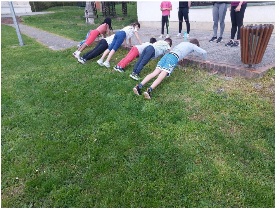
Slika 1. Izvođenje sklekova

naglaskom dijelova tijela koji će se najviše aktivirati tijekom određene radionice. Nadalje slijede fizičke aktivnosti zabavnog sadržaja primjerene kronološkoj dobi djece, a nakon toga uče se osnovne tehnike odabranih sportova, potom se naučene prakticiraju u završnoj aktivnosti odabranog sporta. Za kraj provodi se učenje pravilnog izvođenja istezanja nakon fizičke aktivnosti. Tijekom provođenja radionica, prakticiraju se vježbe kojima se unapređuju motoričke sposobnosti djece, provjerava se i vježba koordinacija i ravnoteža te se kontinuirano radi na disciplini i pozitivnom sportskom ponašanju. Svaki susret završava usmenom evaluacijom s djecom o radionici, prikupljaju se podaci o tome što im se svidjelo, a što ne treba li se posvetiti pažnja još nečemu. Usmena evaluacija također se provodi s odgojiteljima u Domovima o cjelokupnom susretu, prikupljaju se podaci o prošloj radionici, odnosno dojmovima djece tijekom proteklog tjedna od posljednjeg susreta te se u dogovoru s njima uvode nužne promjene ili pravila u radionicama. Sportsku opremu koja se koristi na radionicama u najvećem opsegu osigurava Kineziološki fakultet iz vlastite imovine te Društvo studenata socijalnog rada od financija dobivenih od strane Pravnog fakulteta.