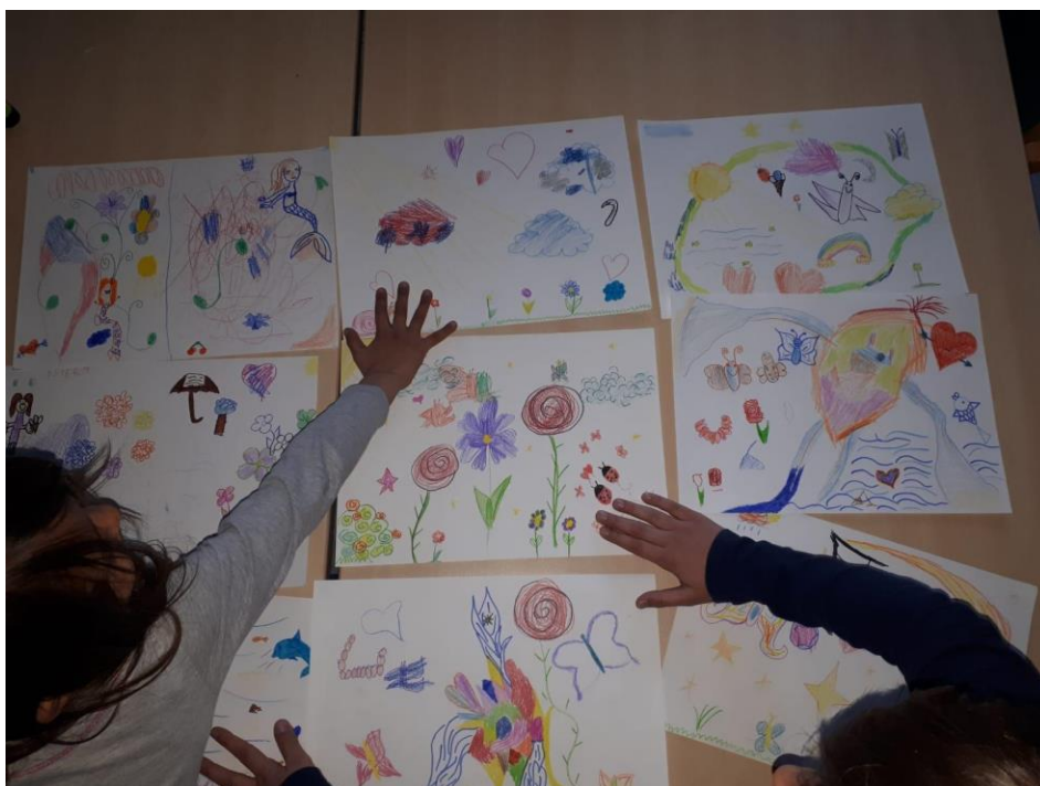
Slika 5. Izrada kreativnih radova - tehnika crtanja