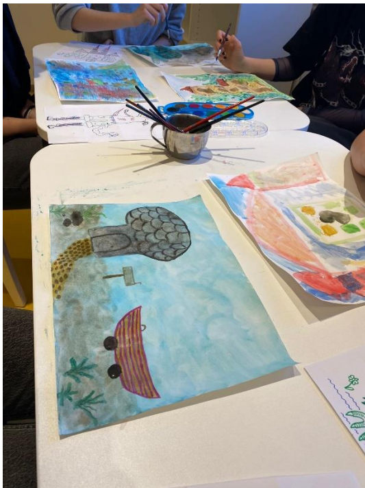
Slika 4. Izrada kreativnih radova - tehnika vodenih boja