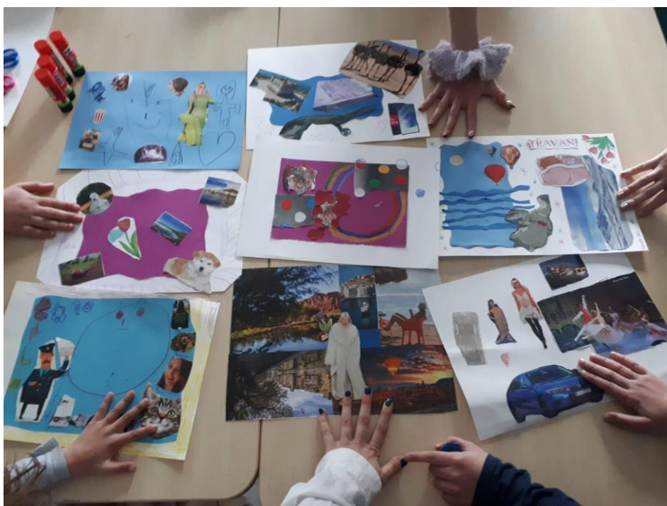
Slika 6. Izrada kreativnih radova - tehnika kolaža