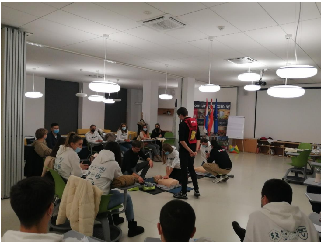
Slika 3. Osnovno održavanje života