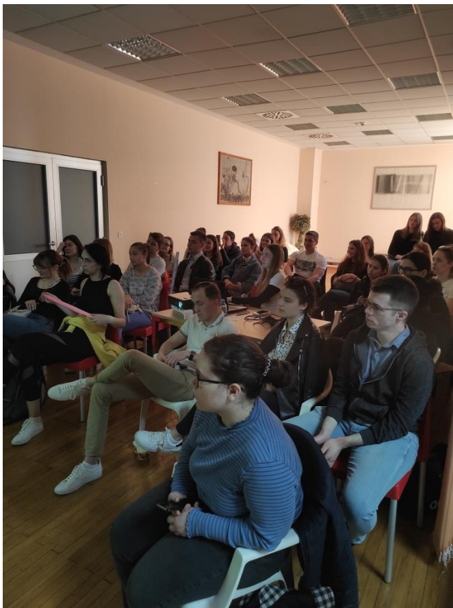
Slika 4. Složi svoj hladnjak