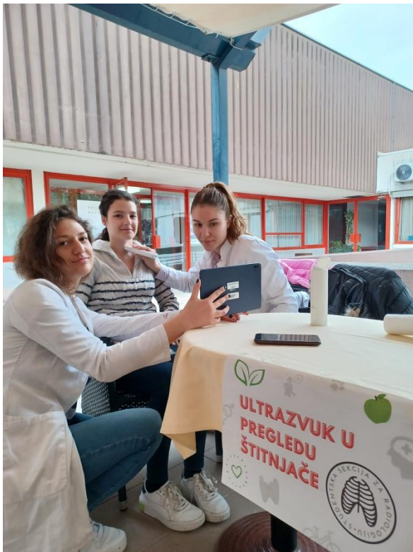
Slika 6. Štand Studentske sekcije za radiologiju

Budući da je bicikl mnogim studentima omiljeno prijevozno sredstvo, no pumpe i sredstva za popravljanje istog nisu im tako lako dostupni, studenti FER-a ponudili su im svoje znanje, materijale i pomoć kako bi pripremili svoje limene ljubimce za novo proljeće.