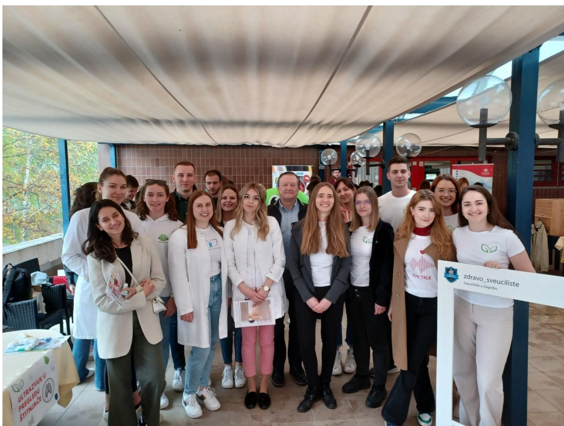
Slika 10. Studenti s rektorom, prof.dr.sc. Damirom Borasom