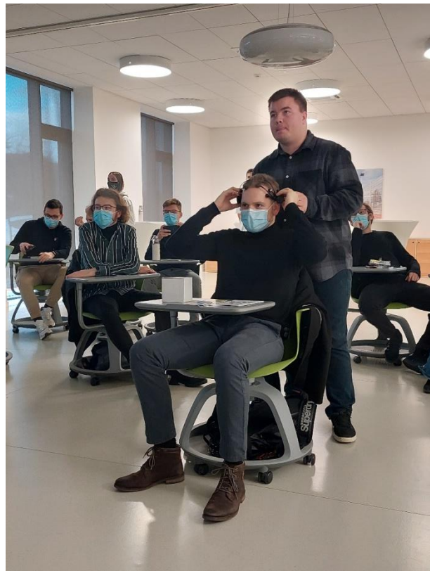
Slika 2. EEG – principi rada i klinička primjena