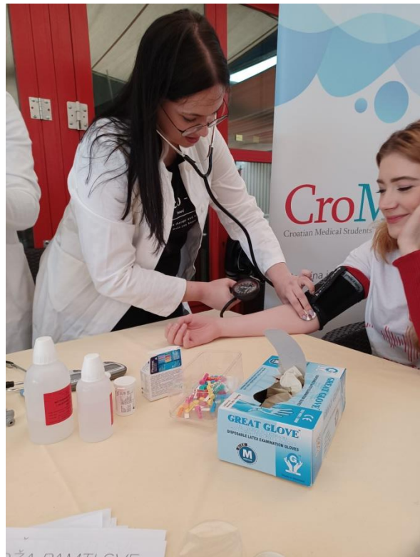
Slika 7. Mjerenje tlaka i šećera