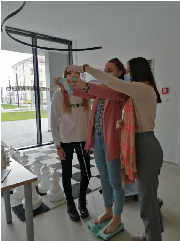
Slika 1. Omron uređaj na štandu PROBION-a