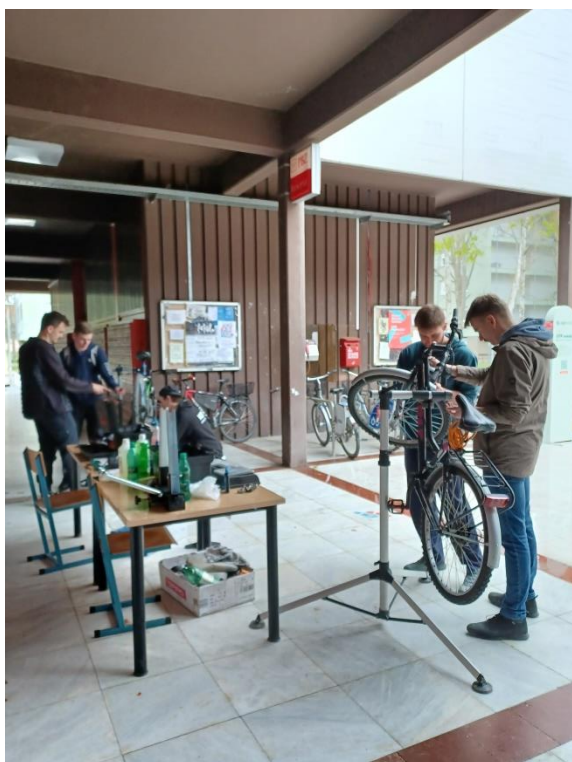
Slika 8. KSET bike