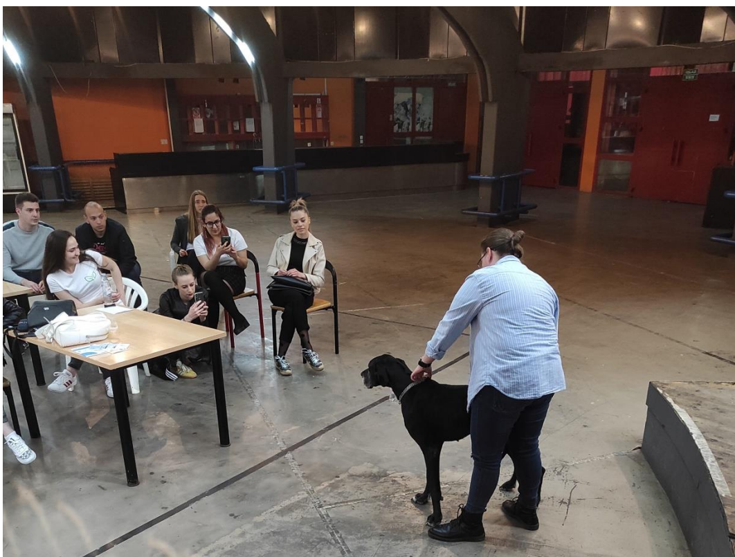
Slika 5. Paraziti u viziti – prikaz predilekcijskih mjesta nametnika