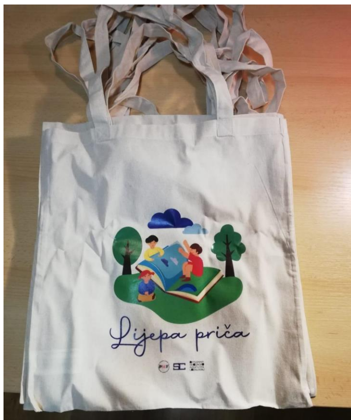
Slika 22. Pamučne vrećice.