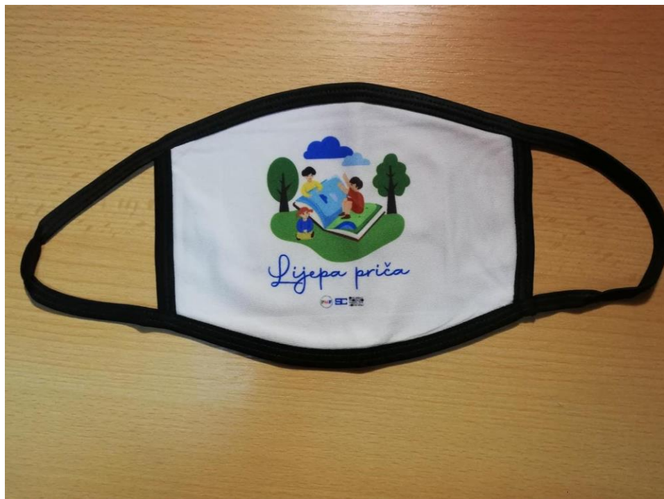
Slika 25. Maskice za lice.