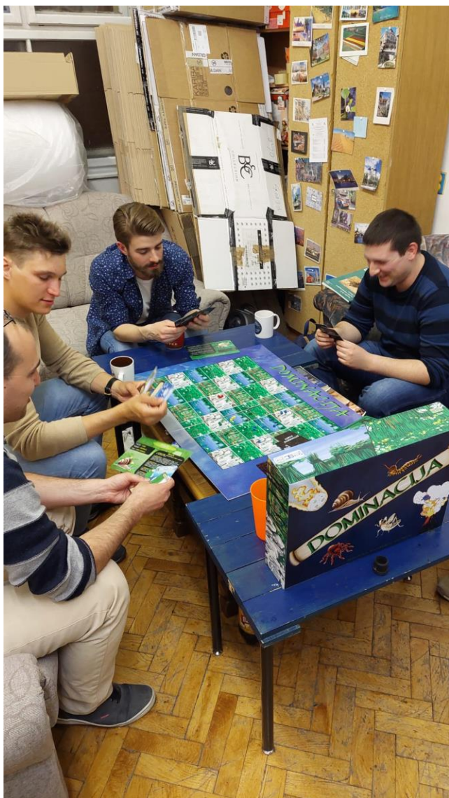
Slika 3. Radionica u prostorijama Udruge studenata biologa (BIUS) u Zagrebu sa studentima Prirodoslovno-matematičkog fakulteta.