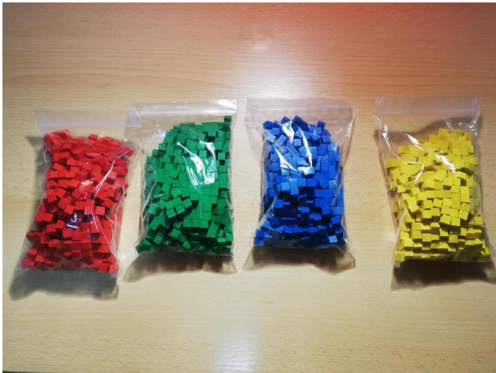
Slika 21. Drvene figurice koje predstavljaju životinje svakog igrača.