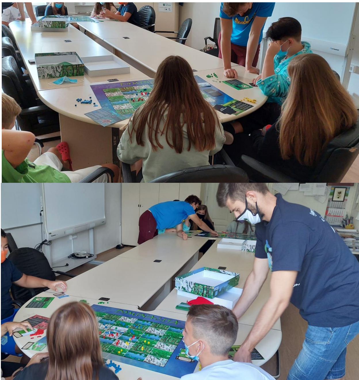
Slika 2. Radionica sa štíćenicima Doma za nezbrinutu djecu „Ivana Brlić-Mažuranić“ u Lovranu.