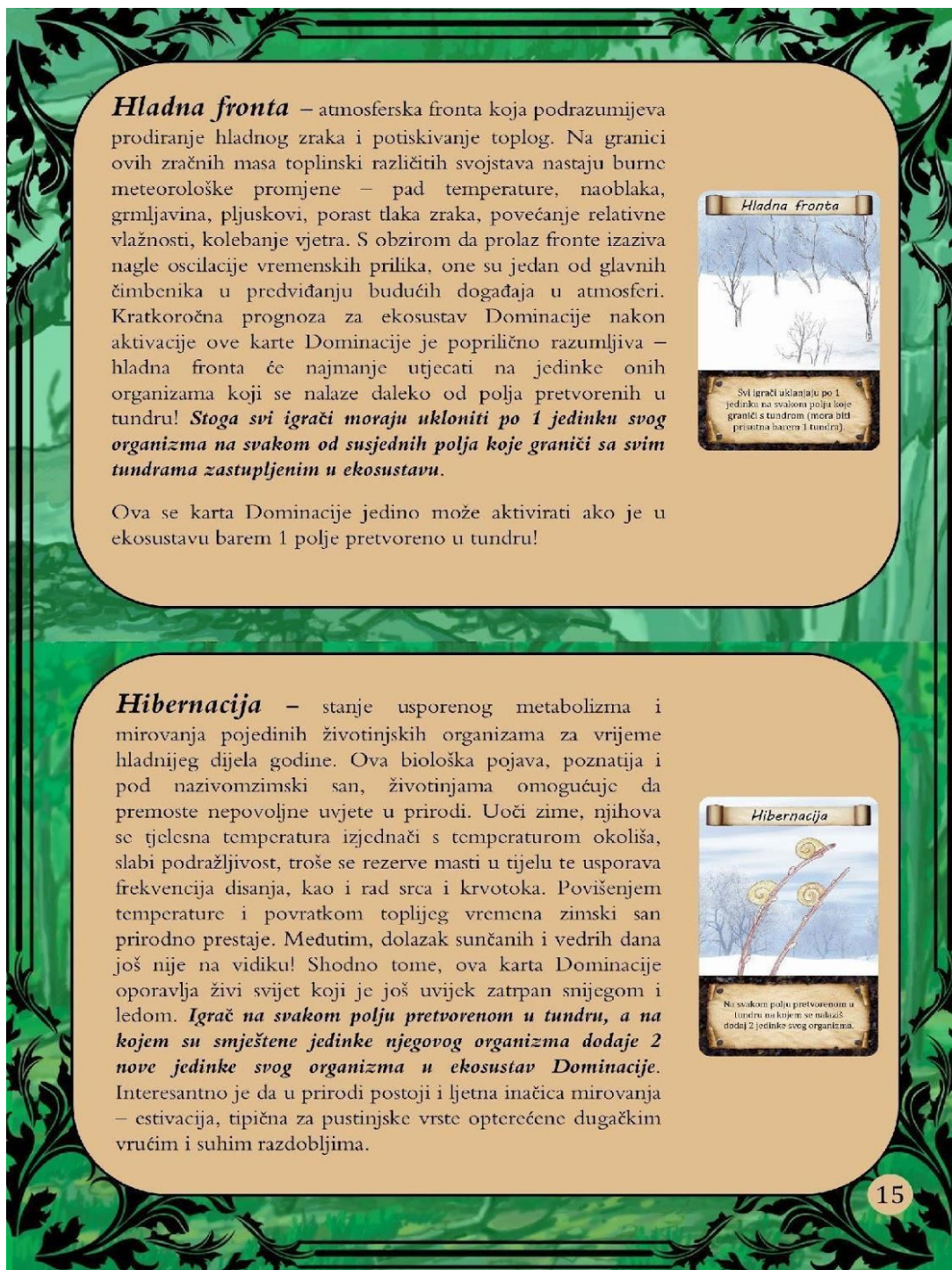
Slika 16. Edukativna pravila.