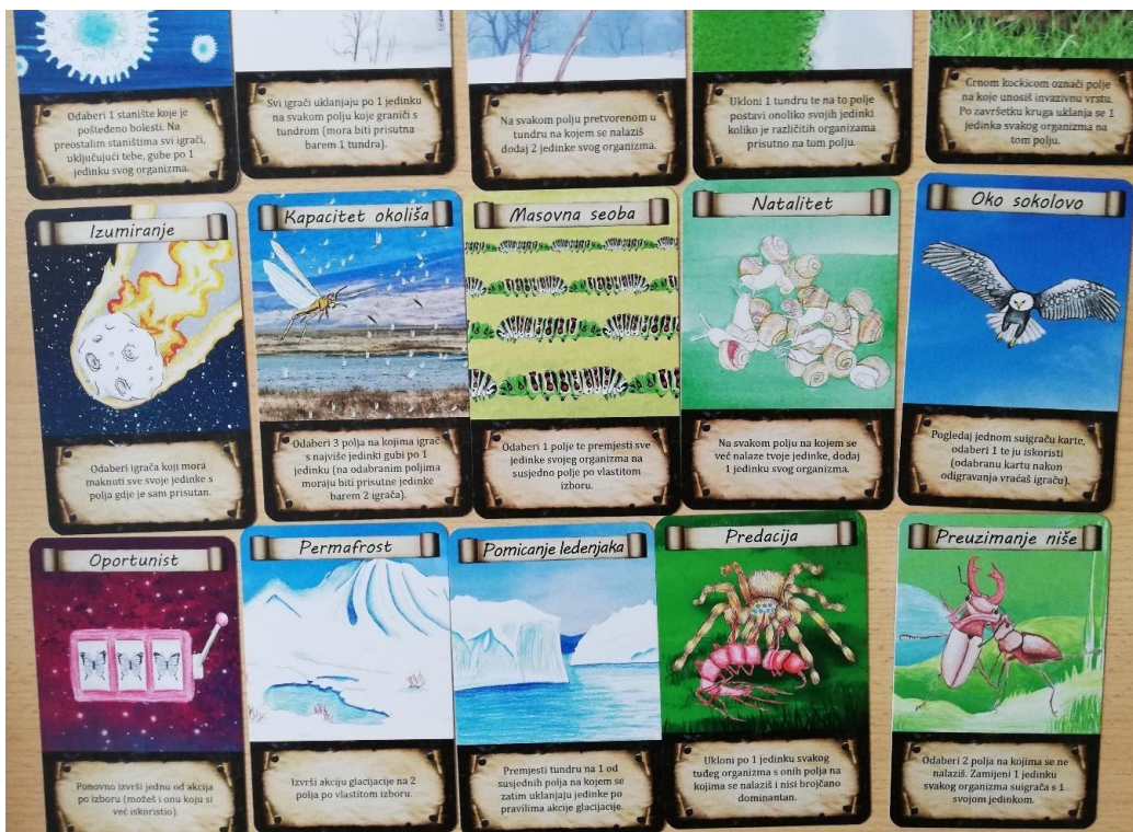
Slika 19. Primjeri akcijskih kartica.