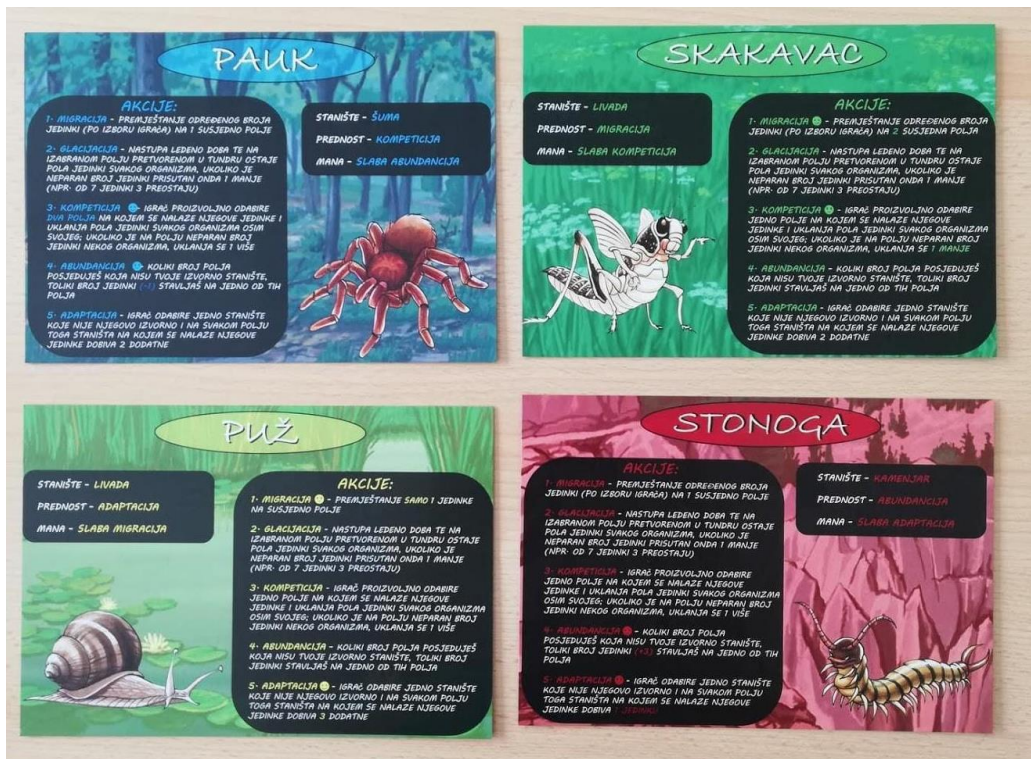
Slika 18. Vodiči za društvenu igru.