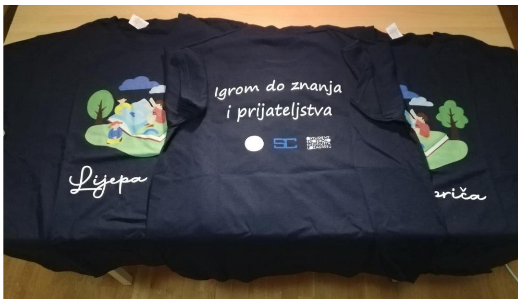
Slika 23. Službene majice.