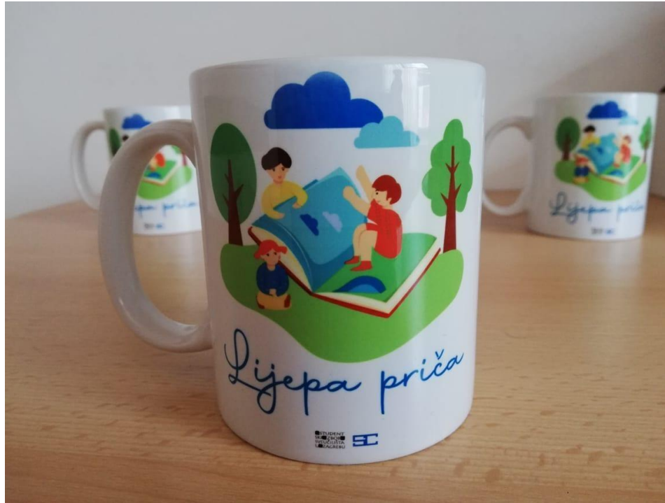
Slika 24. Šalice s tiskom.