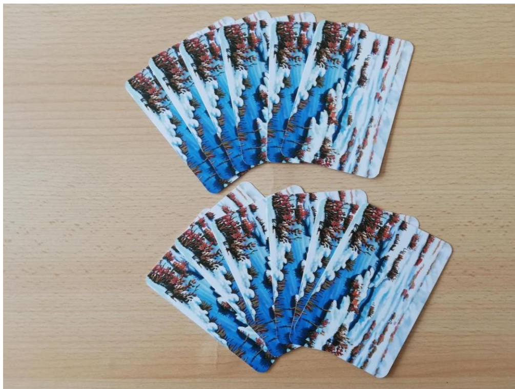
Slika 20. Akcijske kartice staništa tundre.