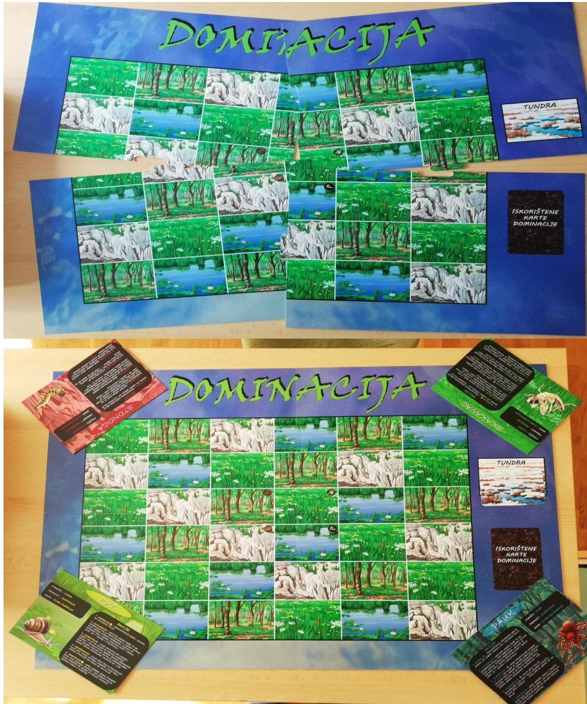
Slika 17. Igraća ploča društvene igre.