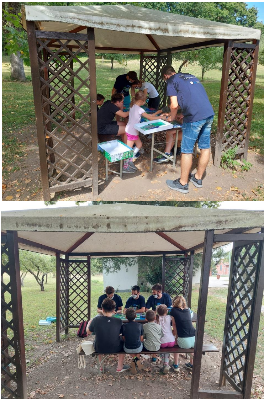
Slika 1. Radionica sa štíćenicima Doma za nezbrinutu djecu „Dječji dom Zagreb“ podružnica „Laduč“.