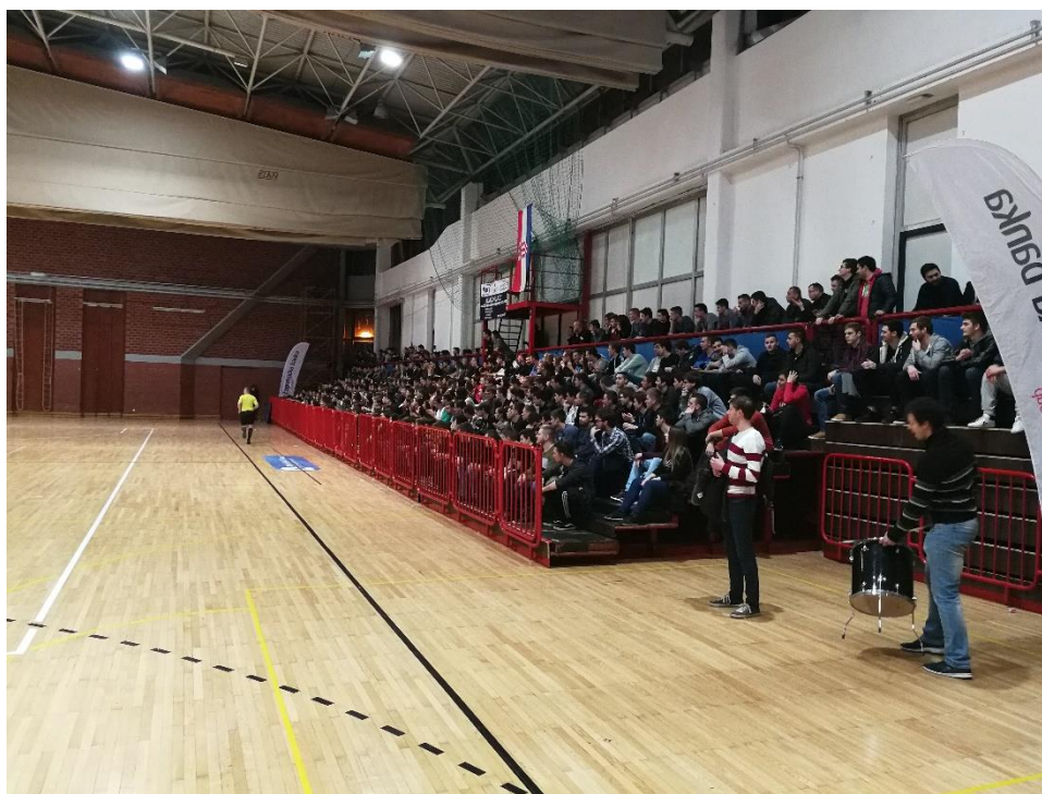
Slika 5. Pune tribine na futsalu Sveučilišta u Zagrebu

Dugoročni ciljevi su brendiranje sveučilišnog sporta i pozicioniranje Sveučilišta u Zagrebu kao nosioca sporta među mladima. Isto se planira pokrenuti kroz razvoj klubova s nazivom Sveučilište u Zagrebu. Navedeni princip se primjenjuje u Sjedinjenim američkim državama, gdje je sveučilišni sport postao nezamjenjiv. Kreirane su ekipe prema sveučilištima, koja ima pripadajuće navijačke skupine i gdje sportsku utakmicu prati preko 1.000 ljudi po utakmici. Ideja je to i put kojim se planira razviti sveučilišni sport u gradu Zagrebu, kako bi se izgradilo zdravo akademsko društvo previjeno zajedništvom i interdisciplinarnom suradnjom, a prema dosadašnjim rezultatima, situacija se odvija u dobrom smjeru.