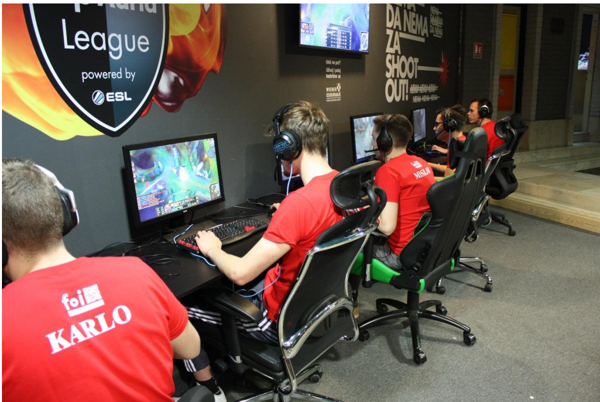
Slika 6. e-Sport na Sveučilištu u Zagrebu

Kako bi uspješno proveli takav model, potrebno je napraviti široku ponudu sportova prema svim korisnicima, a da se sport na Sveučilištu kreće u dobrom smjeru zasigurno pokazuju rezultati uvođenja novih sportova te oživljavanja starih koji se dugi niz godina nisu provodila na Sveučilištu u Zagrebu. Tako je ove akademske godine u planu predviđeno 30 sportova, a zasigurno su najistaknutiji oni poput velikog nogometa, hrvanja, skijanja i e-sporta.