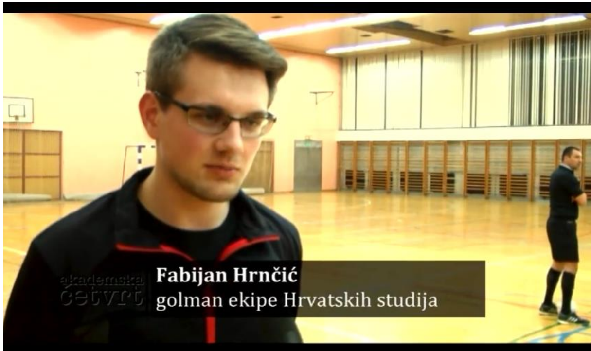
Slika 4. Isječak iz emisije snimanje od TV Student

Najvažniji medijski partner ove godine je TV Student. Televizija Student od samog početka natjecanja svojim kamerama prati ligu čime pruža studentima sportašima video analize svojih utakmica i stvara novu dimenziju sveučilišnog sporta. Osim zagrebačke sveučilišne lige, samo UniSport HR prati futsal ligu kroz youtube kanal. Time je također Sveučilište u Zagrebu ponovno postalo nositelj svih pozitivnih sportskih promjena.