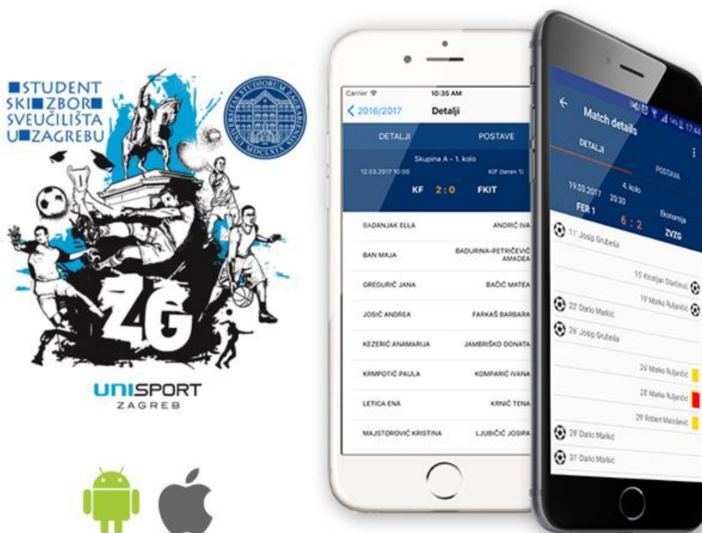
Slika 1. Mobilna aplikacija SZZG SPORT

Po prvi puta na Sveučilištu u Zagrebu te bilo kojem visokom učilištu u Republici Hrvatskoj, dizajnirana je jedinstvena aplikacija unutar koje se nalaze svi ekipni sportovi koji se provode na sveučilišnoj ligi. Tako se u prvoj verziji nalaze futsal, košarka, odbojka, rukomet i vaterpolo posebno u muškoj i ženskoj kategoriji. Time se stvara aktualni prikaz svih aktivnih studenata sportaša na Sveučilištu u Zagrebu i pruža mogućnost praćenja svih rezultata uživo. Ovim potezom Sveučilište u Zagrebu prednjači u tehničkim inovacijama u Republici Hrvatskoj.