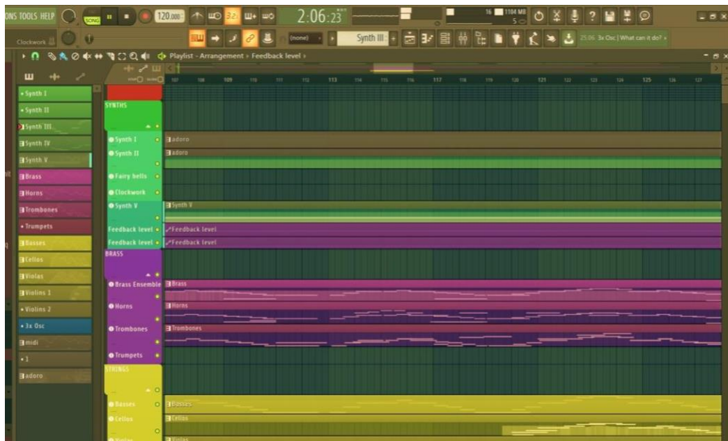
Slika 2 Primjer workflowa za jedan koral u Fl-u