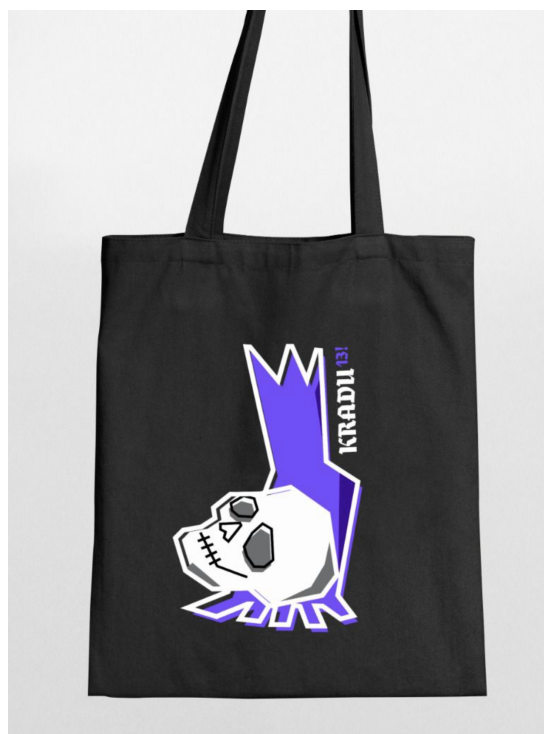
Slika 3, Merchandise - platnena torba