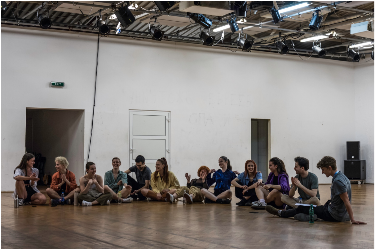
Slika 13, Izvođači Nestani ovdje