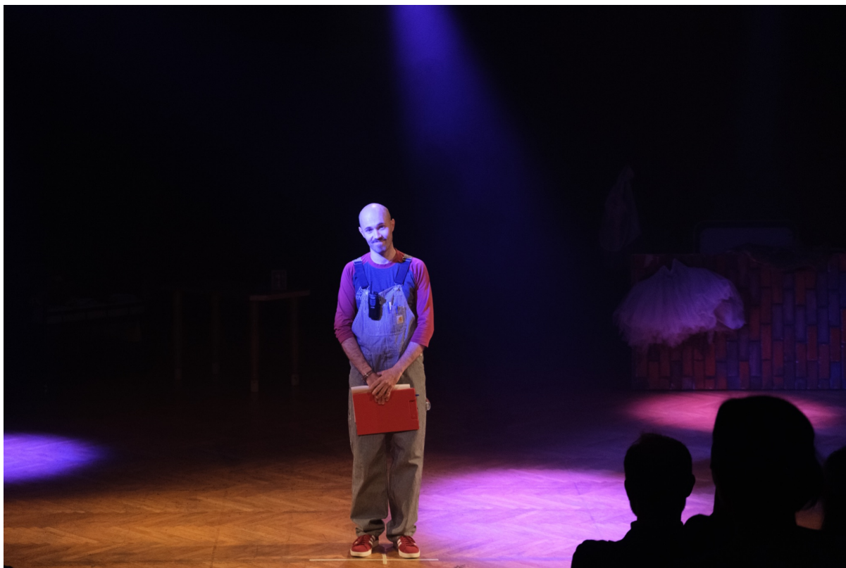
Slika 5, Otvorenje revije