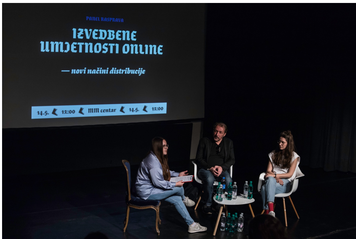
Slika 15, Panel rasprava - Izvedbene umjetnosti online