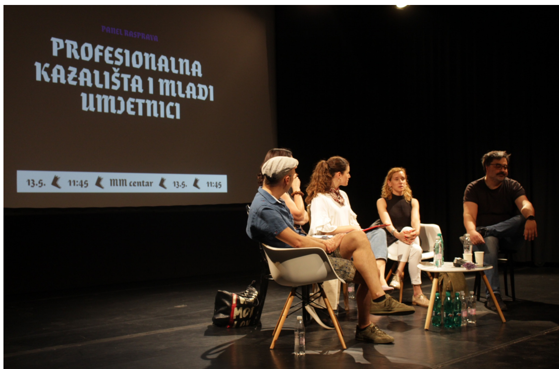
Slika 11, Panel rasprava - Profesionalna kazališta i mladi umjetnici