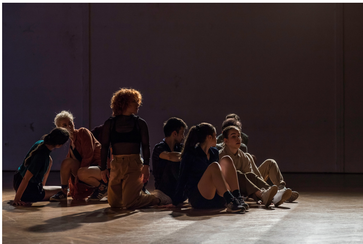
Slika 12, Izvedba - Nestani ovdje