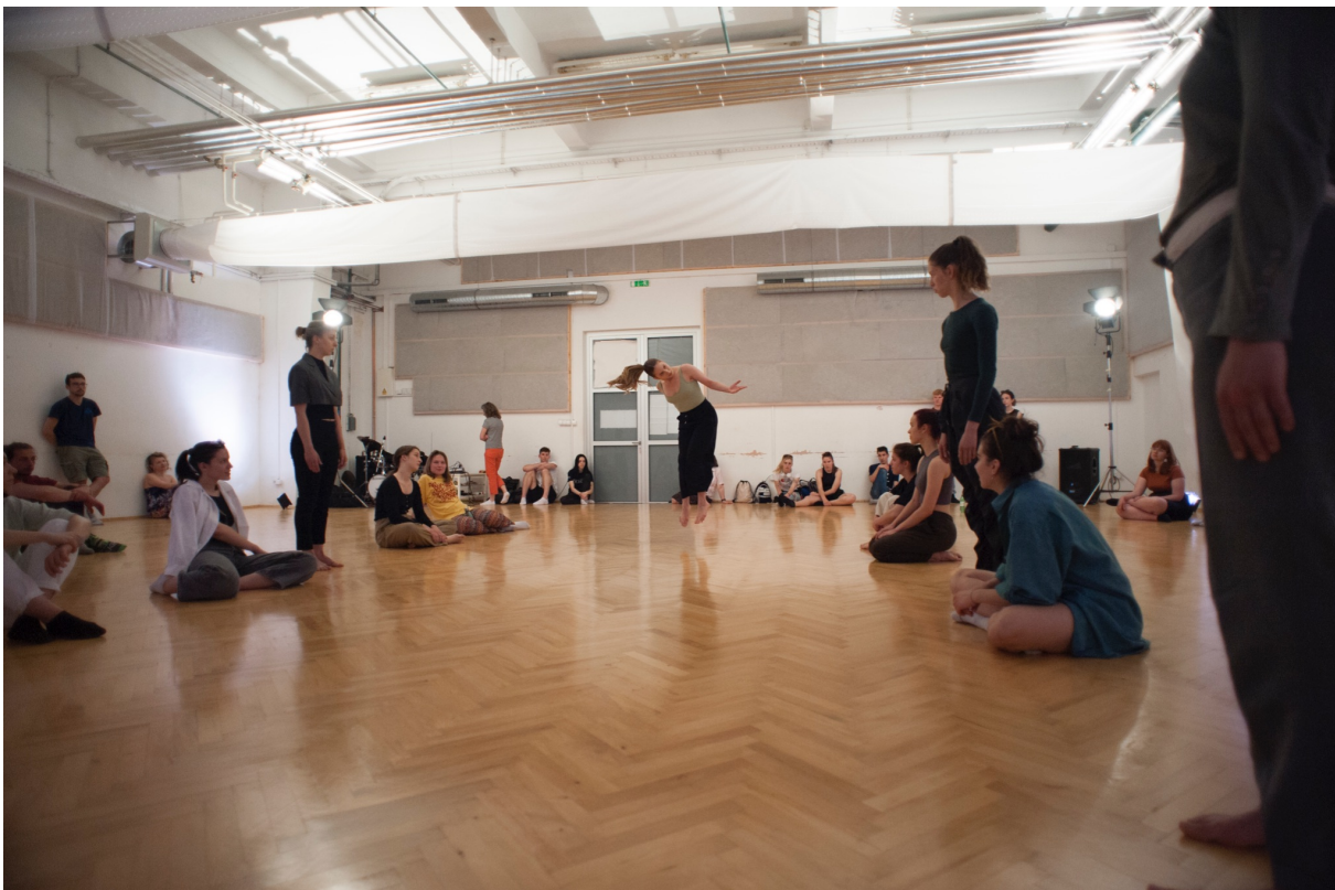
Slika 8, Izvedba - Fuzija