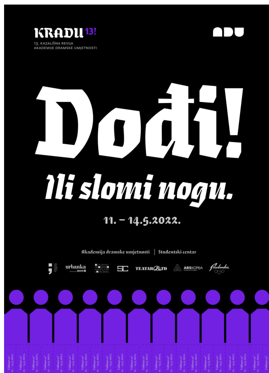
Slika 2, Plakat