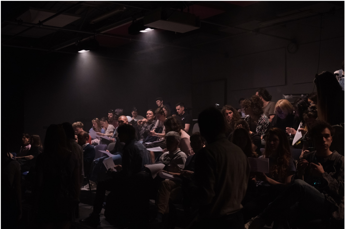
Slika 7, Otvorenje revije - publika