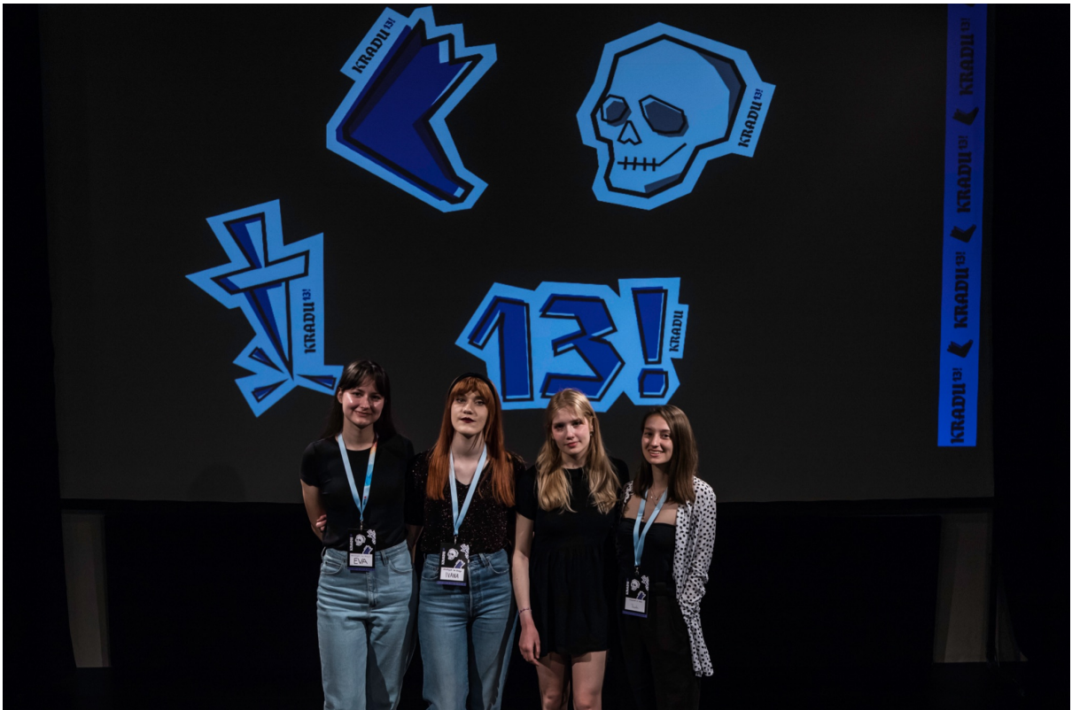
Slika 14, Dizajnerski tim 13. KRADU-a