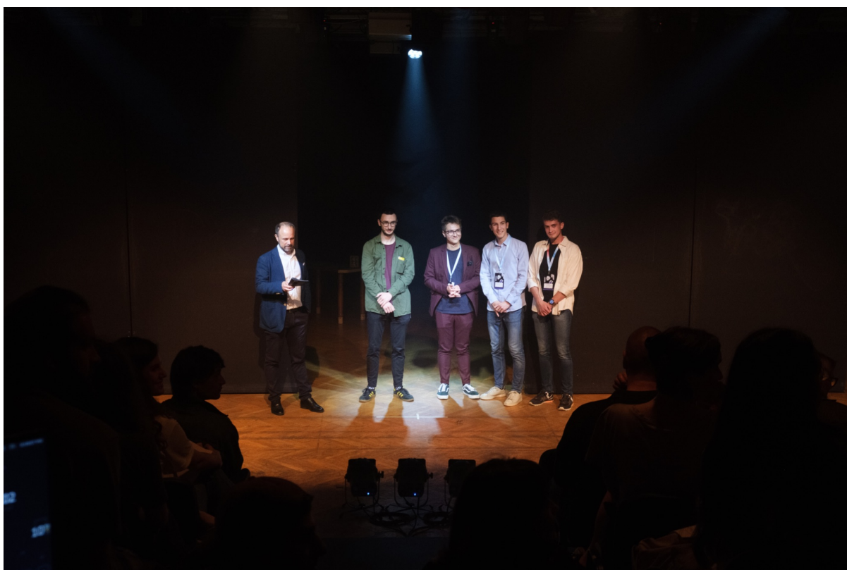
Slika 6, Otvorenje revije - dekan i produkcijski tim