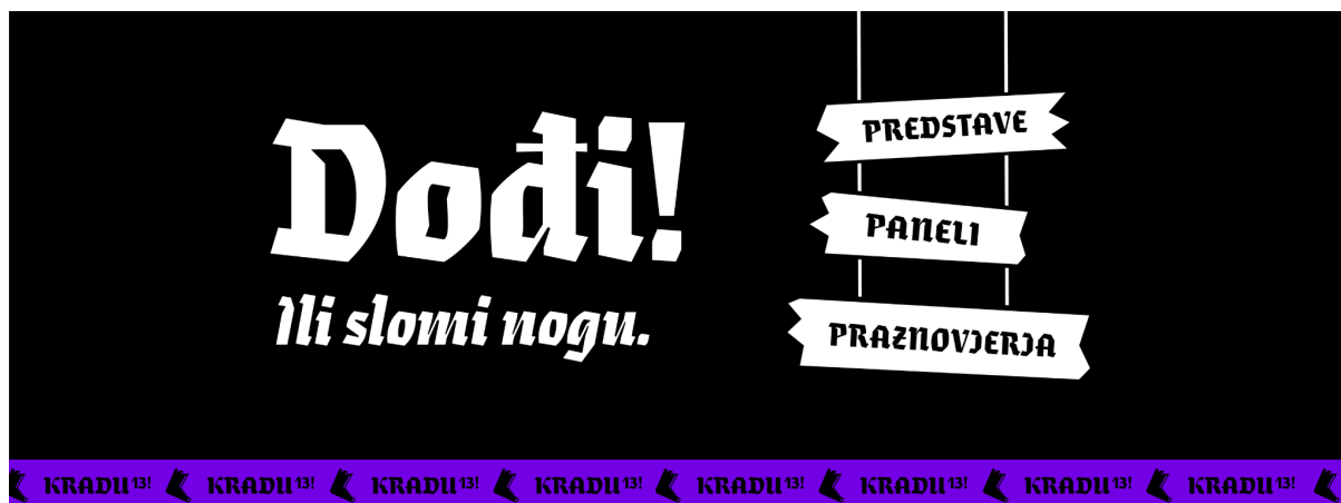
Slika 1, Temeljni vizual na društvenim mrežama