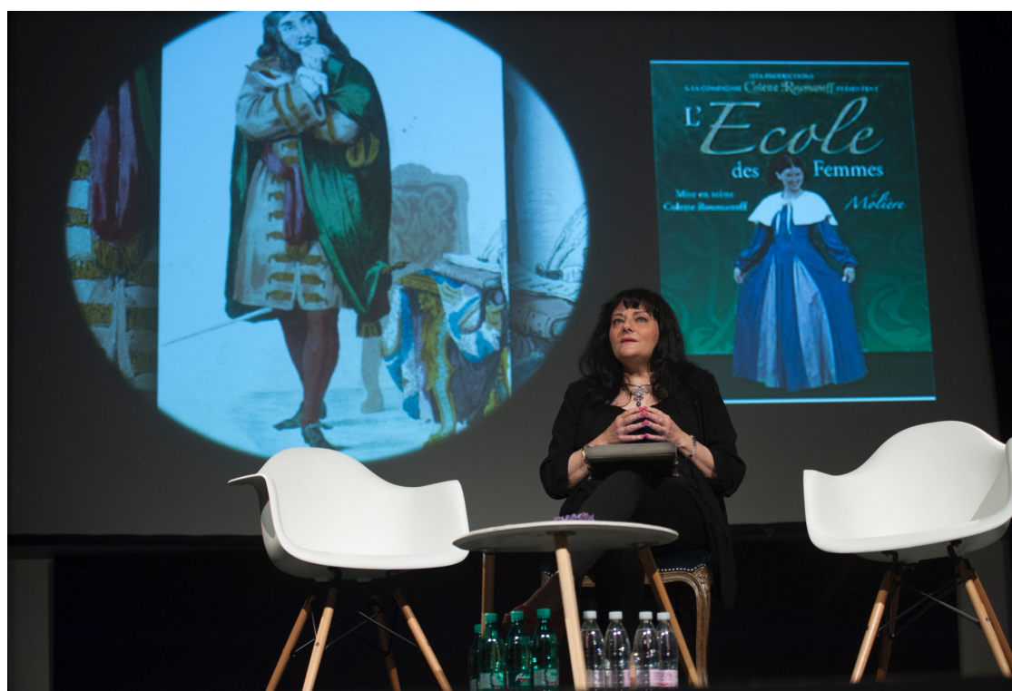
Slika 10, Predavanje - Kazališna praznovjerja