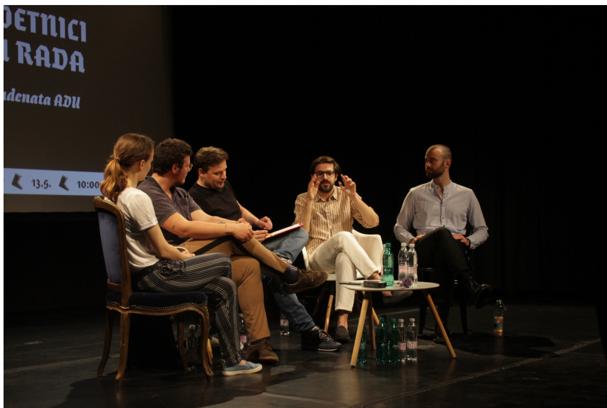
Slika 9, Panel rasprava - Mladi umjetnici na tržištu rada