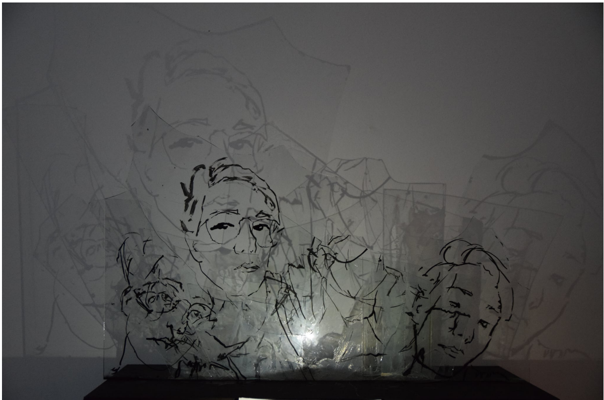
1. Autoportreti na staklu koje je razlomljeno tijekom dva potresa aranžirano kako bi posjetitelji koristeći se svjetlom vidjeli širu sliku. Autorica Tea Švarić

Kroz ovu studentsku organizaciju, mladi kolege htjeli su prikazati kako se i u vremenima kada se čini da 'ne može gore', i dalje može misliti pozitivno, te na jedan kreativan način utjecati na psihološko, ali i na fizičko zdravlje. U trenucima pandemije i lockdowna, oni su to na novi i inovativan način izložili, te predstavili široj publici kroz panel raspravu i primjere profesionalaca poput psihologa, socijalnih radnika i umjetnika, ali i kroz pogled mladih studenata iz istih struka.