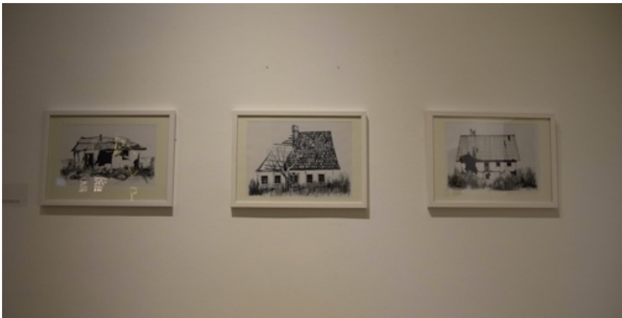
5. Detalj serije kuća uništenih u potresima autorice Anamarije Kvas

Čitav događaj rezultirao je boljim povezivanjem studenata s mnogih sastavnica Sveučilišta u Zagrebu, te kroz jednu prekrasnu suradnju gdje su studenti iz različitih područja mogli dati jasniji pregled situacije u kojom se nalaze, ne zaobilazeći vlastite struke, te međusobnom komunikacijom tražili bitne dodirne točke između njih.