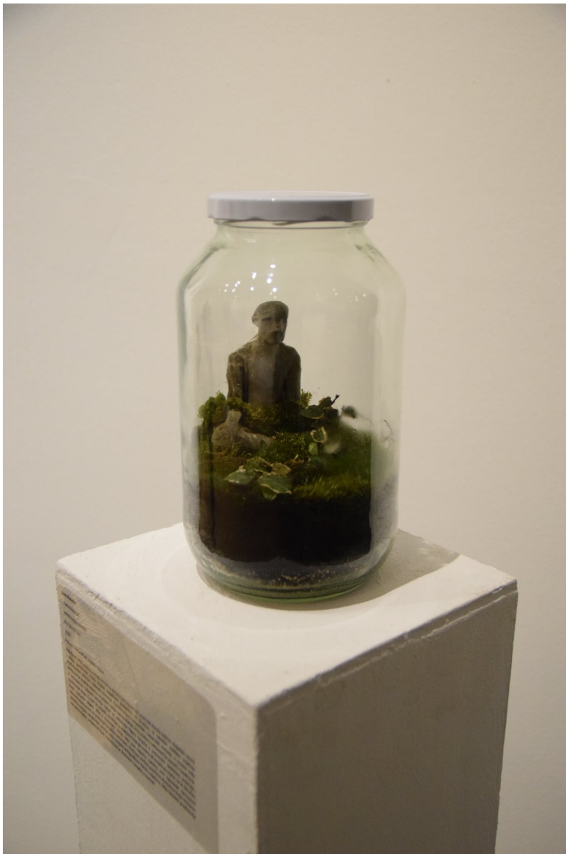
3. Samoizolacija, skulptura autorice Luke Đurašin koja govori o osjećaju zatvorenosti i izolaciji tijekom socijalnih distanci.

Kao jedan od možda najbitnijih rezultata bio nam je povezivanje studenata naizgled nepovezanih studija i predmeta, gdje su se kroz rasprave i promišljanja kao jedan od bitnih dijelova izložbe uključili i studenti Medicinskog fakulteta, Tekstilno tehnološkog, Pravnog fakulteta – centar za socijalni rad te na taj način postigli jedan način međufakultetskog povezivanja. Utjecaj tog rada mogao se vidjeti po odličnoj gledanosti na društvenim mrežama za nešto što se odvija tek prvi put, dok je visoka bila i fizička posjećenost same izložbe te je na kraju, zbog velikog interesa izložba produljena. Autori s likovne akademije su kroz jednu interdisciplinarnu izložbu prikazali ono što ih muči povezano s onime što ne mogu kontrolirati, ili pak ono što ih motivira da odlučno stupaju naprijed te nastave stvarati.