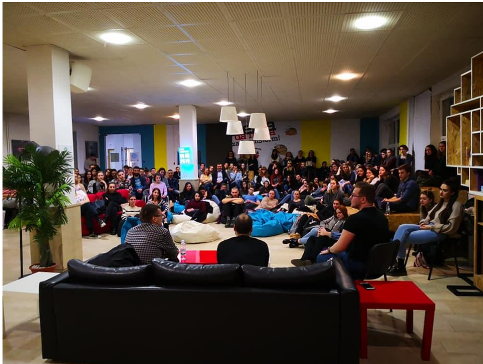
Slika 2. Predavanje o umjetnoj inteligenciji