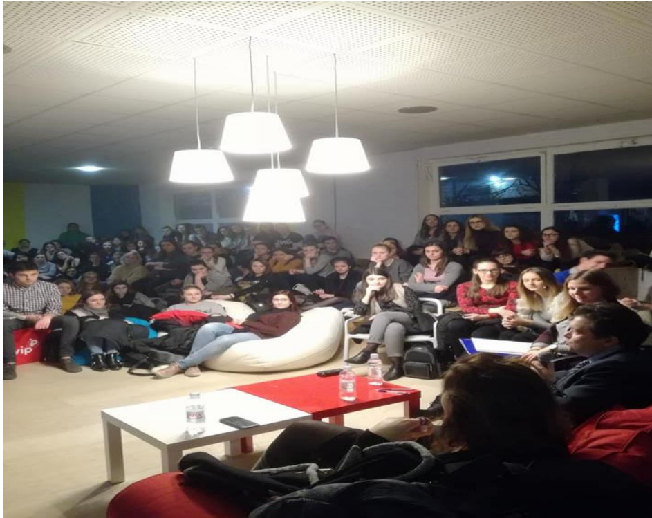
Slika 1. Predavanje o zločinačkim umovima