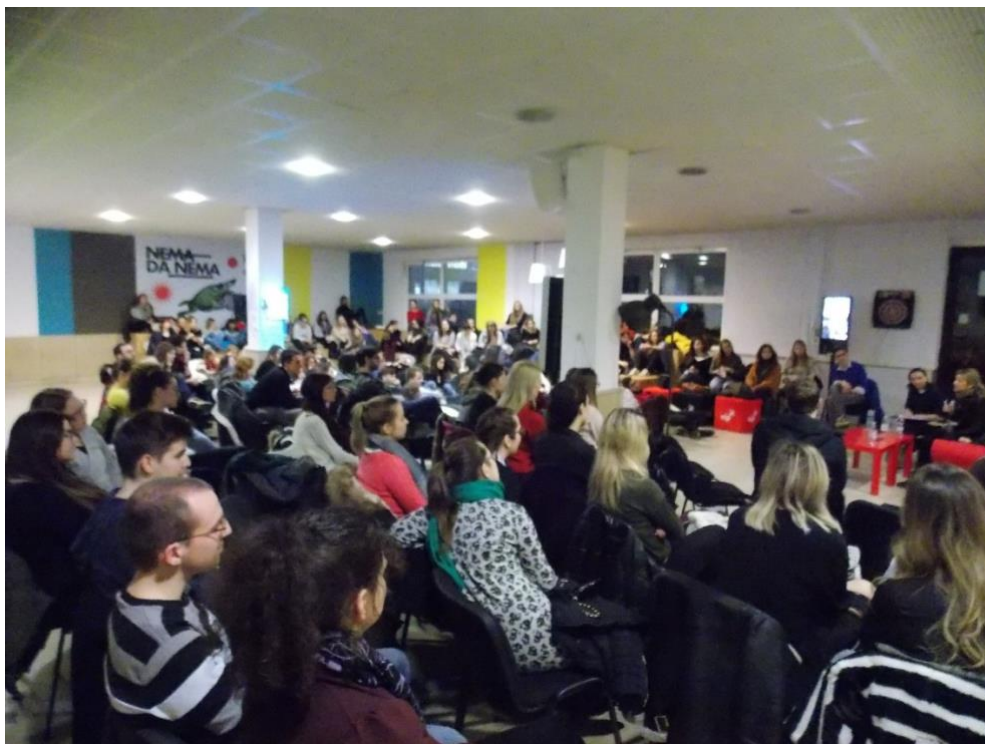
Slika 3. Predavanje o reality televiziji

Nastavak aktivnosti i rada Psiho-logo-pop sekcije u 2020. godini, zbog pandemije koronavirusa i epidemiološki nepovoljne situacije, cjelokupnog prestanka svakodnevnih aktivnosti na način na koji ih poznajemo, bio je pauziran. Klub se okrenuo aktivnostima promicanja mentalnog zdravlja i različitim drugim aktivnostima koje su na ovaj način podržavale studente. No, u akademskoj godini 2020./2021. projekt počinje s aktivnošću, ovaj put u ponešto izmijenjenom izdanju. Kako je pandemija svojim tijekom uskratila određene aktivnosti, poput okupljanja ili predavanja uživo, Klub se okrenuo modernim platformama i osuvremenio i ovaj projekt. Psiho-logo-pop sada se održava putem online platforme Zoom , na daljinu, pružajući tako mnoge prednosti. Ovakvim pristupom na predavanju mogu prisustvovati studenti i šira javnost koja nije iz Zagreba, budući da je to bilo prvotno mjesto održavanja predavanja. Ovdje posebno ističemo kolege iz Sarajeva, Novog Sada, Beograda, Osijeka, Zadra i Rijeke koji redovito prisustvuju na online izdanjima Psiho-logo-pop-a . Virtualni oblik održavanja predavanja nije idealna postavka stanja stvari, posebice uzme li se u obzir važnost i naglasak na interaktivnosti, sudjelovanju sudionika i općenito opuštena atmosfera između predavača i publike, ali jest optimalna alternativa u trenutnoj stvarnosti u kojoj se nalazimo.