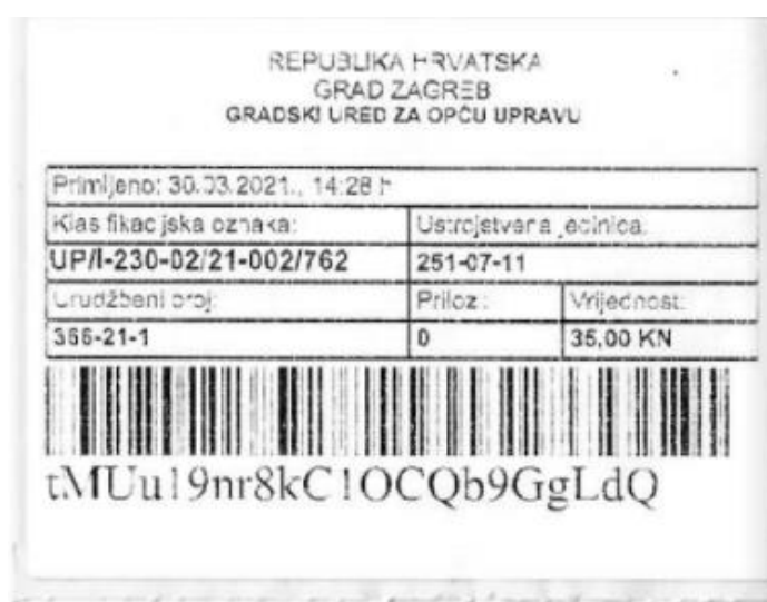
Slika 32. Potvrda o zaprimljenoj dokumentaciji za registraciju udruge pri Registru udruga