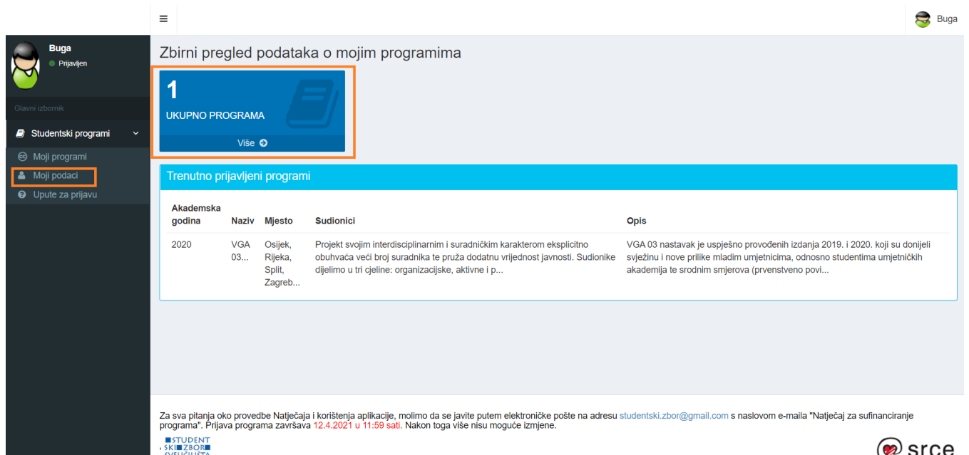
Slika 22. Prikaz korisničkog sučelja za prijavu