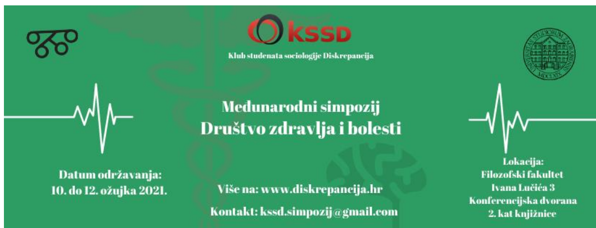
Slika 13. Primjerak vizuala za Facebook event izrađen pomoću stranice Canva

Facebook event ključni je alat kojim promovirate simpozij. Osim prethodno spomenutog plaćanja promocije, nekoliko koraka poželjno je napraviti kako bi biste iskoristili njegov puni potencijal. Prvo, poželjno je da svi u organizaciji podijele event na svojim privatnim profilima. Drugi korak je izrada privlačnog dizajna za naslovnicu događaja. Sugeriramo vam da na naslovnicu ide dizajn koji ćete kasnije staviti na plakat. Bitno je da dizajn bude vizualno privlačan, zanimljiv te da sadrži osnovne informacije o simpoziju. Treće, možda najvažnije, postaviti plaćenu promociju eventa te pravilno odabrati poželjnu populaciju. U slučaju studentskih simpozija, to su uglavnom mladi, studenti, volonteri koji žive unutar vašeg ciljanog dometa.