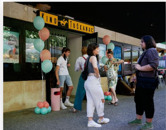
Ljetna pozornica Tuškanac