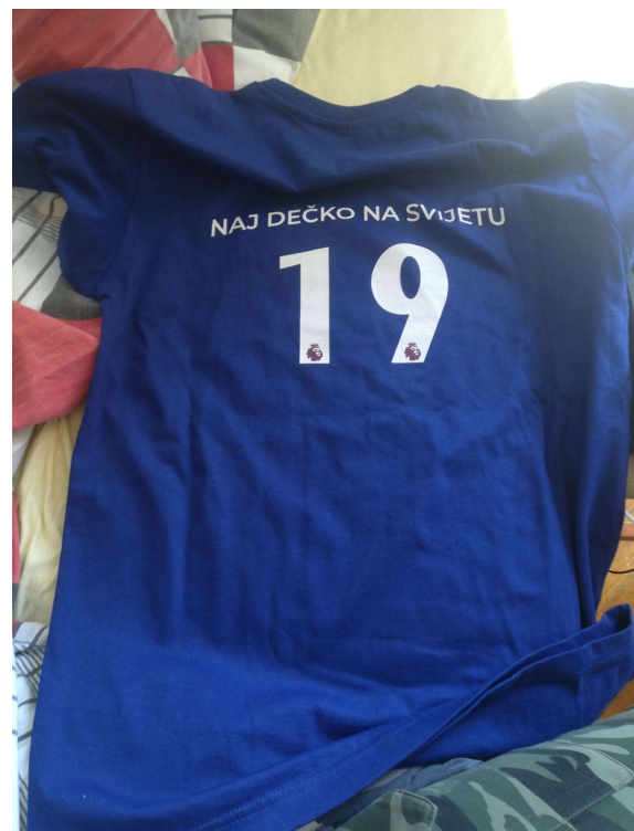
Slika 89 - dječji dom - outfit no.4 - poslije