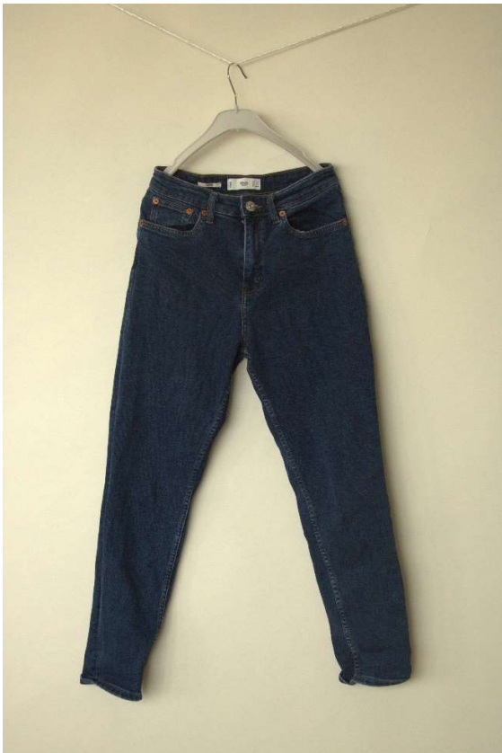
Slika 87 - dječji dom - outfit no.3 - prije

Cura je priložila vlastiti uobičajeni par traper hlača, te je postignut dogovor oko redizajniranja hlača u pogledu pravljenja izrezaka i poderotina na traper hlačama prema poslanoj nam inspiracijskoj slici. Studentice studija modnog dizajna iz tima potom su pripremile šablone za izradu zamišljenih poderotina na hlačama od strane naručitelja, te smo poderotine postigli ručno krojačkim škarama. Hlače su također bile skraćene u duljinu te ponovno porubljene nakon skraćivanja kako bi naručitelju bolje pristajale.