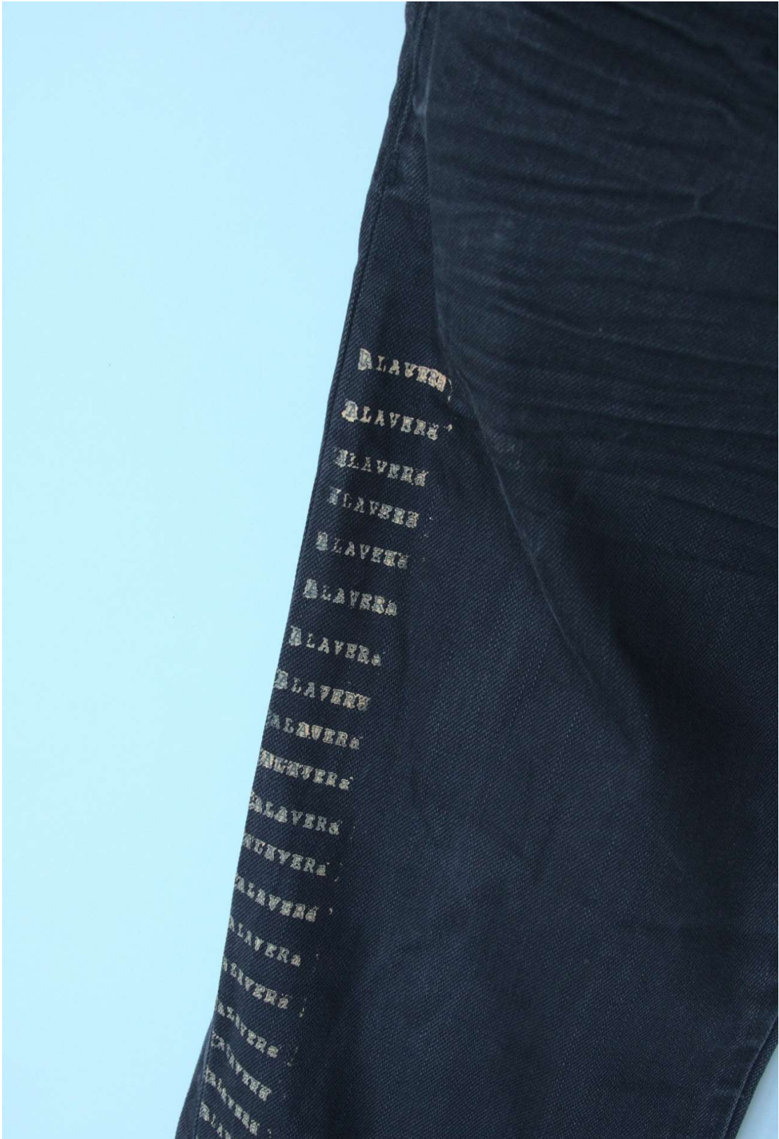
Slika 11 – outfit no.3, detalj donjeg dijela