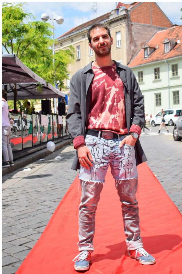
Slika 31 – outfit no.8

Hlače nastaju spajanjem dvoje muških modela hlača. Muške hlače svijetlog trapera s kopčanjem patentnim zatvaračem i gumbom odrezane su od struka na niže. S prednje strane oslikane su crnom bojom za tekstil motivom zdjelice kostura. Boja je nanescena kistom na površinu trapera, zatim se suši na zraku, a potom se fiksira boja termo prešom. Druge hlače od sivog su izbjeljelog trapera, a rez je napravljen od bedra na niže. Nakon obrade dvoje različitih hlača, njihovim spajanjem šivaćom mašinom nastaje krajnji proizvod. Rub gdje se spajaju hlače na bedrima nije