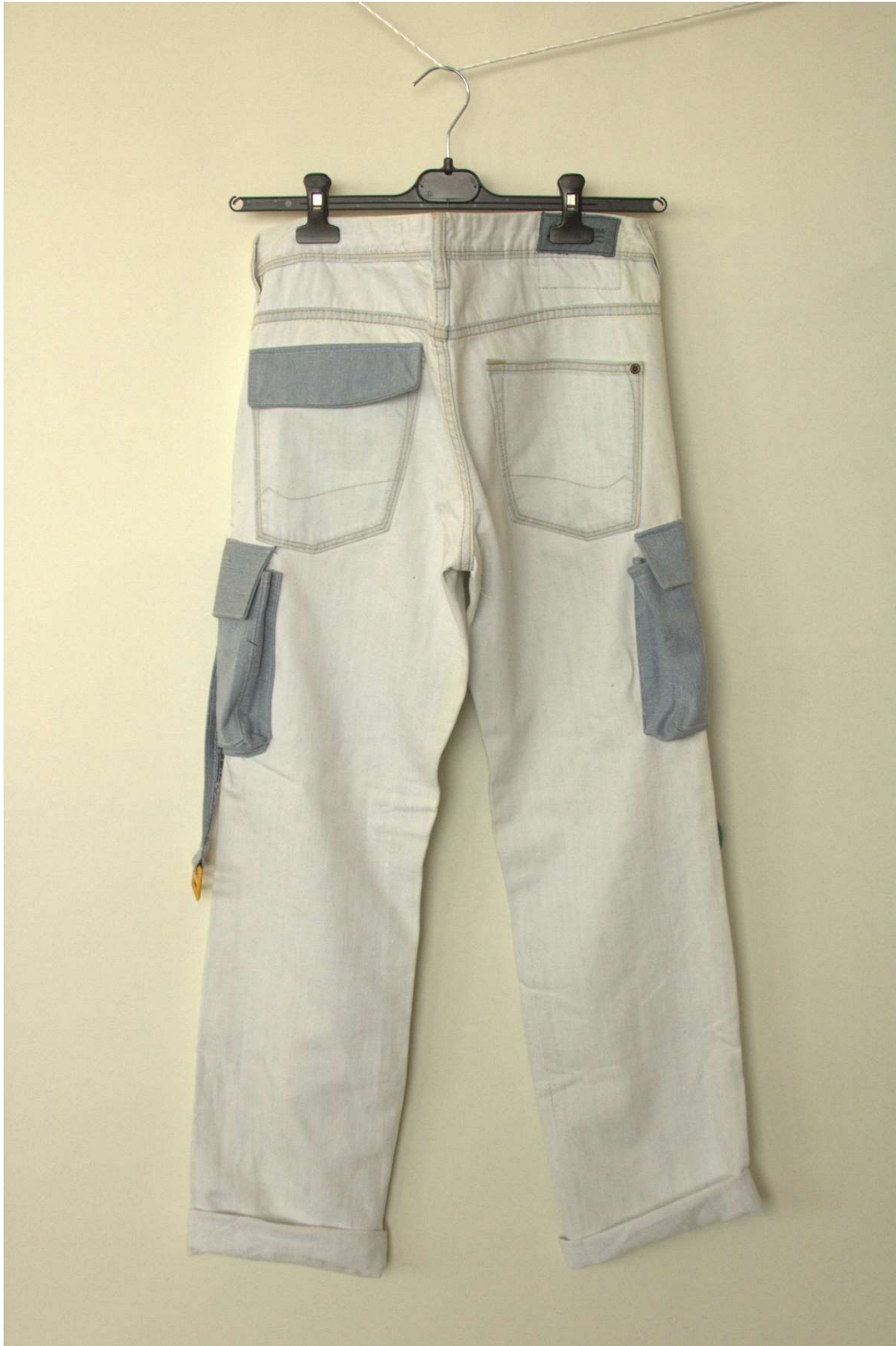
Slika 24 – outfit no.6, donji dio straga