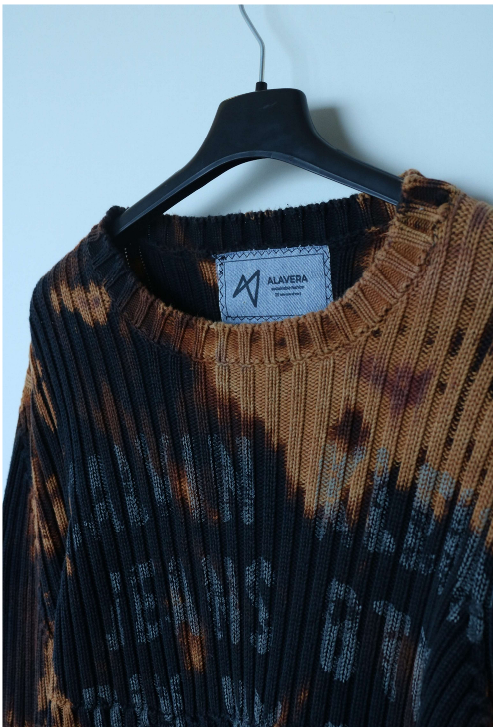
Slika 27 – outfit no.7, gornji dio detalj