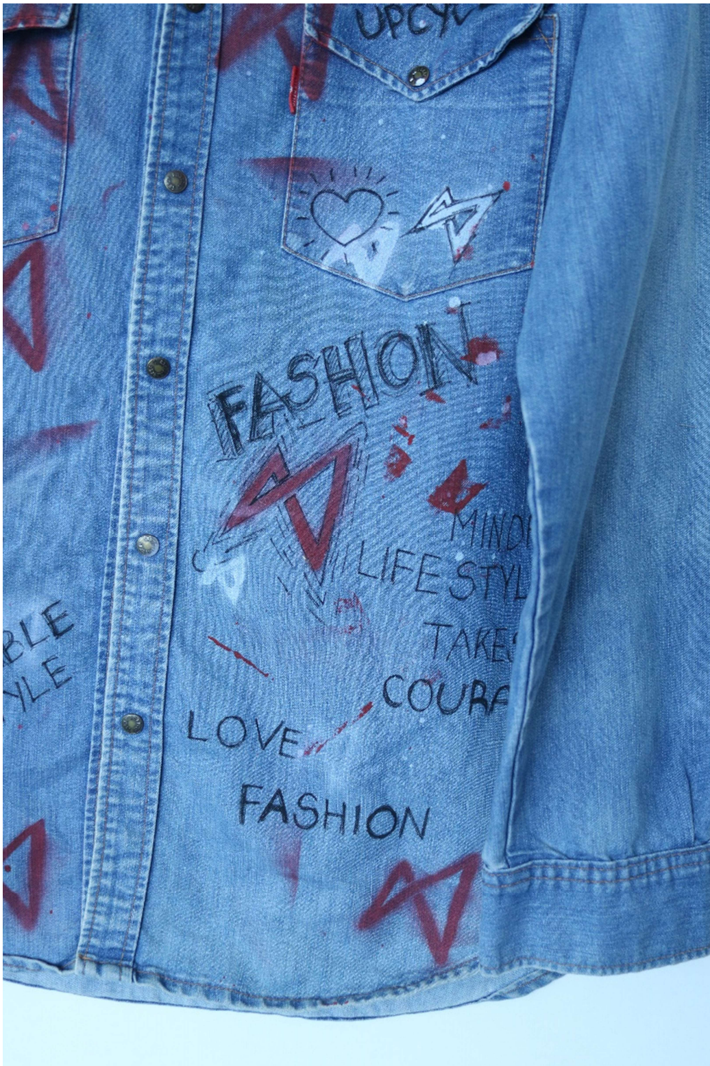
Slika 40 – outfit no.9, gornji dio detalj