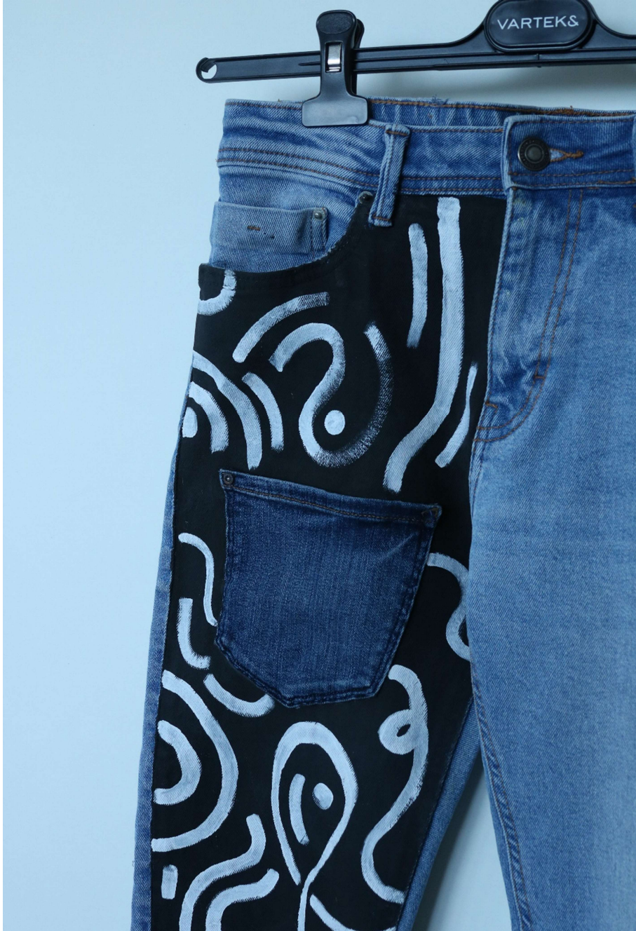
Slika 17 -outfit no.5, detalj donjeg dijela