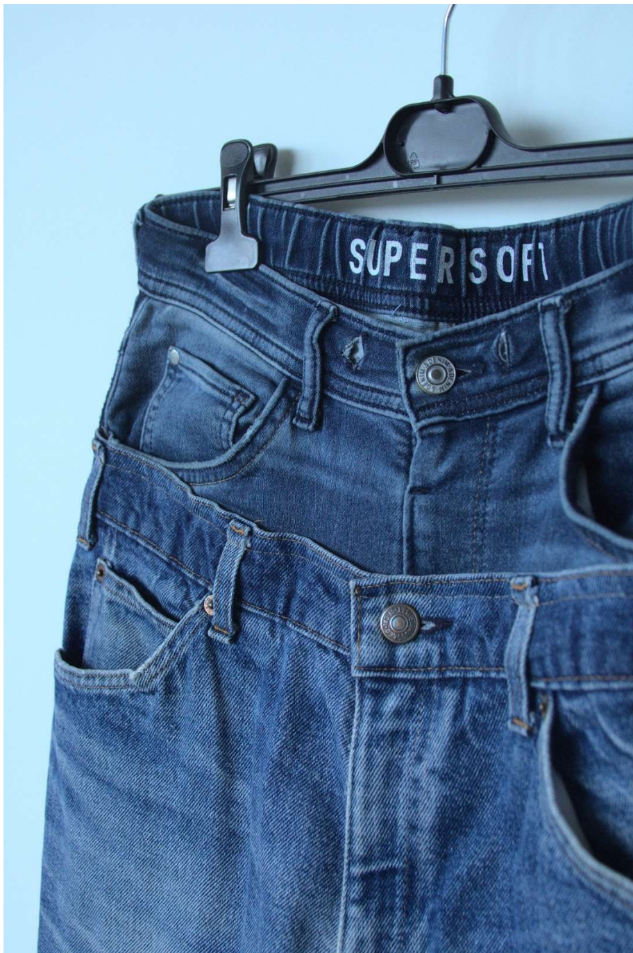
Slika 55 – outfit no.12, donji dio detalj

Torbica odnosno pismo torbica je u vidu krojne slike iznimno jednostavna, ali sam uzorak je vrijedan spomena jer je dobiven platno prepletom različitih traka sačuvanih iz restova materijala koje smo koristili prilikom izrade ostalih komada u kolekciji.