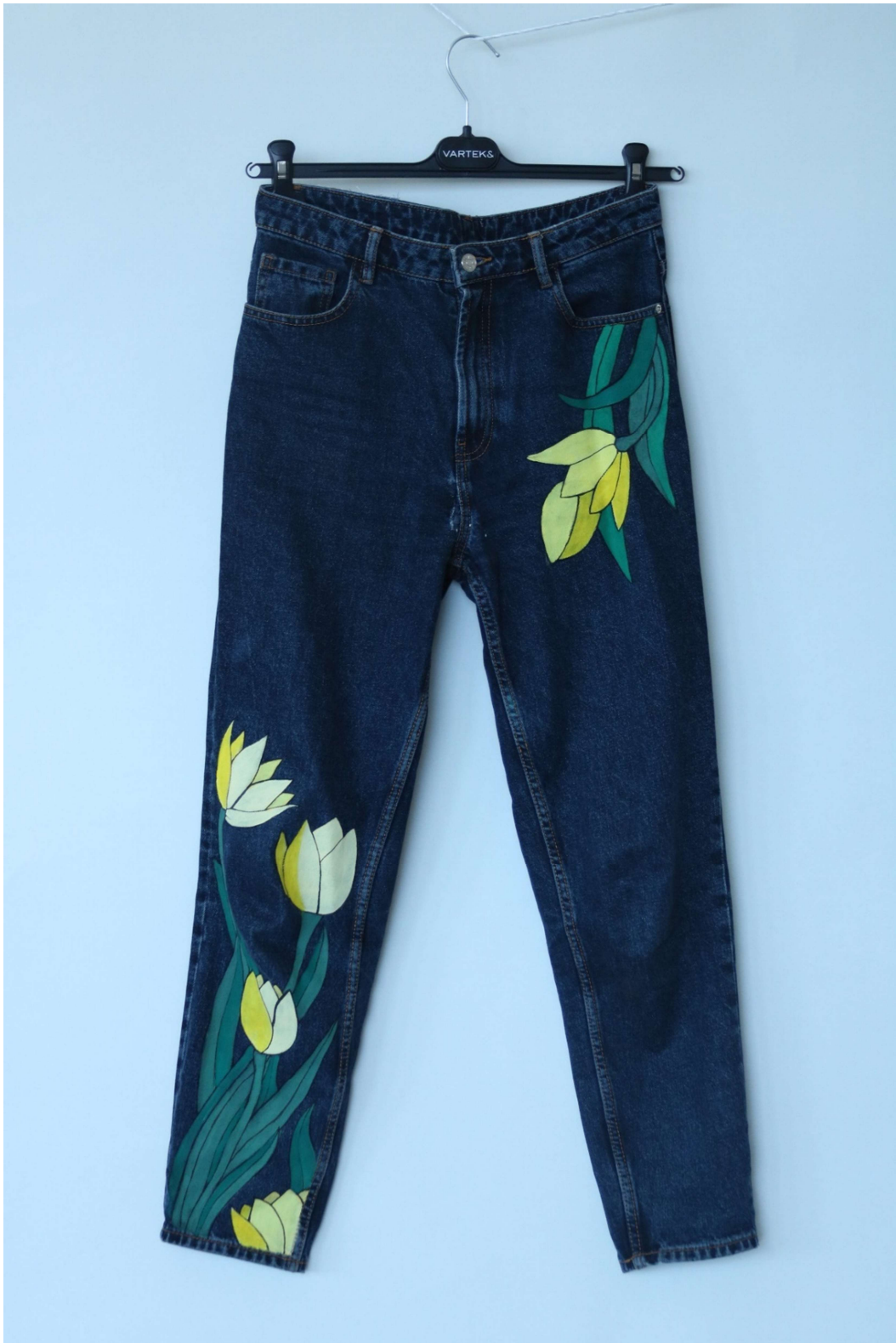
Slika 47 – outfit no.10, donji dio