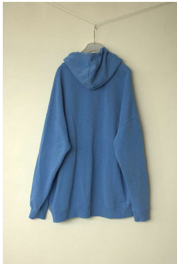
Slika 82 dječji dom - outfit no.1 - prije