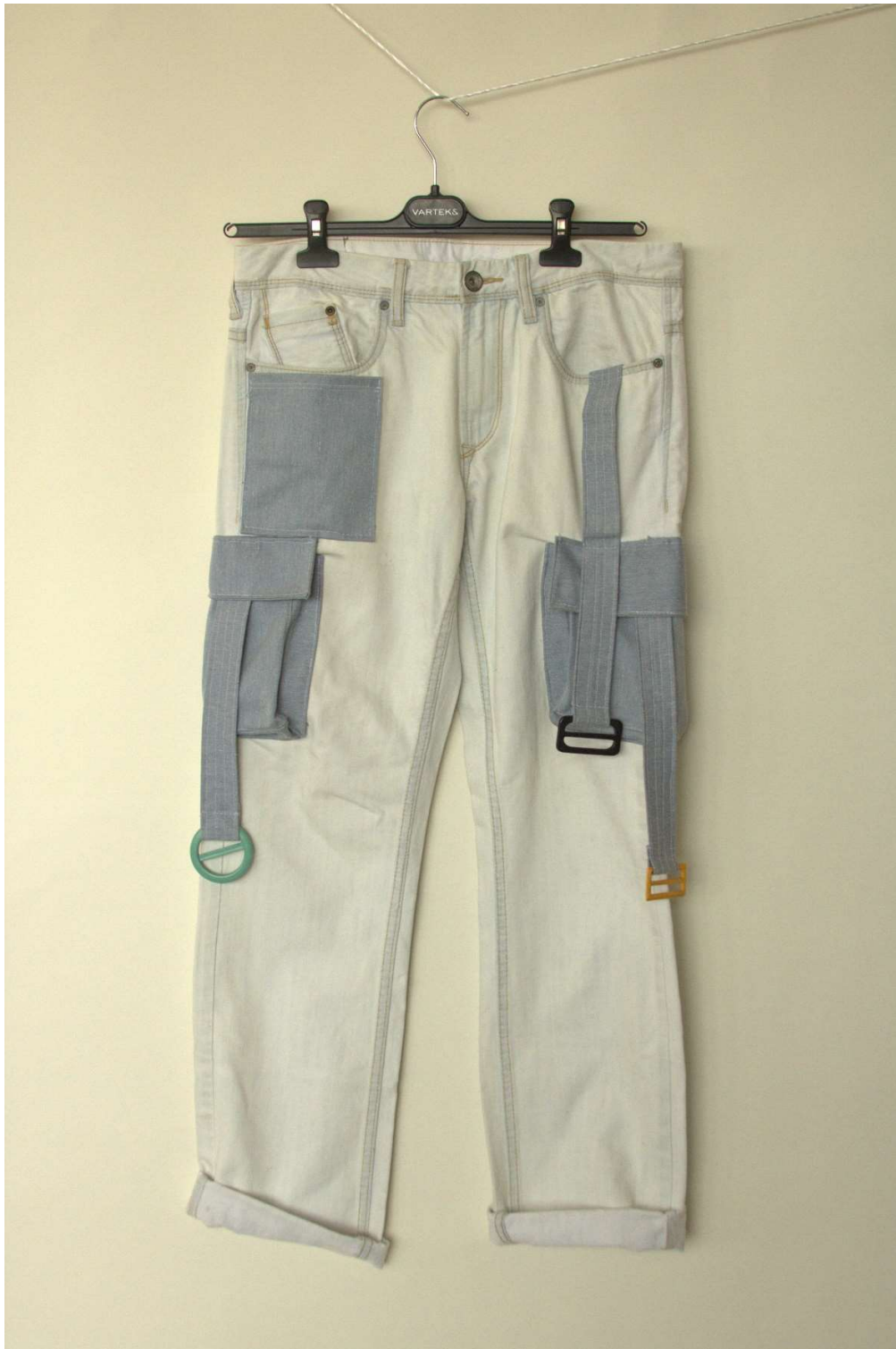
Slika 23 – outfit no.6, donji dio sprijeda