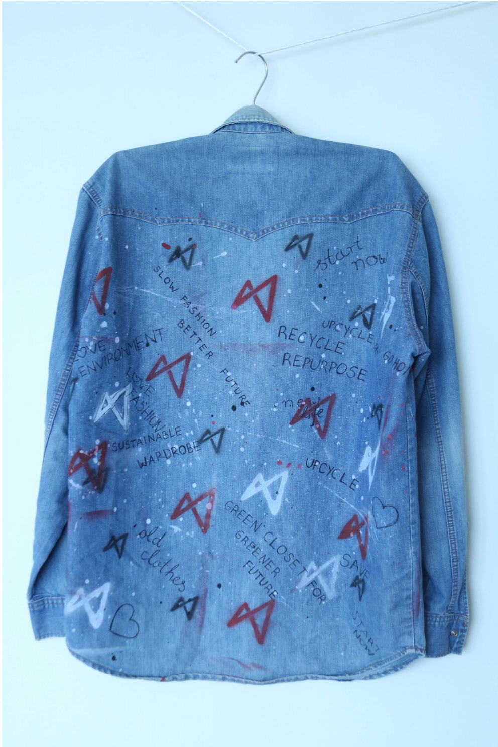
Slika 39 – outfit no.9, gornji dio straga