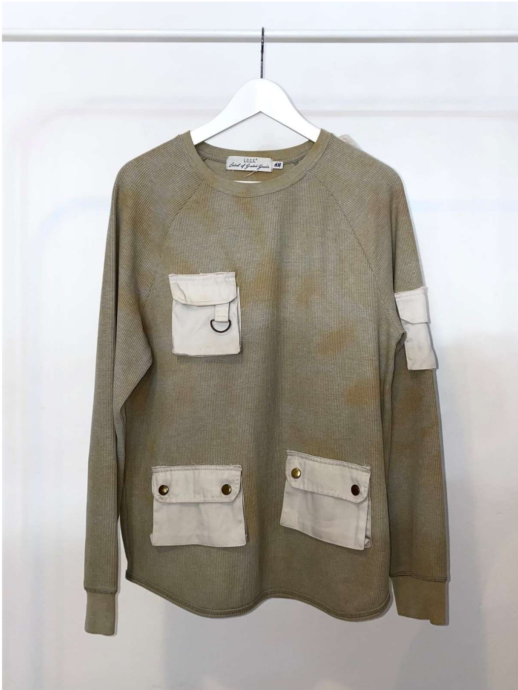
Slika 69 – outfit no.15 gornji dio