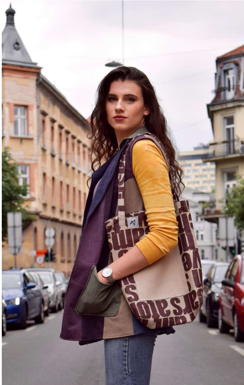
Slika 71 outfit no.14

U nastavku slijedi prikaz fotografijama događaja revije koju je Alavera održala za javnost u sklopu buvljaka Q'art Projekt Ilica.