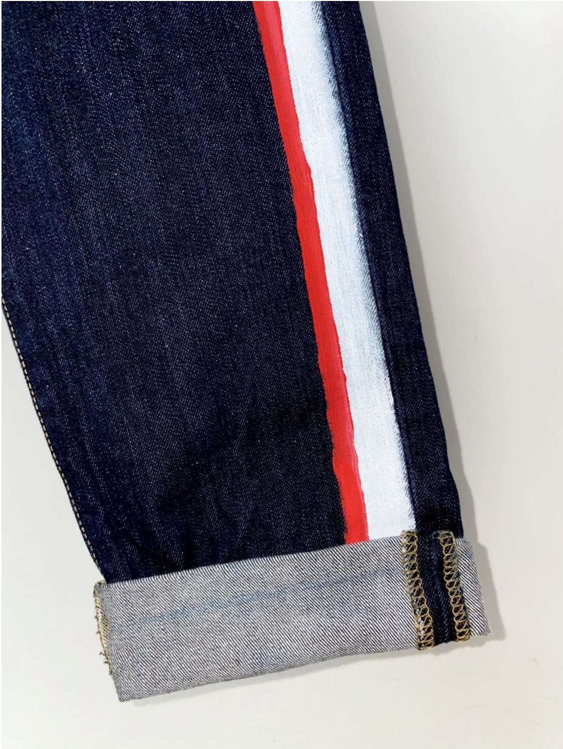
Slika 42 – outfit no.9, donji dio detalj