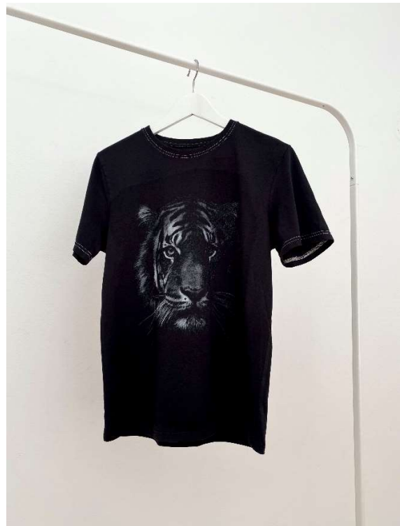
Slika 98 - dječji dom - outfit no.8 - poslije