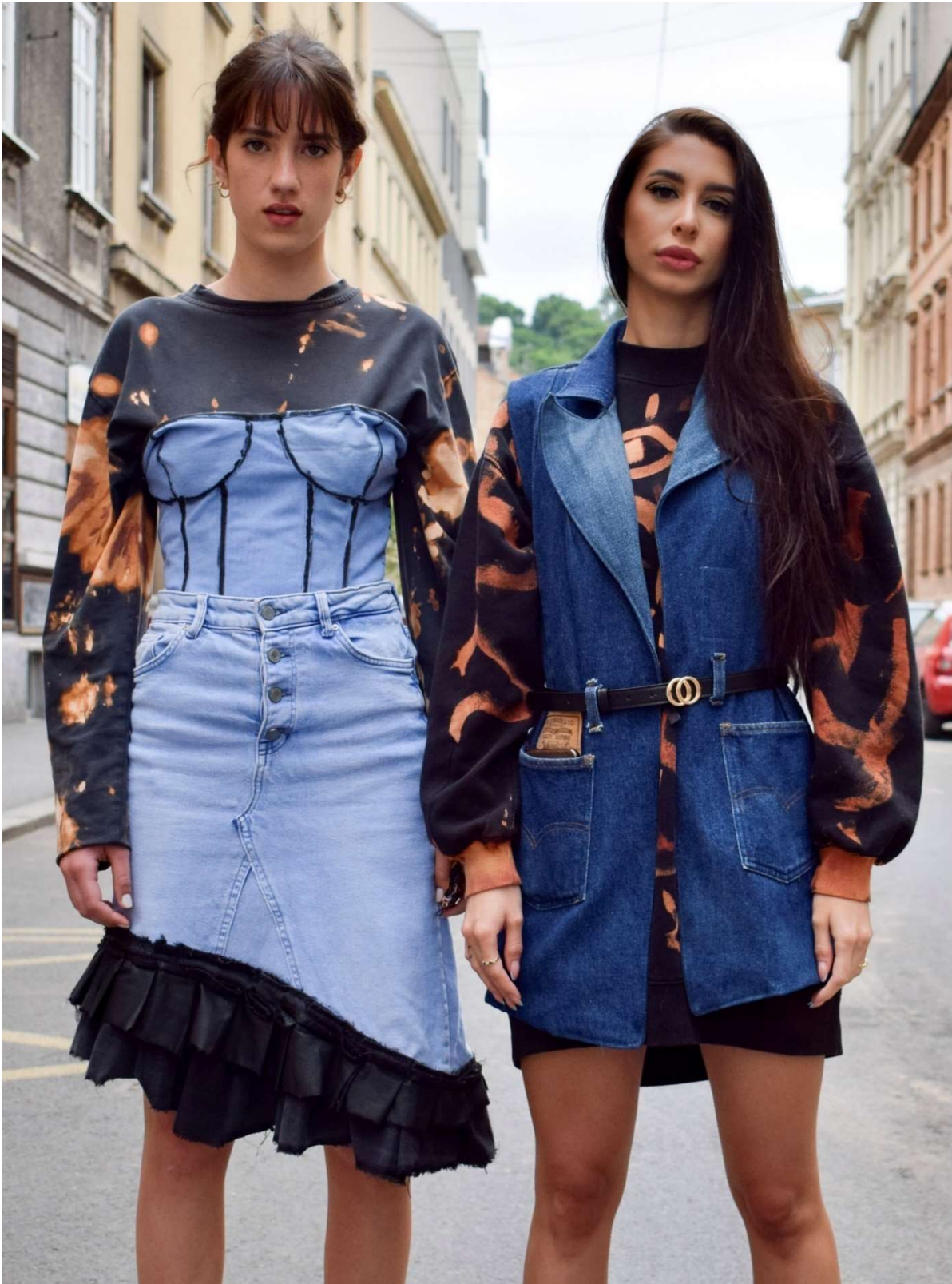
Slika 77 - outfiti no.11 (lijevo) i no.13 (desno)