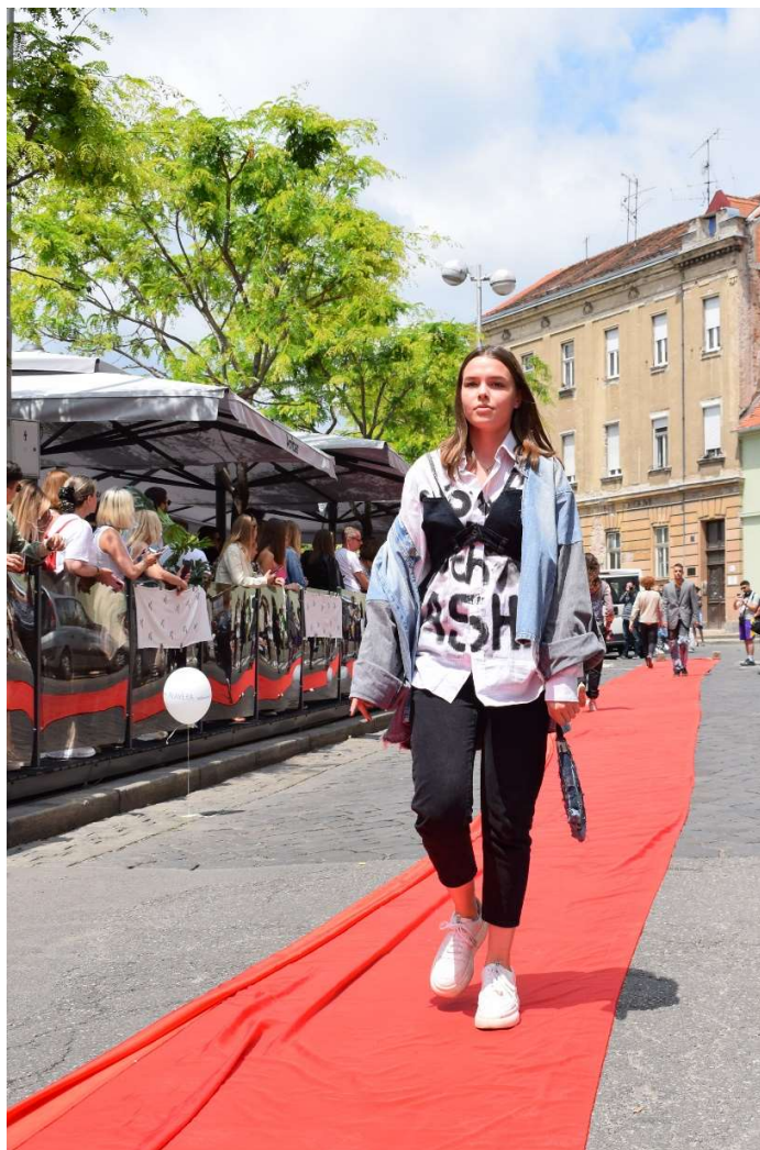
Slika 12 – outfit no. 4

Jakna je izrađena po principu kimono kroja. Stražnji i prednji dio su raskrojena dva para različitih traperica spojenih zatim u ramenom šavu. Na taj su, potom, spuštene rameni šav dodani donji dijelovi traperica u duljini dijela od koljena do ukupne duljine traperica, te je svemu još dodana traka za funkcionalnost koja pridrži rukav koji je iznimno dug i širok. Pojasnica jednih od korištenih traperica u ovome outfitu poprimila je svojstvo ovratnika. Reciklirana, odnosno ponovno upotrijebljena našla se i našivna etiketa modnog brenda Mustang.