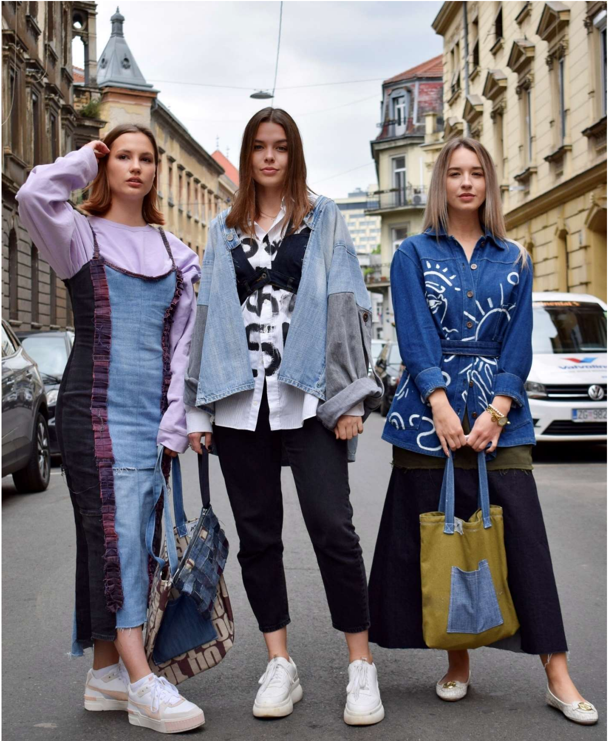
Slika 79 - outfiti no.1 (lijevo) no.2 (desno) i no.4 (sredina)