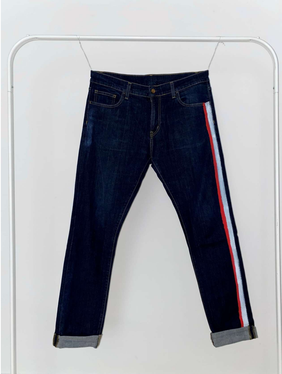
Slika 41 – outfit no.9, donji dio