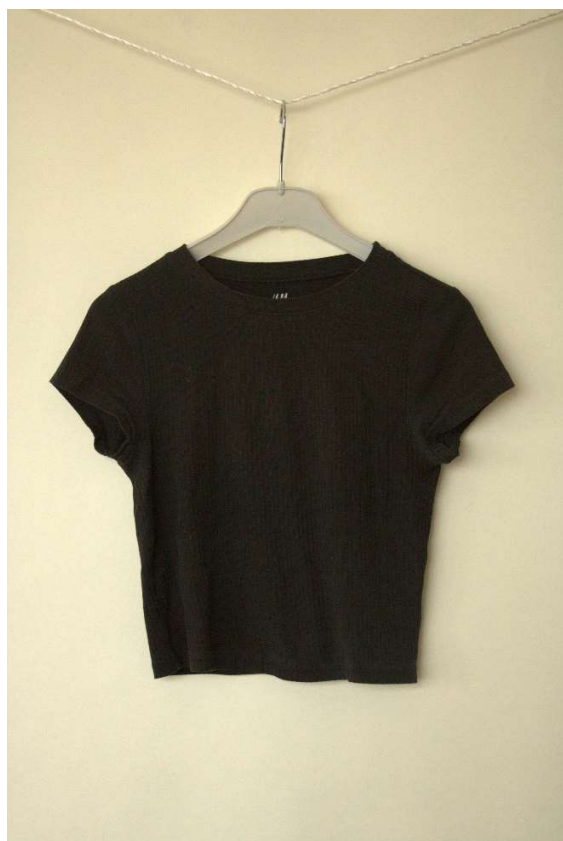
Slika 93 - dječji dom - outfit no.6 - prije

Cura je priložila vlastitu crnu crop-top majicu, te je postignut dogovor oko redizajniranja dane majice u vidu tipografskog tiska na prsa i rukave. Studentice studija dizajna iz tima izradile su tri vektorske datoteke zamišljene tipografije od strane naručitelja, te smo tisak napravili u tehnici heat-transfer toplinskom prešom. Prije tiska, nužno je bilo da kolegice s modnog dizajna iz tima odšiju rukave s majice kako bi se oni planarno postavili na toplinsku prešu, kako bi se tisak odvijao na što ravnijoj površini. Tri tiska ovaj put izvedena su folijom kako bi se postigao efekt fluorescencije na lijevome, te efekt odsjaja na desnome rukavu te na prsima.