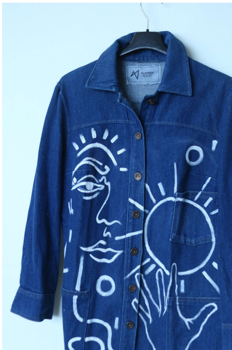
Slika 5 – detalj gornjeg dijela outfita no.2

Drugi dio odjevne kombinacije suknja je duljine do sredine lista ili 'midi', visokog struka te na kopčanje patentnim zatvaračem i gumbom. Prilikom realizacije modnog komada događa se reciklaža dvoje hlača, čijim spajanjem nastaje efektna suknja. Upotrijebljene su hlače maslinaste boje koje su odrezane od struka na niže, te po srednjem šavu kako bi se mogle odvojiti nogavice i dobiti otvor za suknju. Druge hlače od tamnog su trapera, rez je napravljen od bedra na niže, te su unutarnji rubni šavovi otparani kako bi se omogućilo njihovo kasnije spajanje u obliku suknje. Također s prednje strane dijela suknje od tamnog trapera načinjen je prorez zbog postizanja boljeg efekta. Nakon obrade dvoje spomenutih različitih hlača, njihovim spajanjem šivaćom