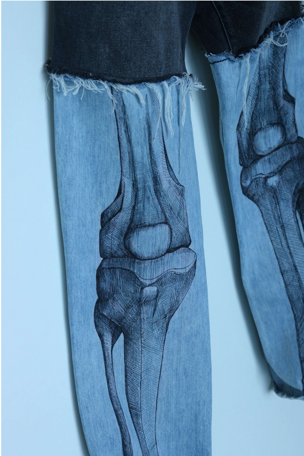
Slika 30 – outfit no.7, donji dio detalj