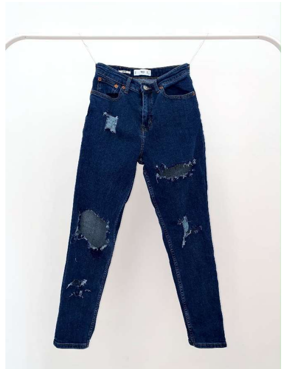
Slika 86 - dječji dom - outfit no.3 - poslije