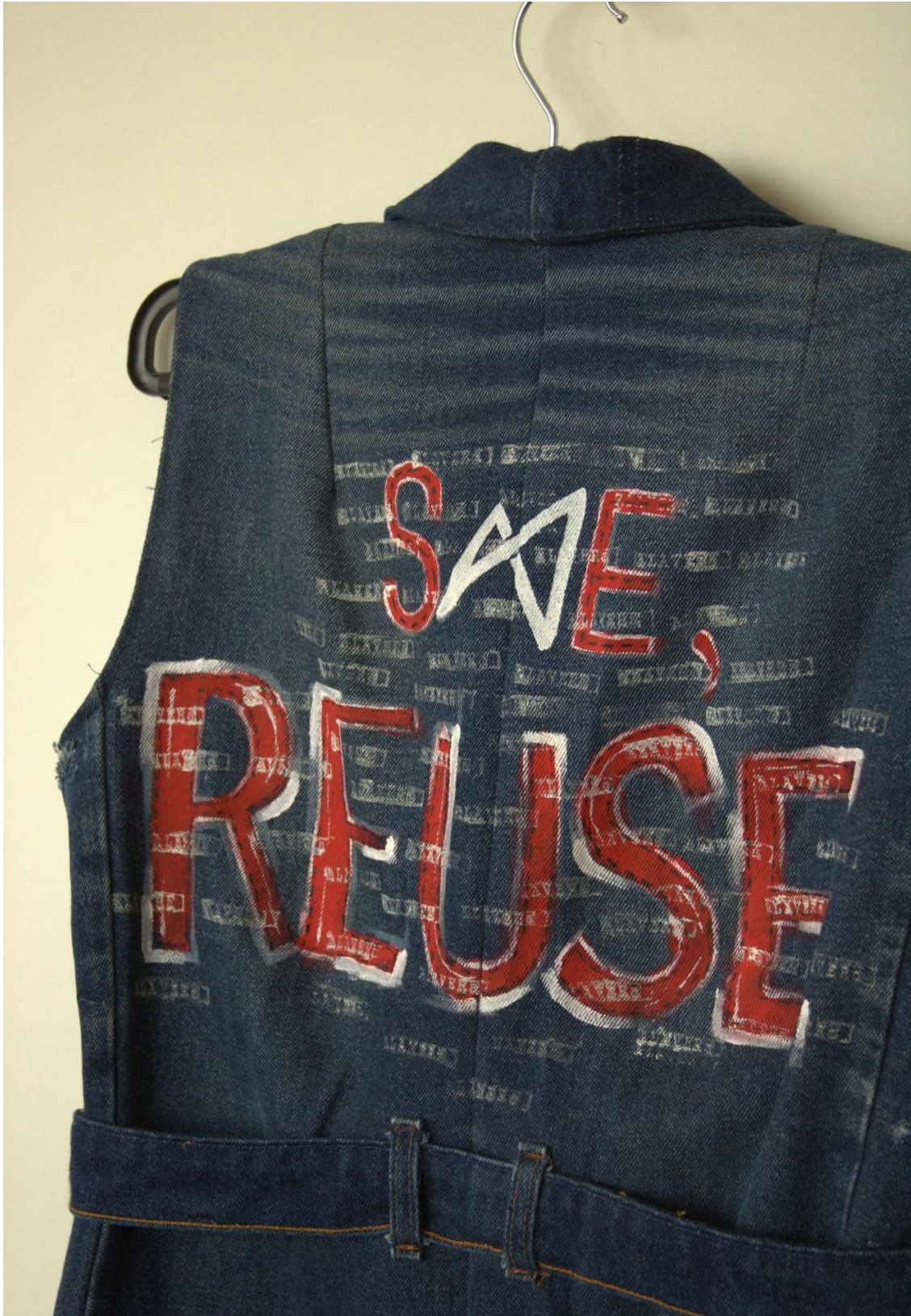
Slika 63 – outfit no.13 gornji dio straga, detalj