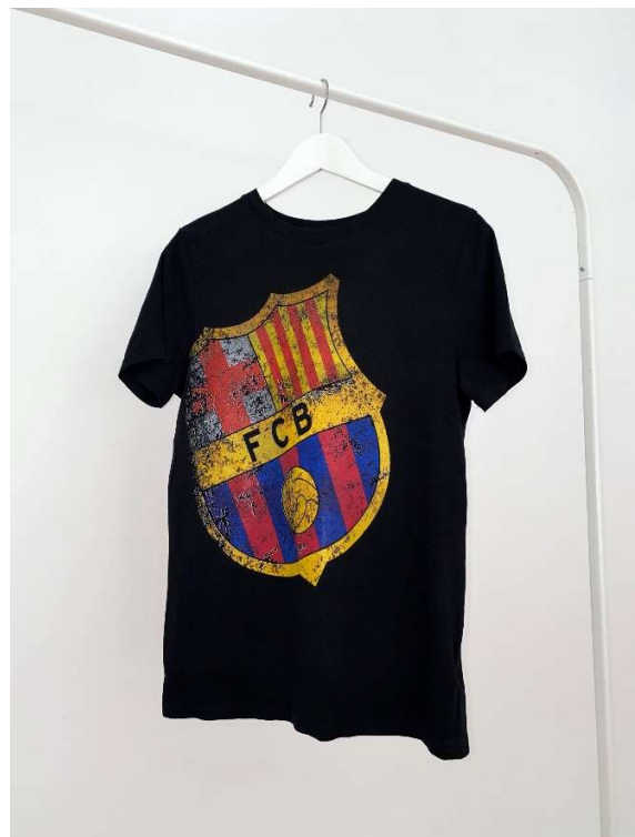
Slika 100 - dječji dom - outfit no.9 - poslije