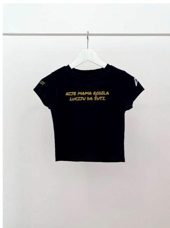
Slika 92 - dječji dom - outfit no.6 - poslije