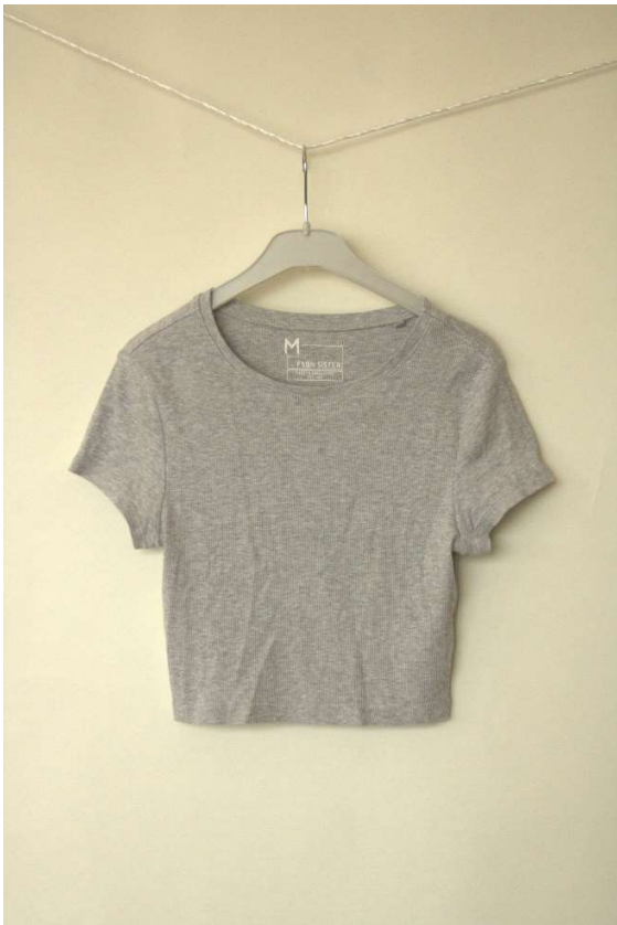
Slika 91 - dječji dom - outfit no.5 - prije

Cura je priložila vlastitu sivu crop-top majicu, te je postignut dogovor oko redizajniranja majice u vidu tipografskog tiska na prsa i leđa. Studentice studija dizajna iz tima potom su pripremile vektorske datoteke zamišljene tipografije od strane naručitelja, te smo tisak napravili u tehnici heat-transfer toplinskom prešom. Majica je primljena s radošću.