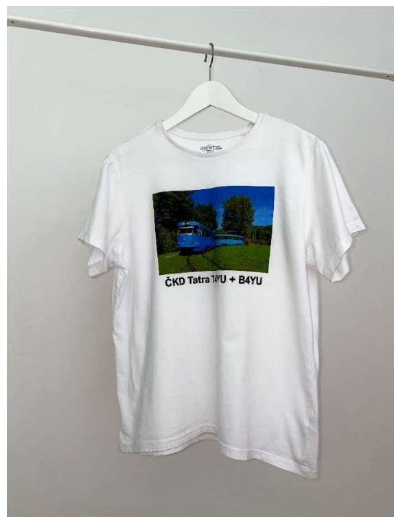
Slika 101 - dječji dom - outfit no.10 - poslije