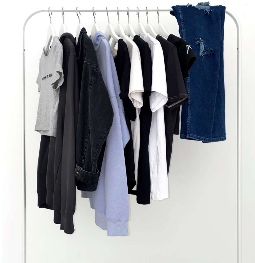
Slika 81 - kolekcija za dječji dom

Slijedi kratak prikaz te opis metodike i procesa korištenih u izvedbi Alaverine personalizirane kolekcije za djecu dječjeg doma Ivan Goran Kovačić.