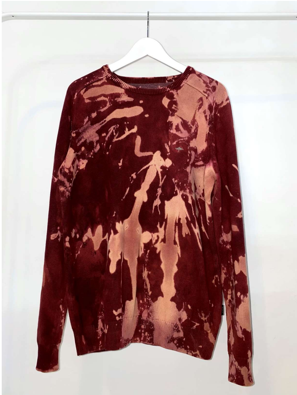
Slika 32 – outfit no.8, gornji dio

porubljen kako bi nastao parani rub nogavica čime se pridaje izgledu ležernosti, odnosno streetstyle-u 11 .