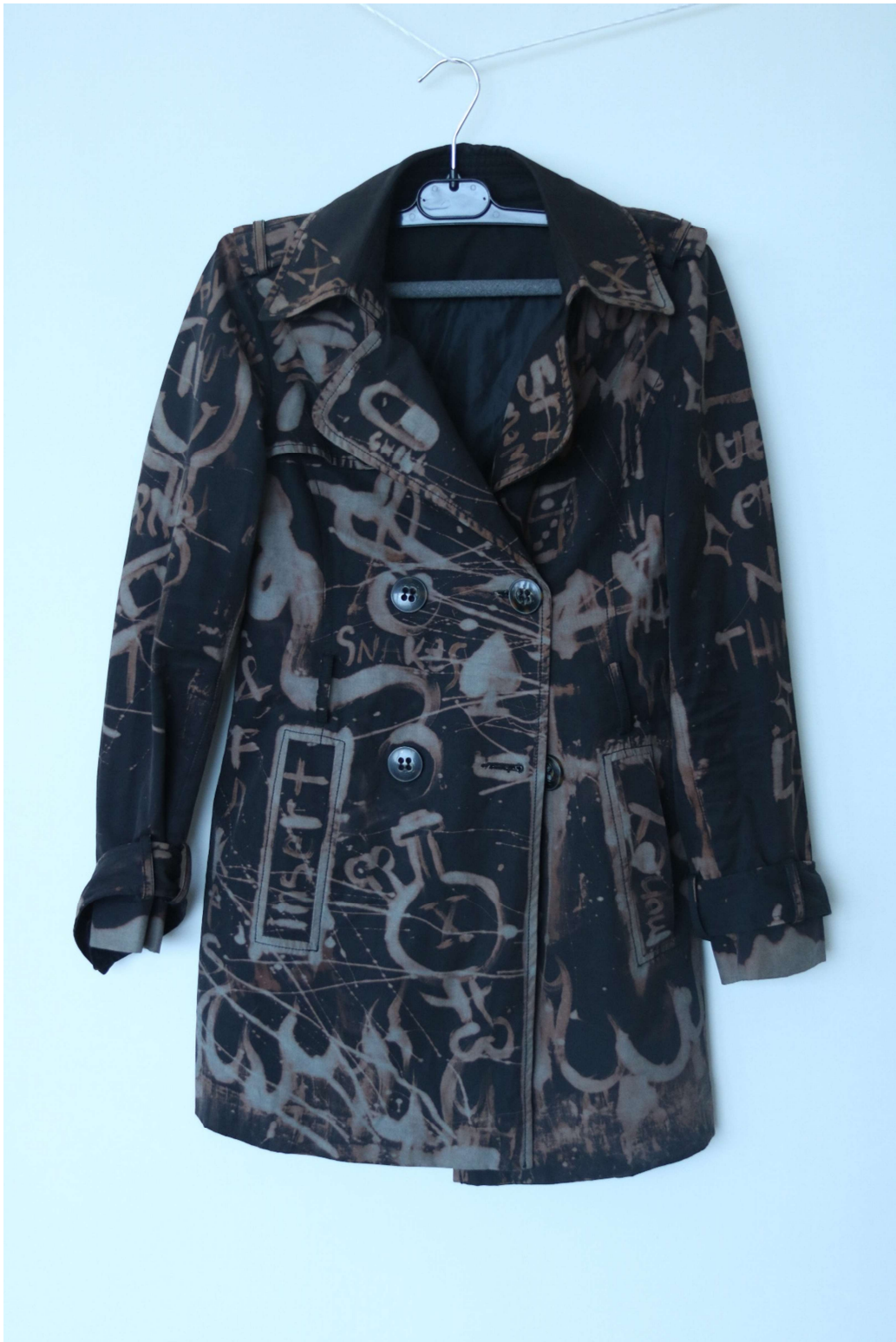
Slika 56 – outfit no.12, gornji dio, baloner