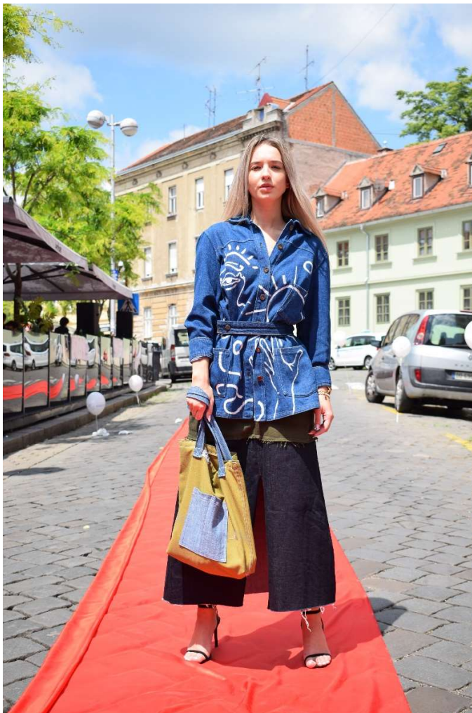
Slika 4 – outfit no.2

Kroz ekološki pristup dizajniranju i proizvodnji s ciljem produživanja životnog vijeka odjeće nastaje modna kombinacije inspirirana uličnom modom. Kreacija se sastoji se od jeans jakne i suknje. Plava traper jakna zakopčava se na male gumbiće sa prednje strane, pri dnu ima dva džepa, a u struku je dodana pasica koja se može zakopčati kako bi se naglasio struk. S obzirom da je glavna poanta bila odjevni predmet osvježiti i učiniti ga zanimljivim, te je pamuk kao vrsta tkanine najpogodnija podloga za slikanje, traper jakna ukrašena je bijelom bojom za tekstil. Traper je prvo pripremljen tako što je prije oslikavanja opran (jer boja bolje prijanja na oprani tekstil), zatim se debljim kistom pažljivo nanijela boja, pomiješana s malom količinom vode, kako bi se osiguralo