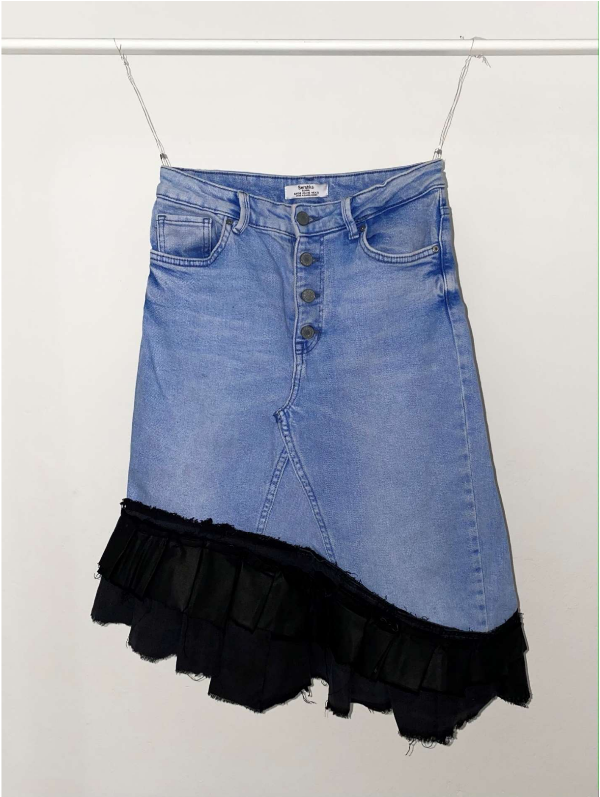
Slika 53 - outfit no.11, donji dio