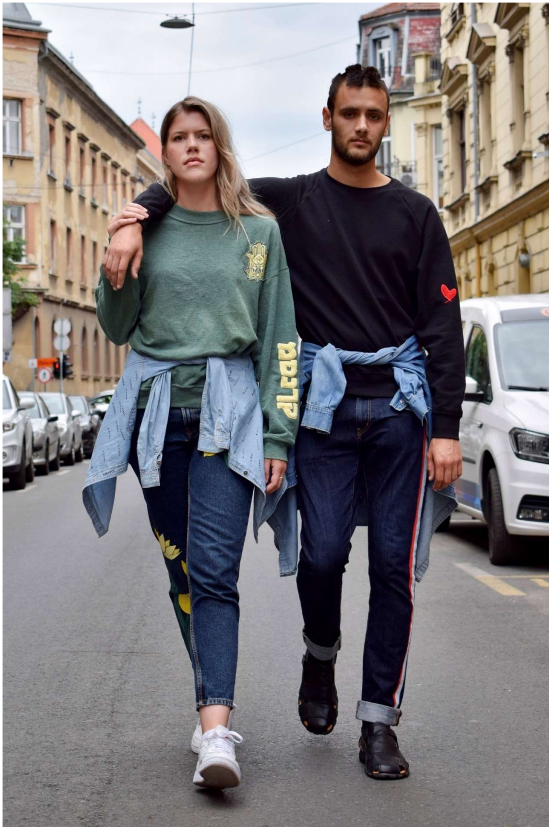
Slika 76 - outfiti no.9 (desno) i no.10 (lijevo)