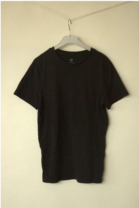
Slika 99 - dječji dom - outfit no.9 - prije

Dječak je priložio vlastitu crnu majicu kratkih rukava, te je postignut dogovor oko redizajniranja iste u vidu tiska znaka omiljenog mu nogometnog kluba na prednji dio majice. Studentice studija dizajna iz tima obradili su sliku znaka nogometnog kluba pronađenu na internetu u stilu kakav je naručitelja zamislio, izradili vektorsku datoteku za tisak u vintage maniri te smo tisak napravili u tehnici heat-transfer toplinskom prešom.