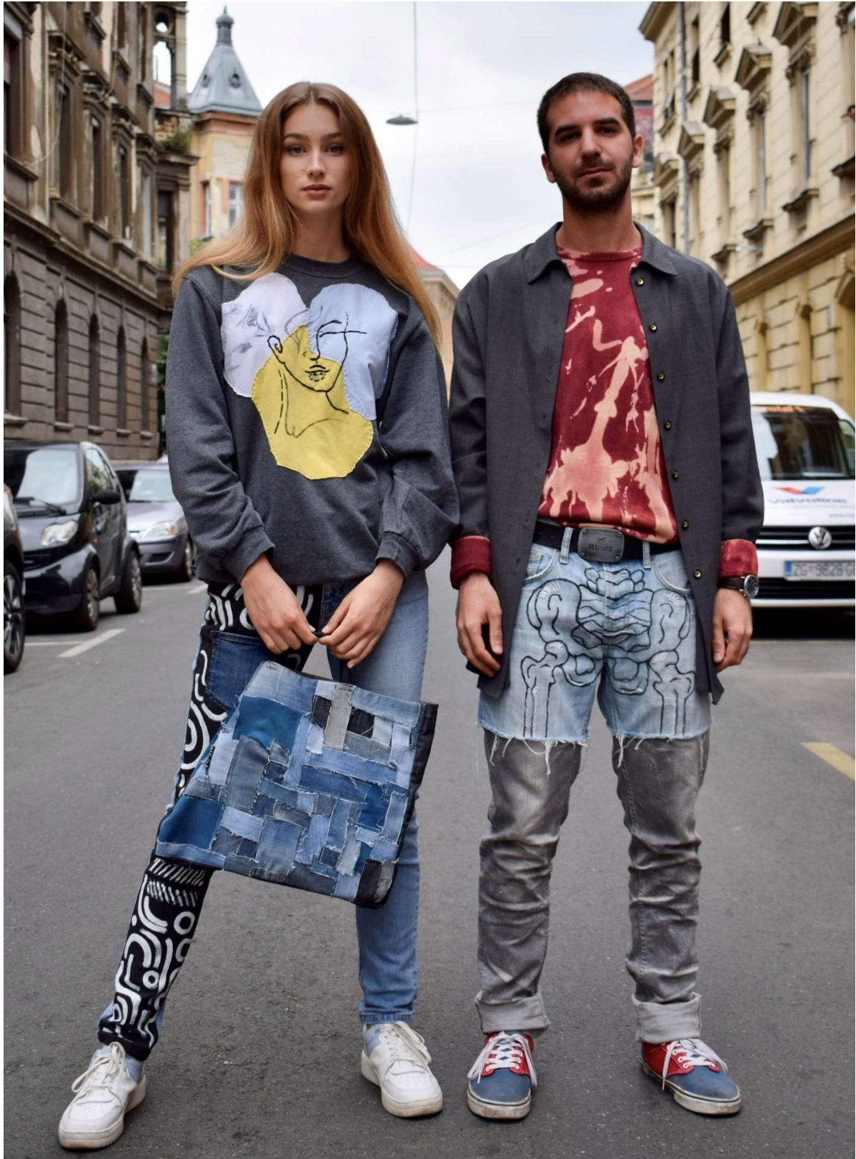
Slika 78 - outfiti no.5 (lijevo) i no.8 (desno)