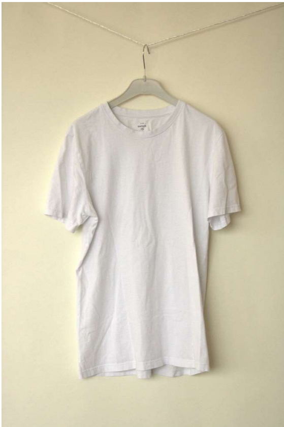
Slika 97 - dječji dom - outfit no.8 - prije

Dječak je priložio vlastitu bijelu majicu kratkih rukava, te je postignut dogovor oko redizajniranja iste u pogledu promijene boje u crnu te tiska motiva tigra na prsa. Studentice studija modnog dizajna majicu su obojale Simplicol bojom za prebojavanje tekstila u perilici rublja, a potom dale studenticama studija dizajna za zadatak vektorizirati ilustrativni primjer skice tigra koje su same nacrtale. Nakon postizanja vektorske datoteke, napravio se tisak tehnikom heat-transfer . Promjena boje te tisak udahnuili su svježinu u majicu koja je do tada bila rijetko nošena, primaoc je izjavio kako se majica vratila u njegov aktivni dio ormara.