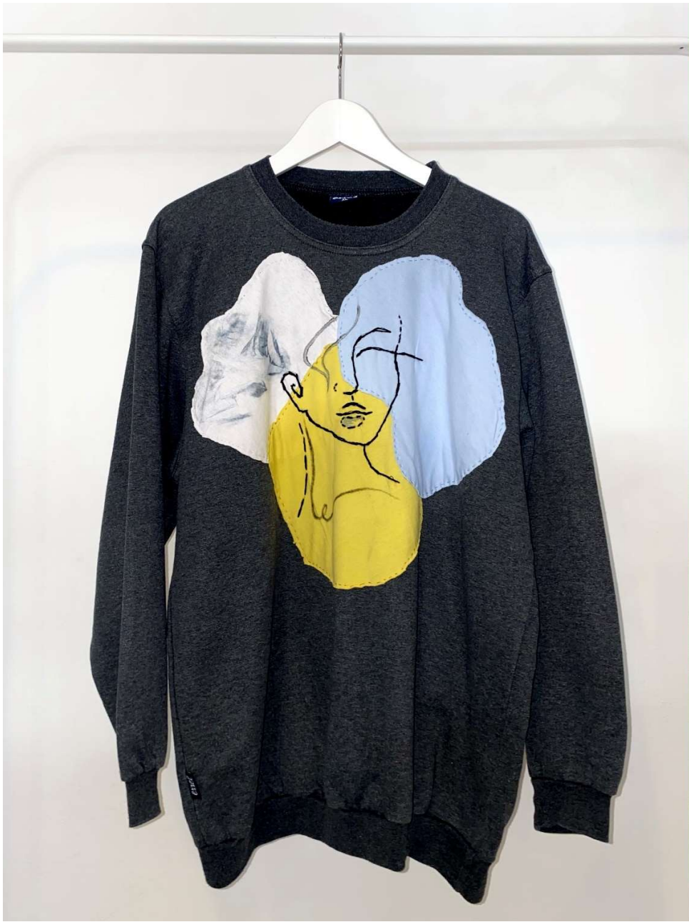
Slika 18 – outfit no.5, gornji dio