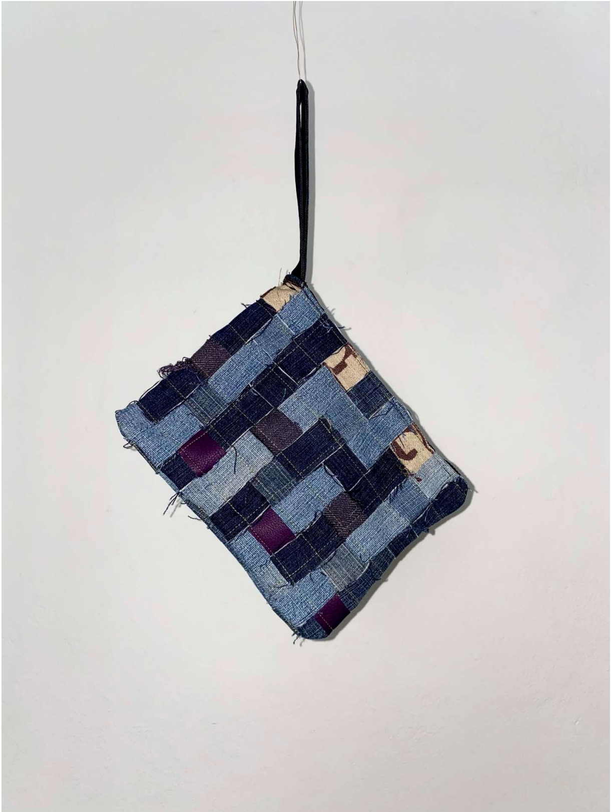
Slika 58 - outfit no.12, modni dodatak, torbica