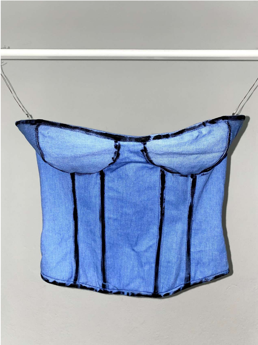
Slika 51 – gornji dio, korzet