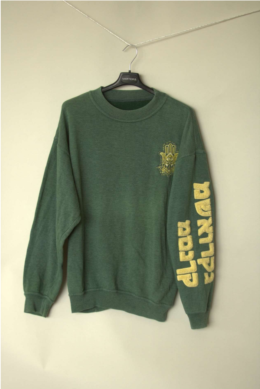
Slika 44 - outfit no.10, gornji dio