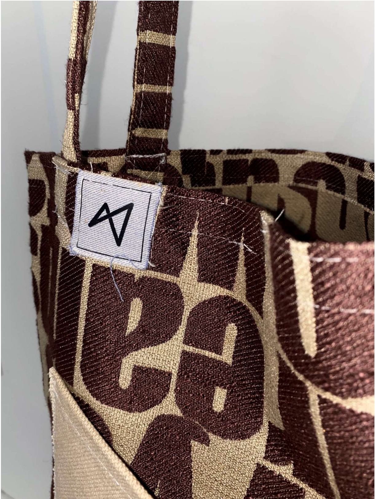
Slika 67 - outfit no.14, tote bag detalj