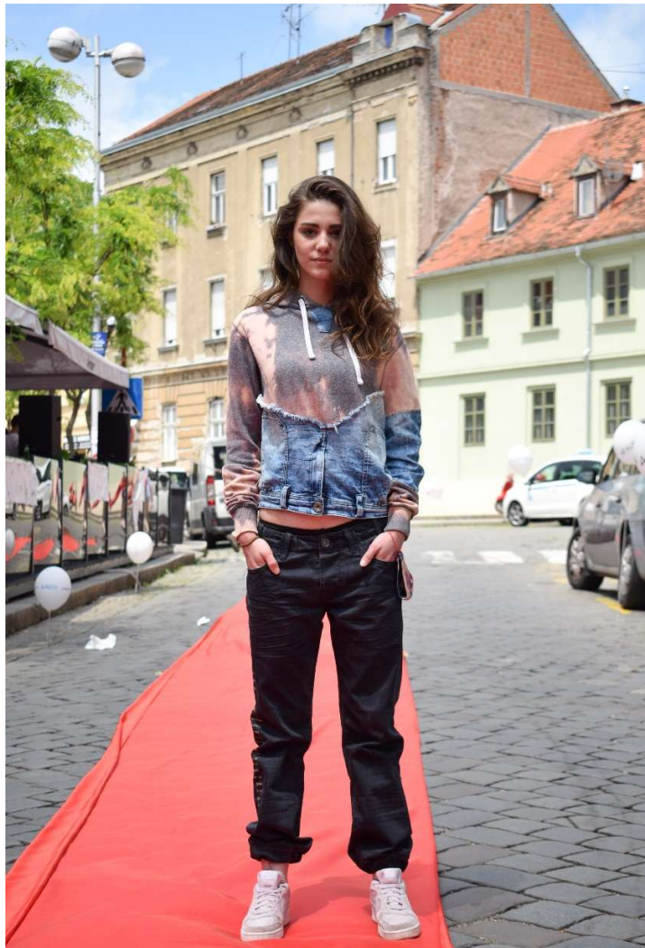
Slika 8 – outfit no. 3

Ženska hudica nastaje kroz zanimljiv proces recikliranja traperica i podeblje hudice. Djelovanjem izbjeljivača na samu hoodicu postupkom „tie dye“ nastaje zanimljiv te nedefiniran uzorak s još zanimljivijim prijelazima boja. Izbjeljele traperice izrezane su u području bedara bez forme kako bi se postigao nehajan izgled, zatim se taj komad tropera, nakon što se hudici napravio rez u području ispod prsa, našivao šivaćom mašinom na hudicu. Hudica nakon što je „cropana“ ponovo dobiva svoju normalnu dužinu, a za bolji vizualni dojam dio tropera dodan je na nadlakticu lijevog rukava.