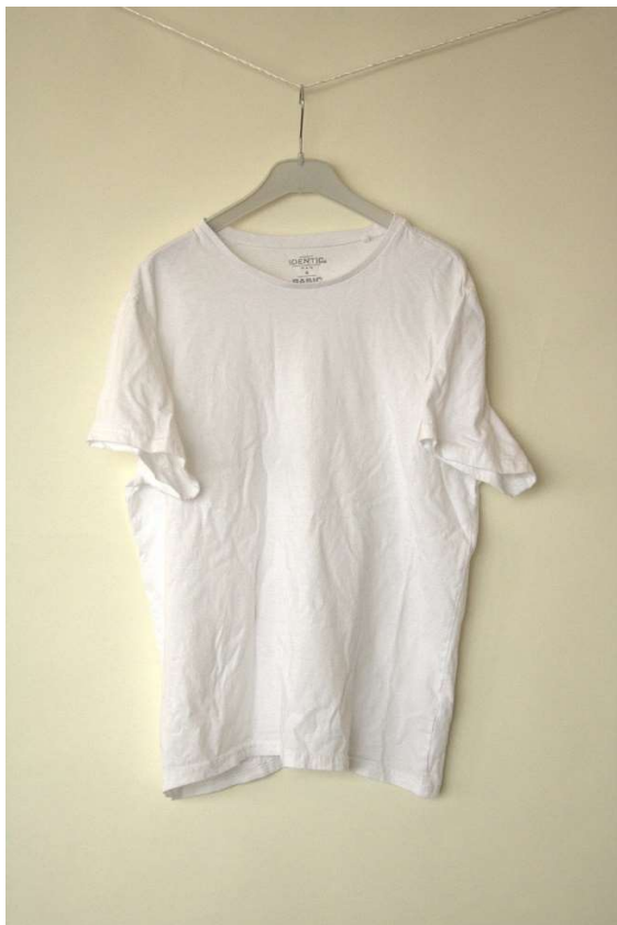
Slika 102 - dječji dom - outfit no.10 - prije

Dječak je priložio vlastitu bijelu majicu kratkih rukava, te je postignut dogovor oko redizajniranja iste u vidu tiska slike koju će priložiti te tipografije koju će osmisliti na prednji dio majice. Studentice studija dizajna iz tima obradili su poslanu nam sliku u obliku bolje kalibracije boja te automatske nadopune pikselima, izradili vektorsku datoteku za tisak te osmislili kompoziciju spomenuta dva elementa te smo tisak napravili u tehnici heat-transfer toplinskom prešom.