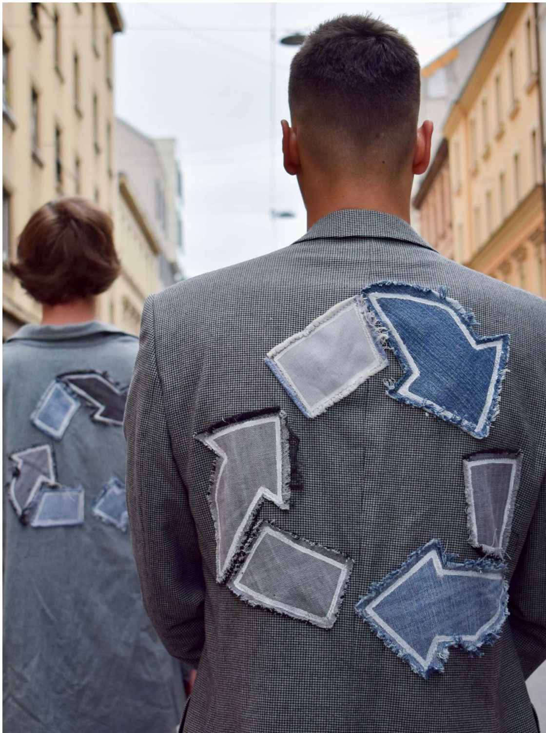
Slika 80 - outfiti no.6 (lijevo) i no.7 (desno)