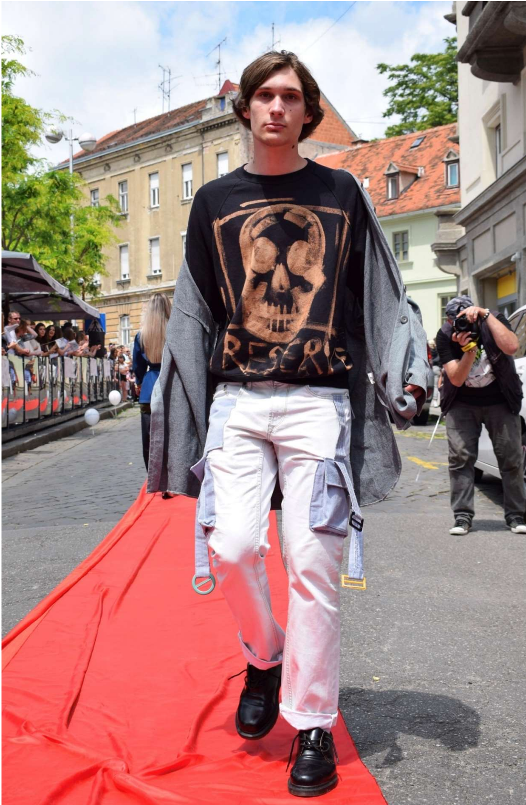
Slika 75 - outfit no.6