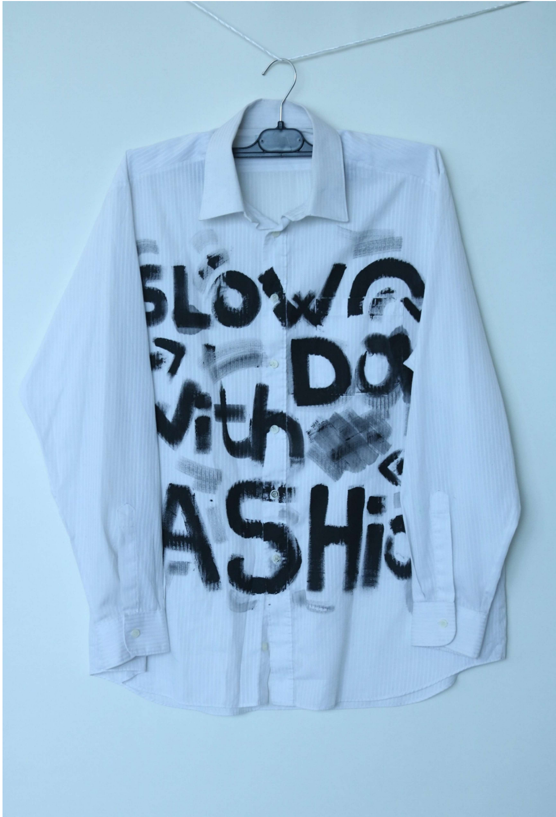
Slika 14 – outfit no.4, gornji dio