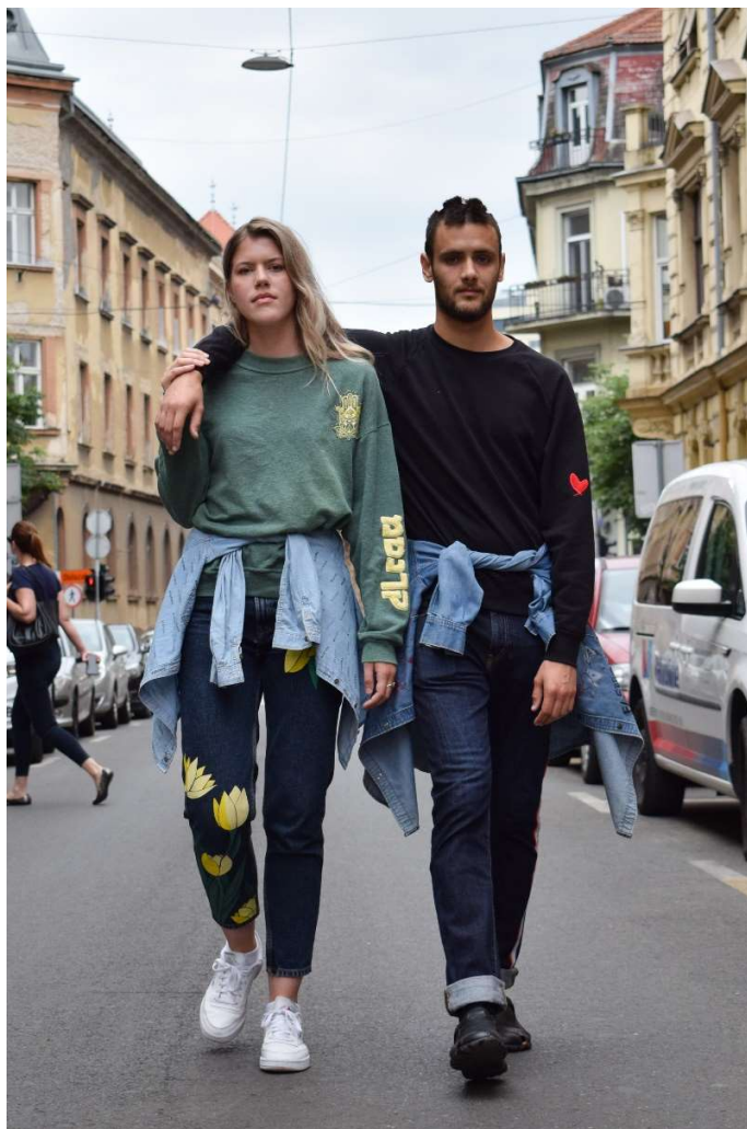
Slika 43 – outfit no.10 (lijevo)

Cijela kombinacija odiše jednostavnošću odijevanja, namijenjenom za svaki dan.