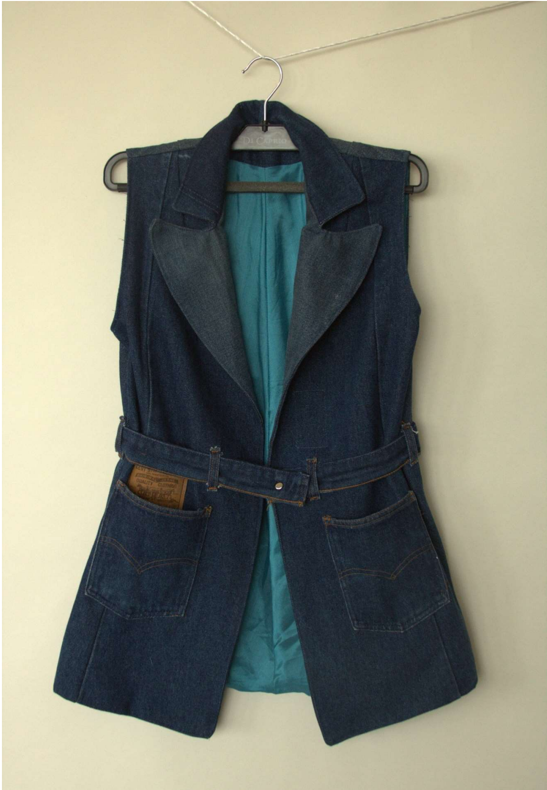
Slika 61 – outfit no.13, gornji dio