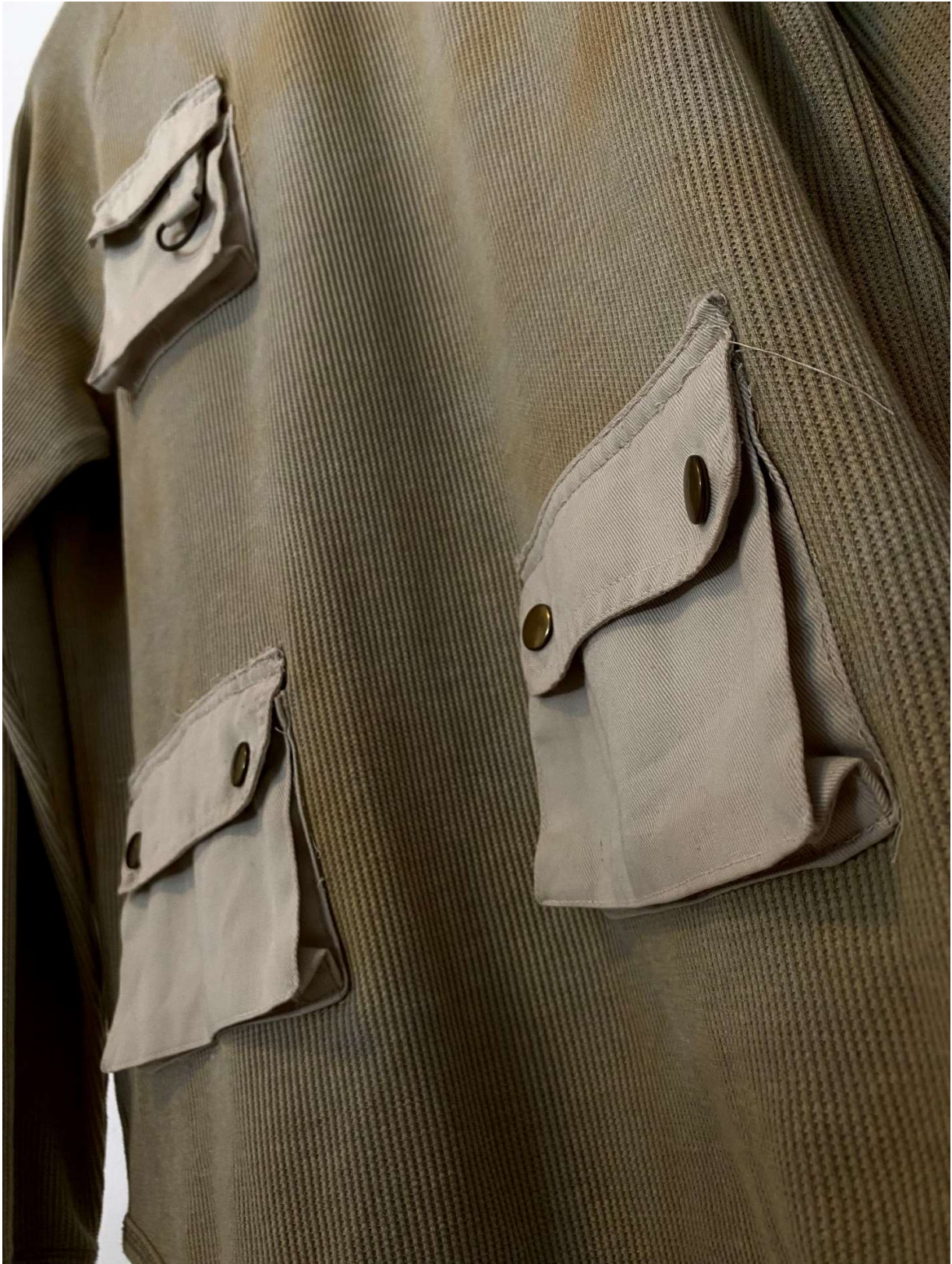
Slika 70 - outfit no.15, gornji dio detalj