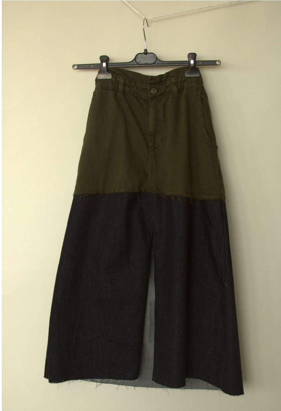
Slika 6 – outfit no.2 donji dio

mašinom nastaje krajnji proizvod. Suknja nije porubljena kako bi nastao parani rub suknje čime se pridonosi efektu ležernosti.