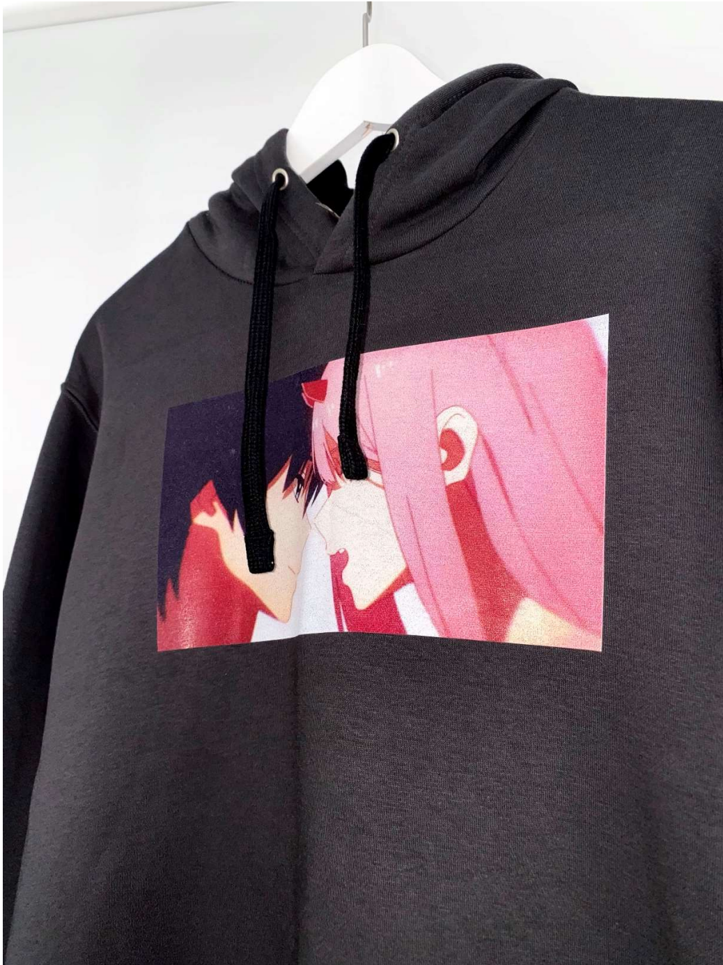
Slika 96 - dječji dom - outfit no.7 - poslije, detalj