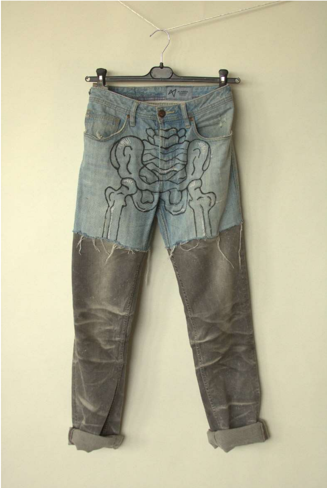
Slika 34 – outfit no.8, donji dio