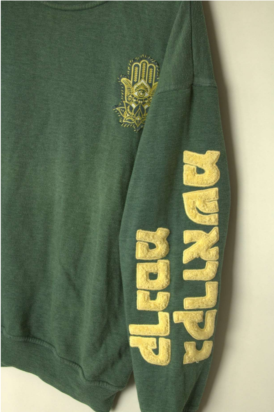
Slika 45 - outfit no.10, gornji dio detalj