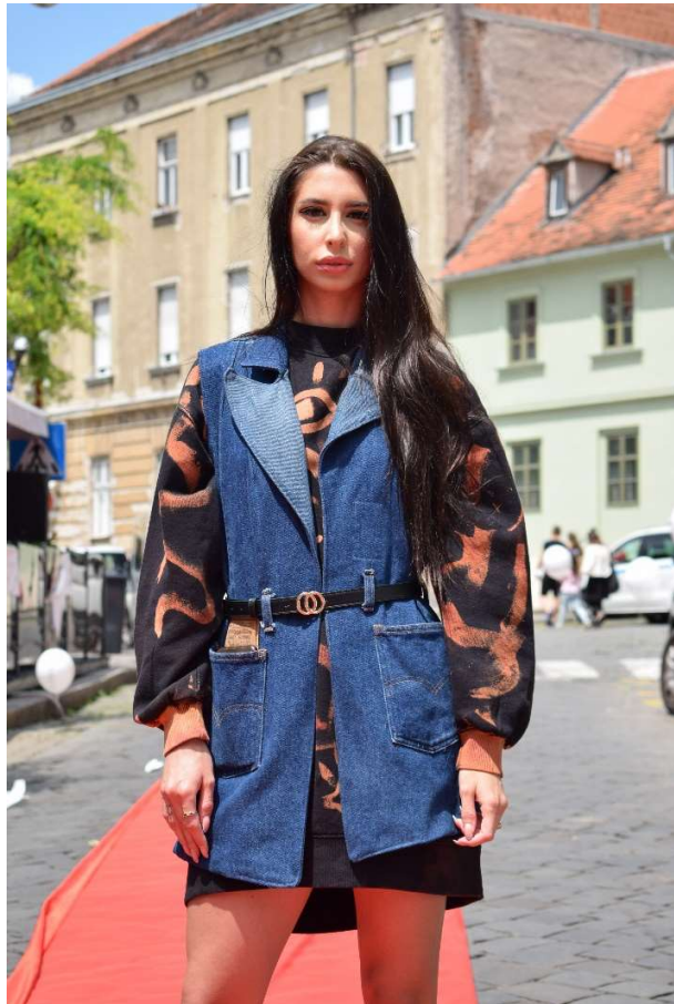
Slika 59 – outfit no.13

Sako je izrađen iz tri modela muških traperica modela Levis. Kod ovog modela možemo se pohvaliti najvećom iskoristivošću rabljenog materijala jer je uklapanje krojne slike sakoa u centimetar odgovaralo dobivenom materijalu nakon rastvaranja traperica. Naknadno su iskorišteni i ostali elementi poput stražnjih džepova, pojasnice, mali držači za pojasnicu te čak i našivna etiketa.