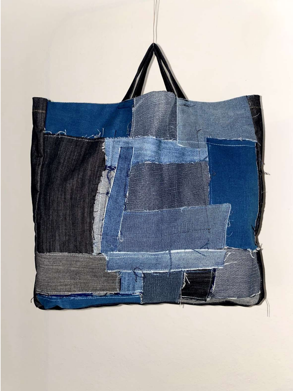
Slika 19 – tote bag u sklopu outfita no.5