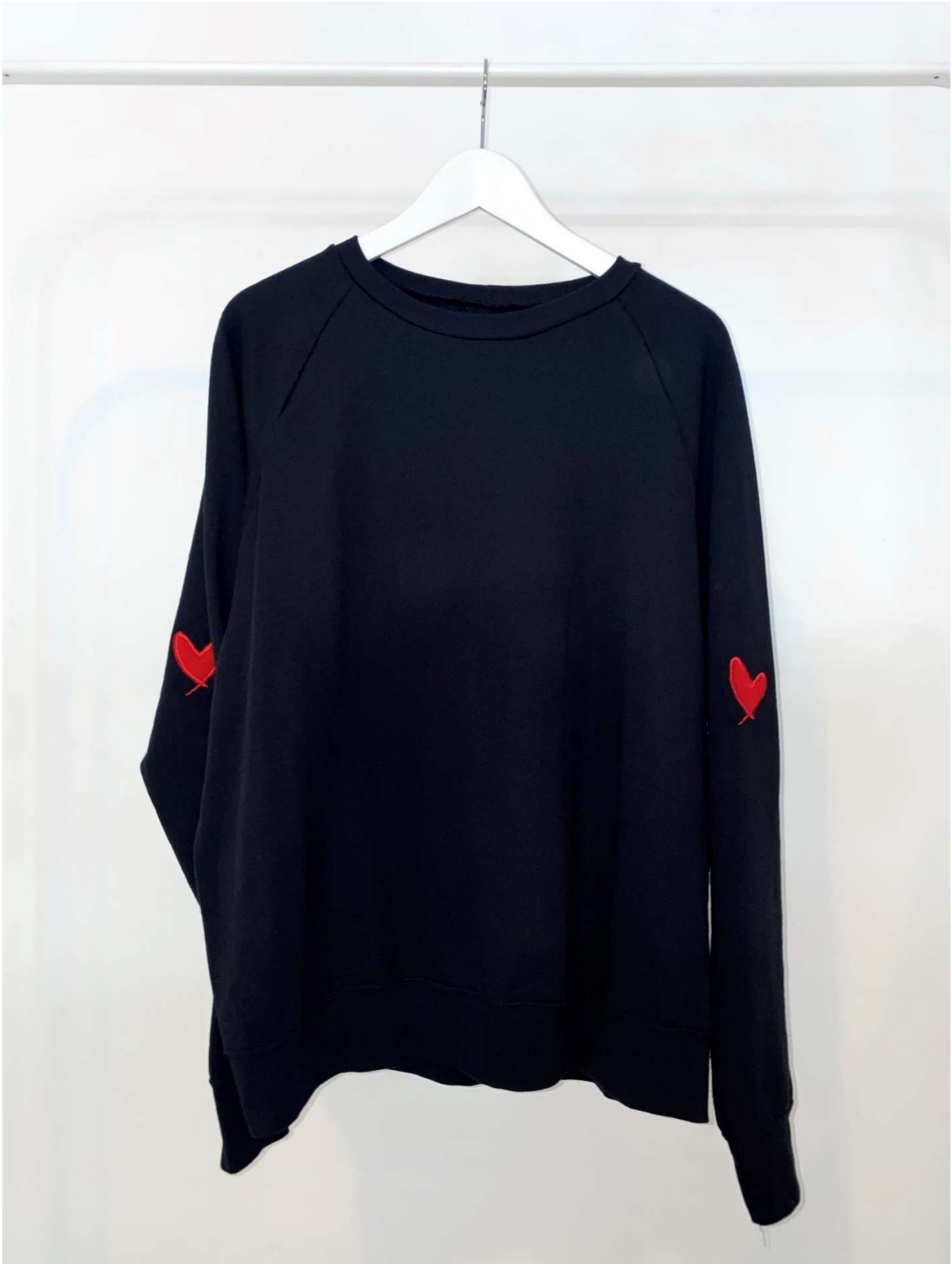
Slika 37 - outfit no.9 gornji dio