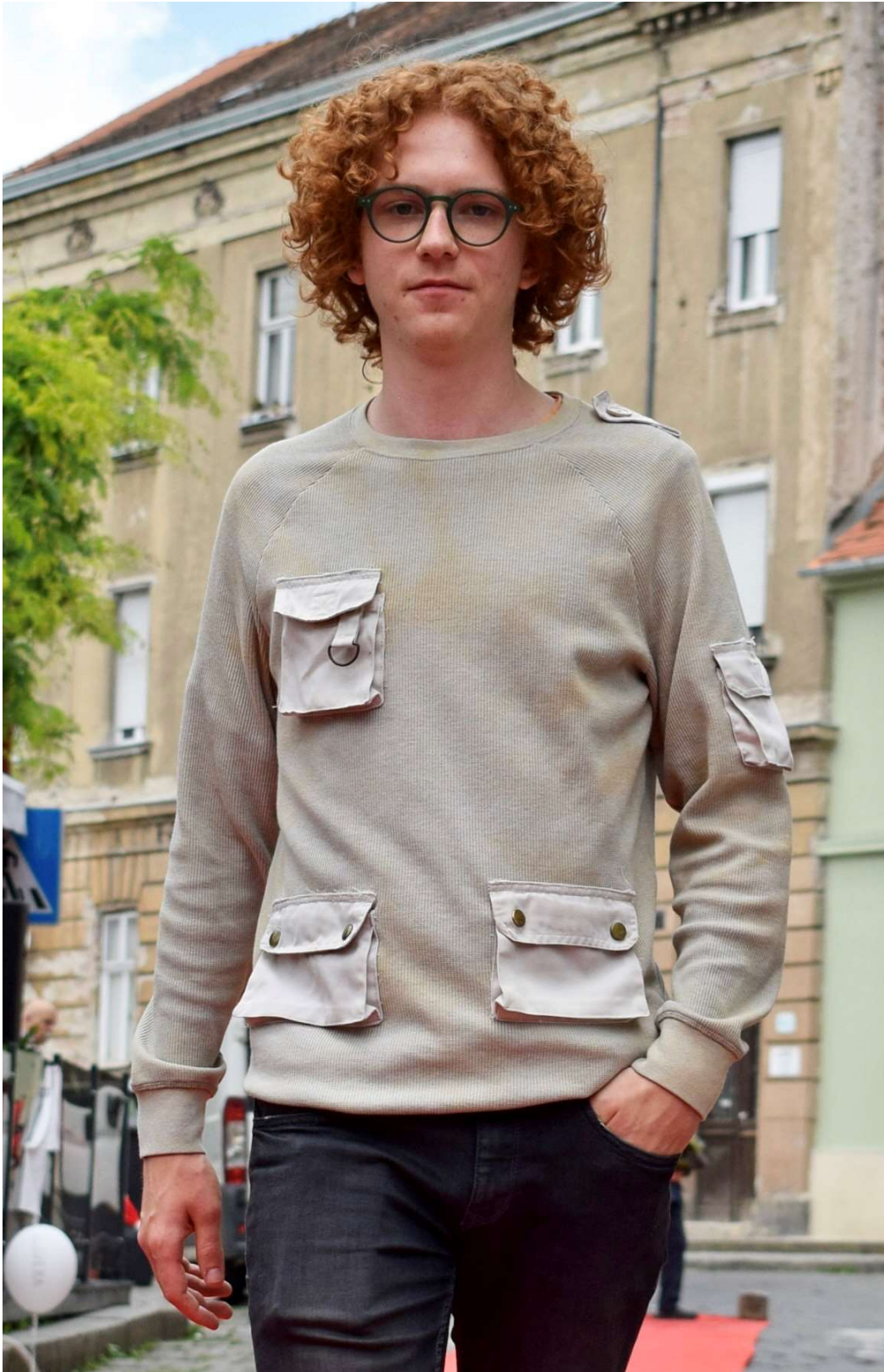
Slika 74 - outfit no.15