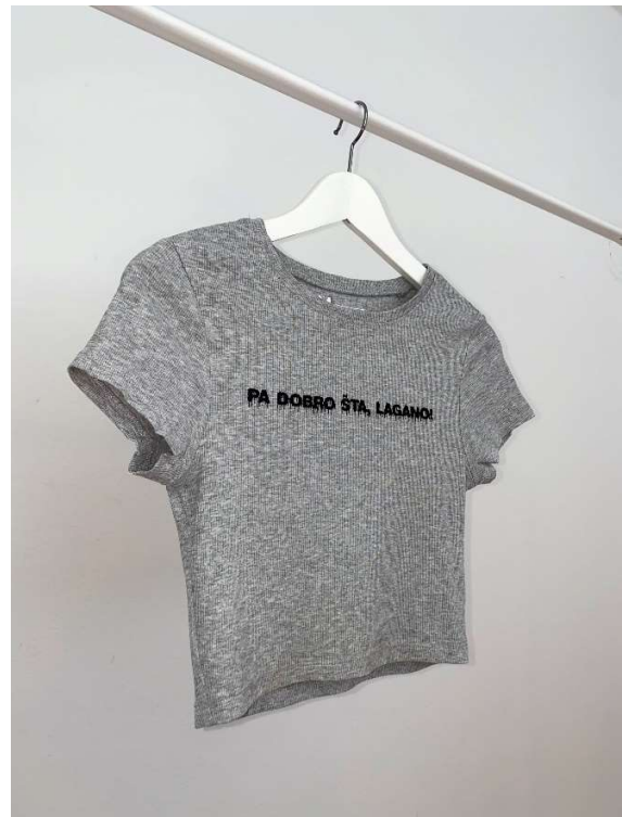
Slika 90 - dječji dom - outfit no.5 - poslije