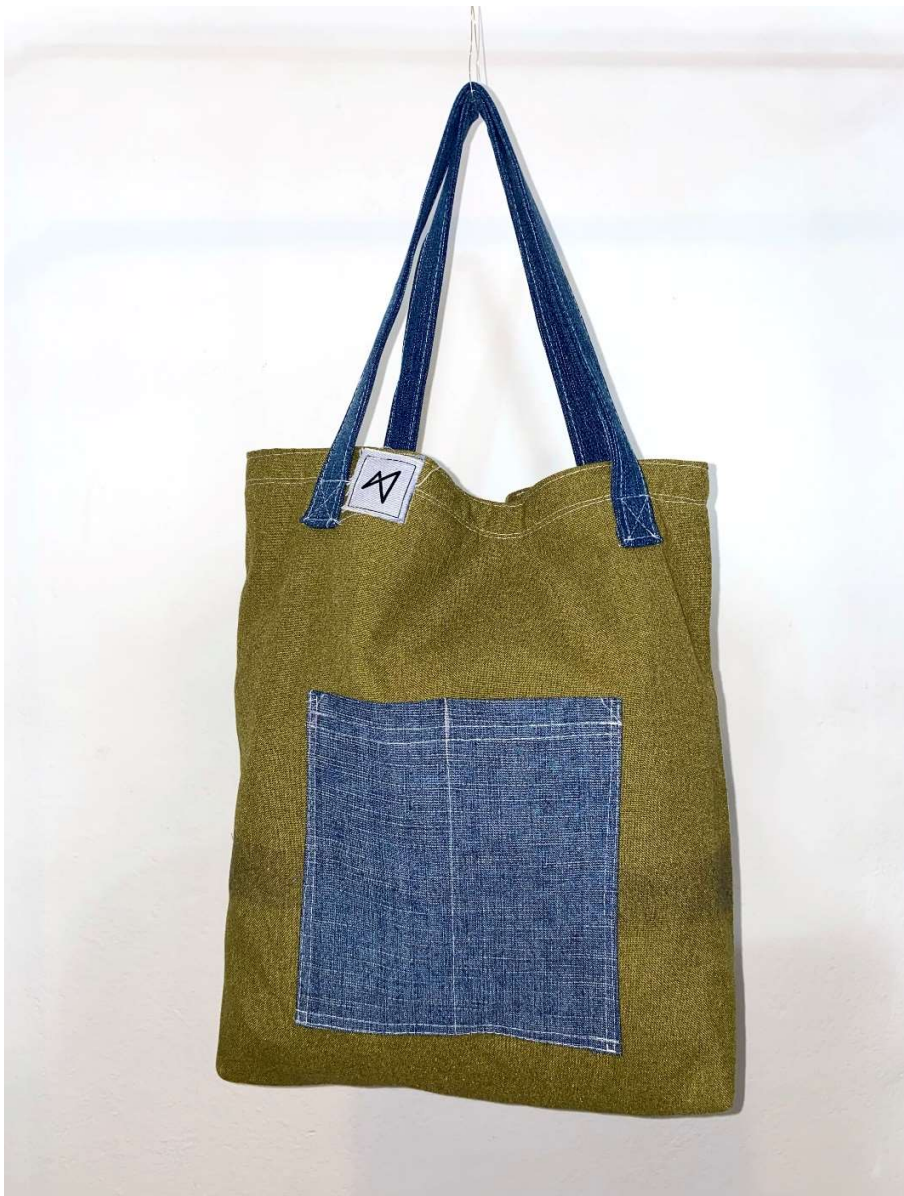
Slika 7 tote bag uz outfit no.2

Cijeli outfit promišljen je kao jednostavna, a opet upečatljiva kombinacija za svaki dan.