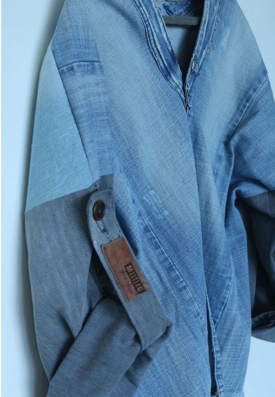
Slika 13 – outfit no.4 detalj gornjeg dijela