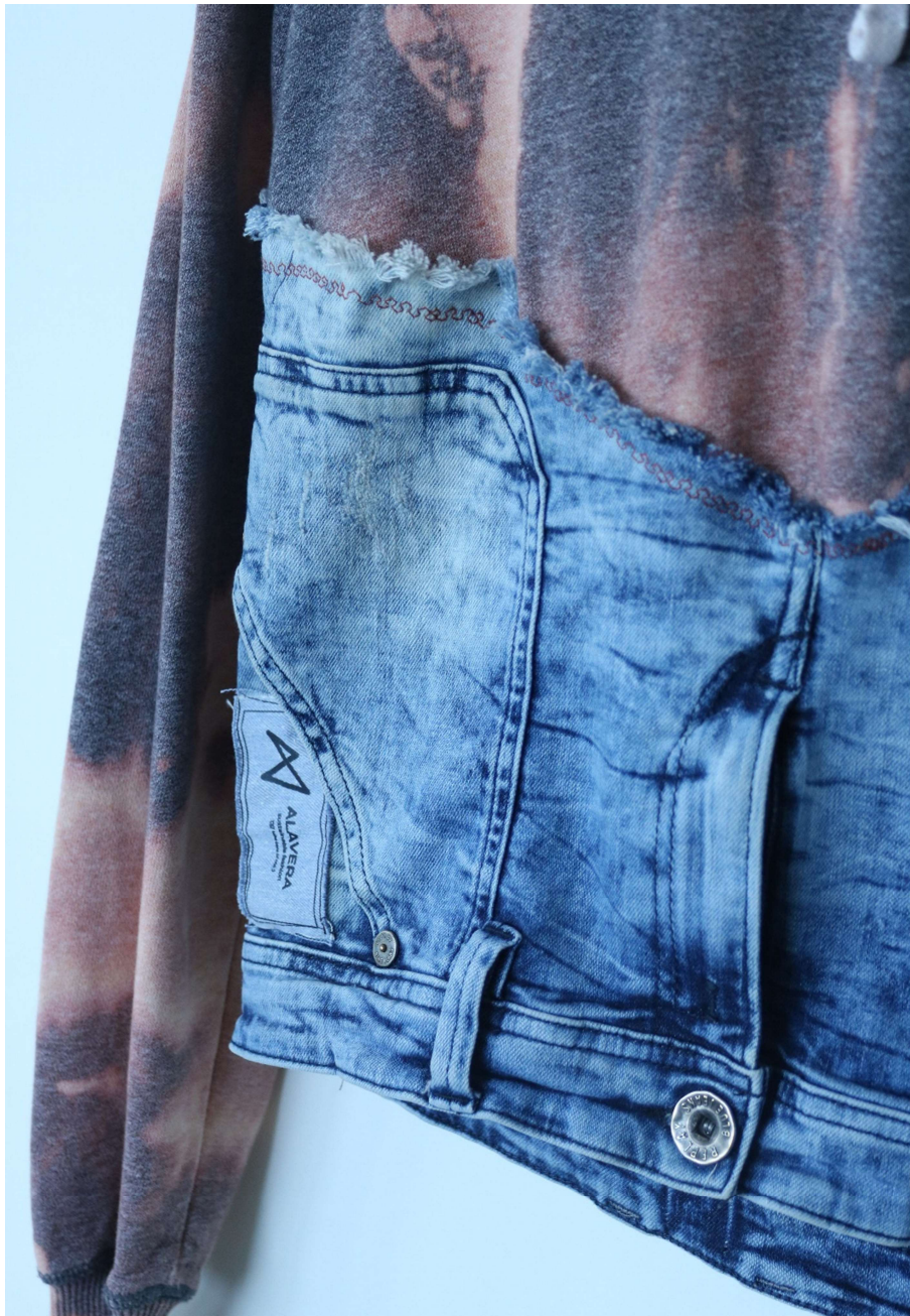
Slika 9 – outfit no.3, detalj

Jednostavne crne hlače niskog struka, naglašene su Alavera sitnim tipografskim natpisima fonta MontSerrat SemiBold koji se ponavljaju na desnom vanjskom rubu nogavice od koljena na niže, a intervencija je postignuta djelovanjem izbjeljivača koji se nanosio kistom kroz šablonu slova. Dodatno je dužina traperica skraćena dodavanjem elastične trake u donjem rubu, pa je na taj način postignut volumen.