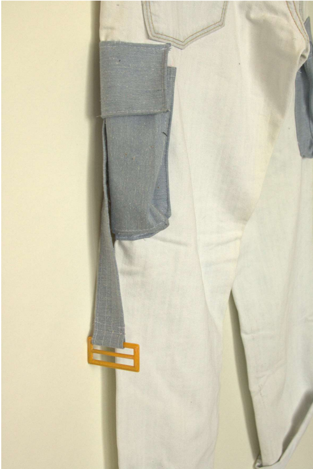
Slika 25 – outfit no.6, donji dio detalj