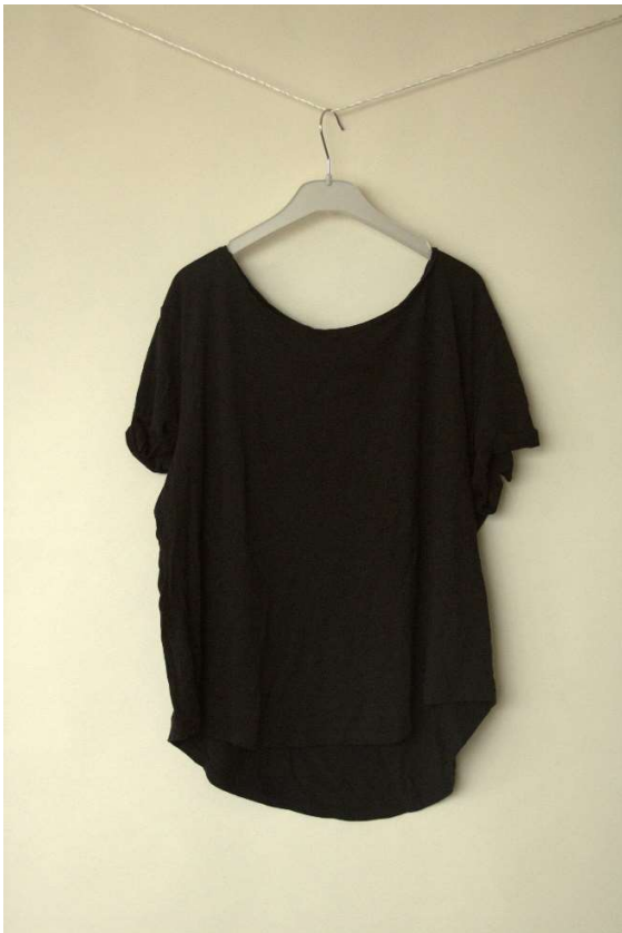
Slika 104 - dječji dom - outfit no.11 - prije

Cura je priložila vlastitu crnu majicu kratkih rukava, te je postignut dogovor oko redizajniranja iste u pogledu tiskanja ispunjenog kvadratnog slikom na prednji dio majice. Studentice studija dizajna iz tima obradili su poslanu nam sliku od strane naručitelja u obliku bolje kalibracije boja na slici te automatske nadopune piksela, izradili pripremu za tisak te smo tisak napravili u tehnici heat-transfer toplinskom prešom. Majicu je primila s oduševljenjem te rekla specijalno brinuti se o njoj.