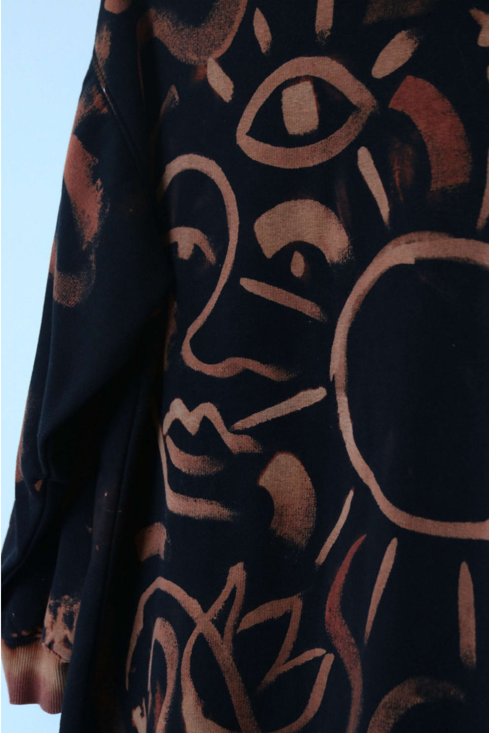
Slika 60 – outfit no.13, detalj