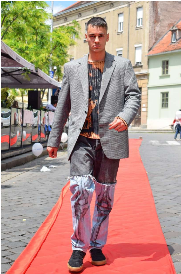
Slika 26 – outfit no.7

nogu. Boja je nanescena kistom na površinu traperica, zatim se uradak sušio na zraku, a potom je termo prešom fiksirana boja. Muške crne hlače od izbjeljelog su traperica, rez je napravljen od bedra na niže. Nakon obrade dvoje različitih hlača, njihovim spajanjem šivaćom mašinom nastaje krajnji proizvod. Rub gdje se spajaju hlače na bedrima nije porubljen kako bi nastao parani rub nogavica čime se pridaje izgledu spontanosti.