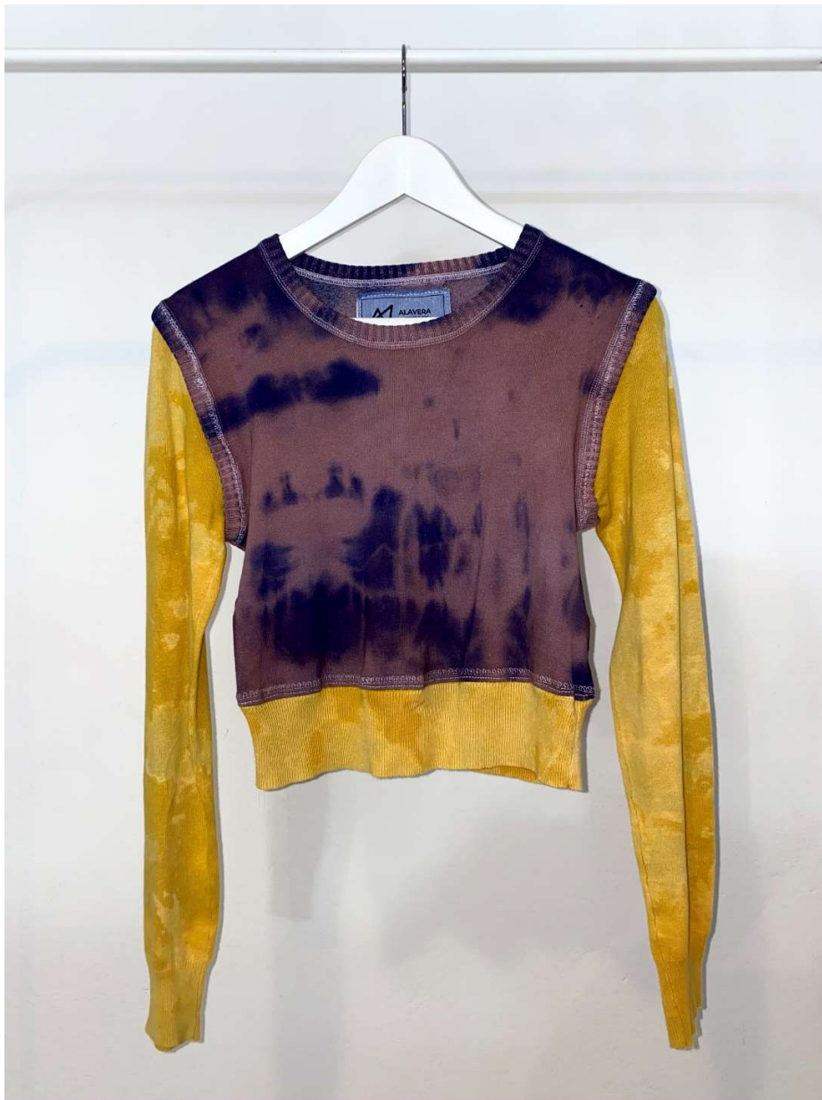
Slika 65 – outfit no.14, gornji dio

Krojni dijelovi torbe uzeti su kompletno iz ostataka materijala koje nam je donirala Prostorija te nastaje u obliku takozvane „tote bag“. Torba je namijenjena nošenju na ramenu te ima dvije ručke. Dodana je etiketa Alavera napravljena tiskom loga na ostacima materijala od traperera.