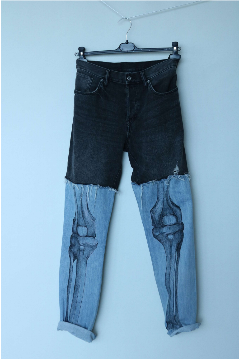
Slika 29 – outfit no.7, donji dio