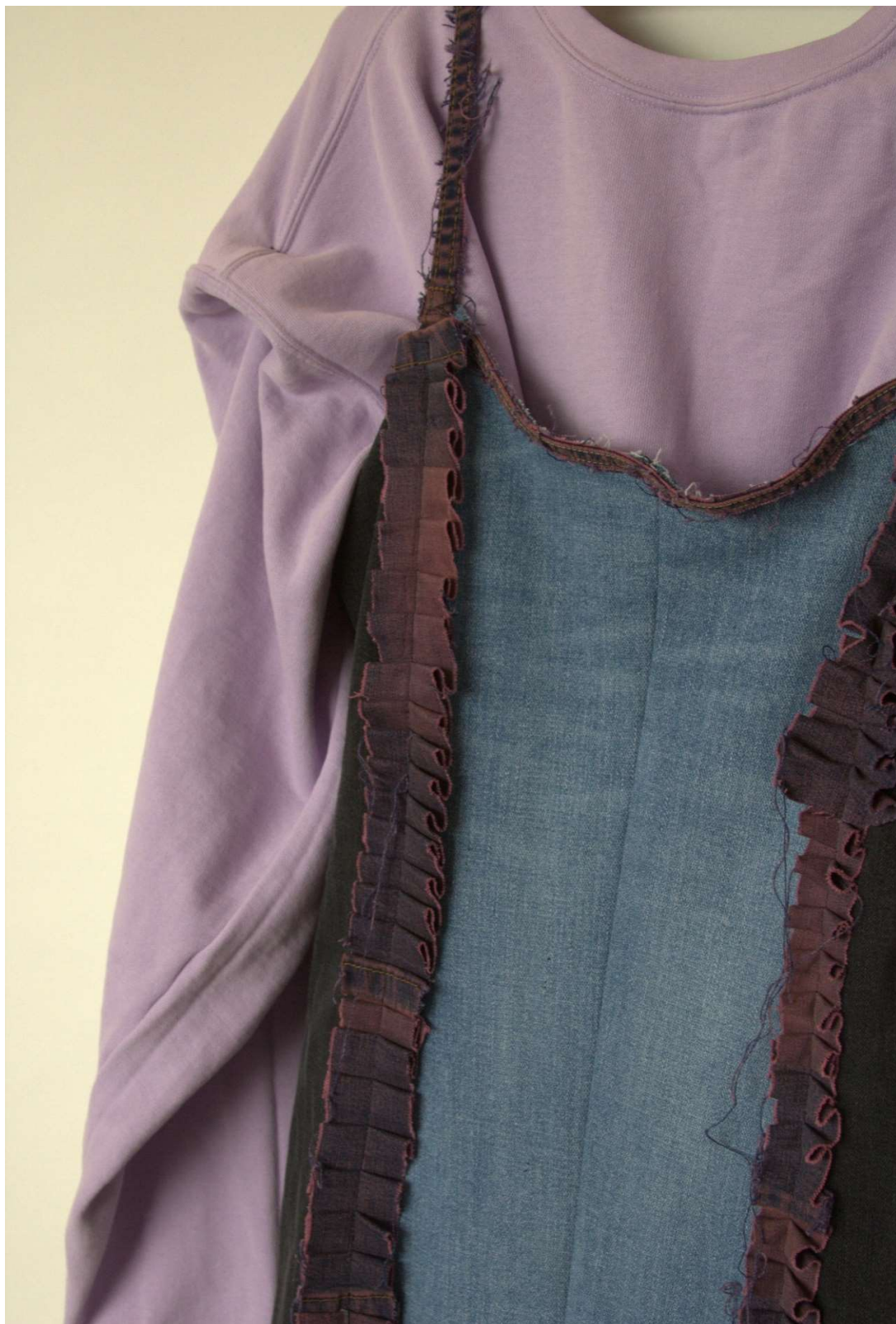
Slika 2 – outfit no.1 detalj