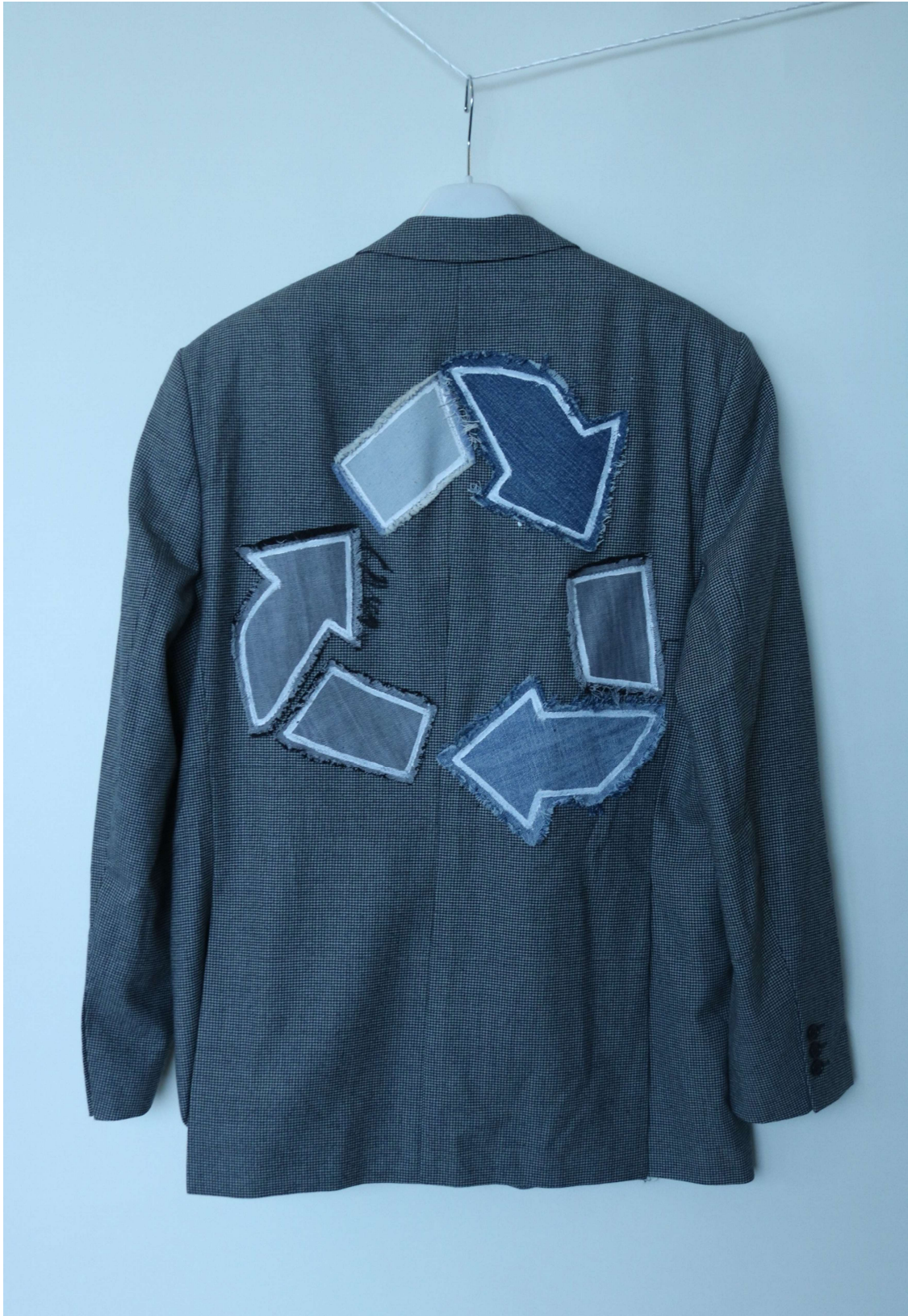
Slika 28 – outfit no.7, gornji dio straga