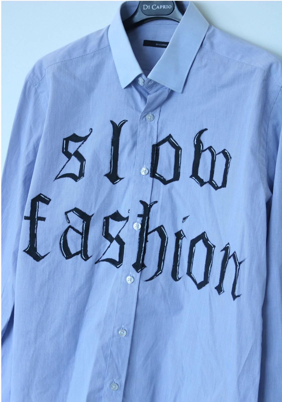
Slika 57 – outfit no.12, gornji dio detalj