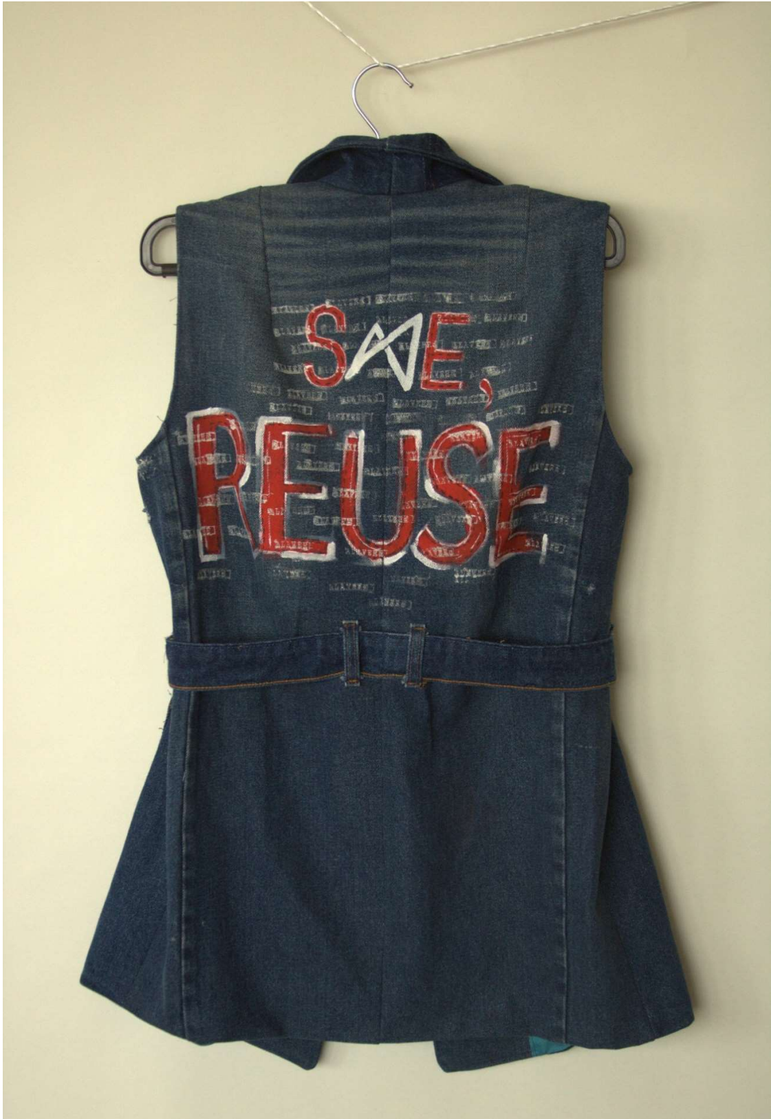
Slika 62 – outfit no.13, gornji dio straga