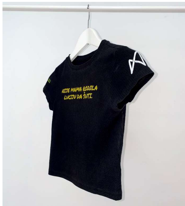
Slika 94 - dječji dom - outfit no.6 - poslije detalj