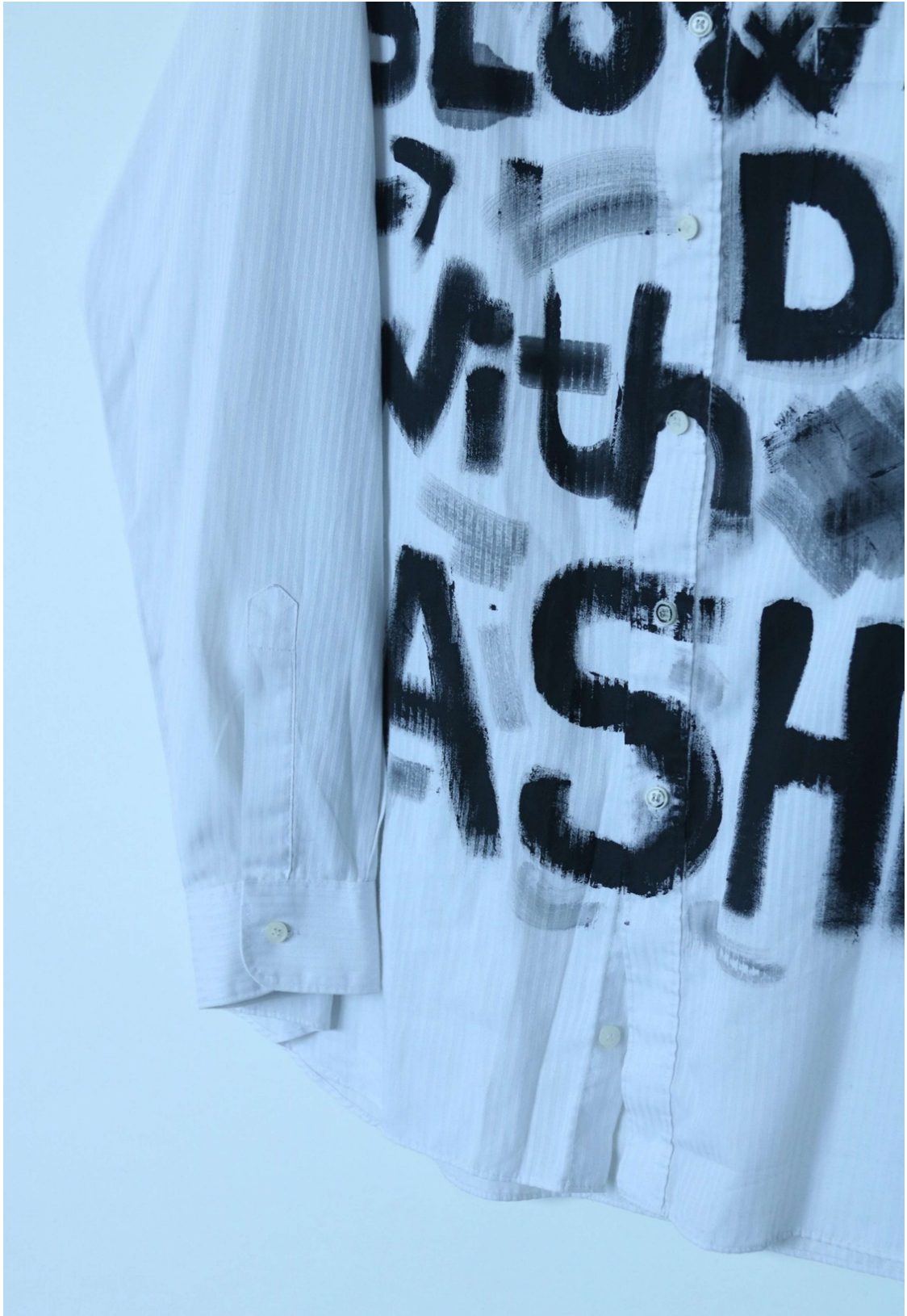
Slika 15 – outfit no.4, detalj gornjeg dijela