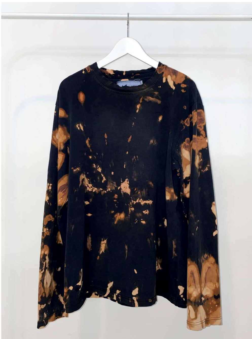
Slika 50 – outfit no.11, gornji dio

ostaju praznine u obliku slova V, te praznine su naknadno popunjene ostatkom donjeg dijela traperica koji smo prethodno anulirali zbog željene dužine haljine. Finalni postupak bio je dodavanje volana na rub dužine za koji je korišten također reciklirani jeans, no ovaj put model s elastinom i premazom na licu tkanine s kojim je postignuta tekstura kožnog materijala.