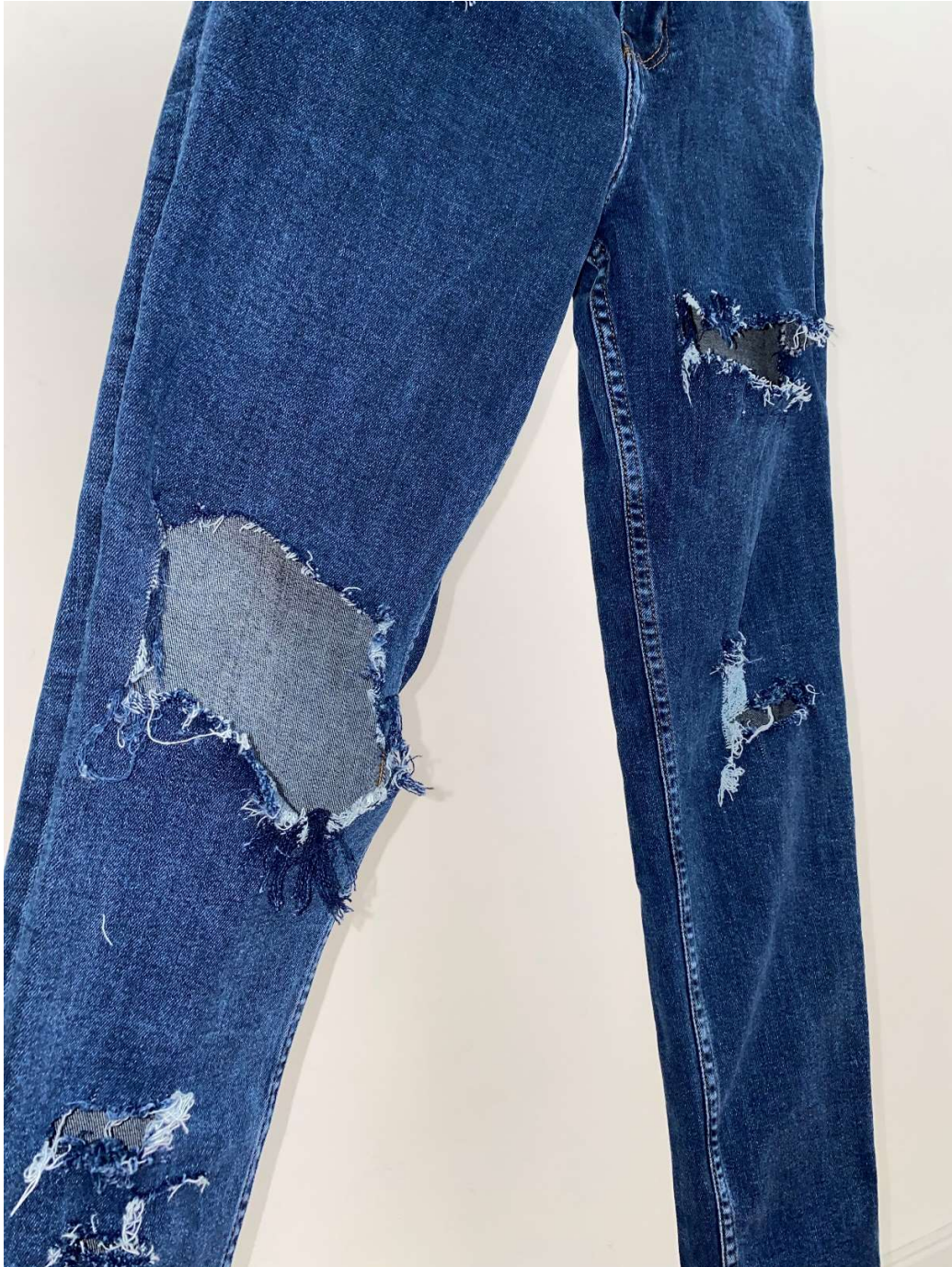
Slika 88 - dječji dom - outfit no.3 - poslije, detalj