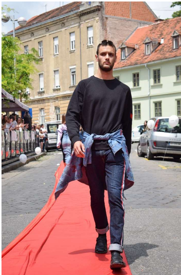
Slika 36 – outfit no.9

Trapericama tamnog tropera, sužen je kroj na način da se izrezao dio tkanine s boka nogavica, te su potom na isto mjesto uzdužno ušivene trake crvene, bijele i plave boje. Funkcija traka vizualno je produljiti noge.