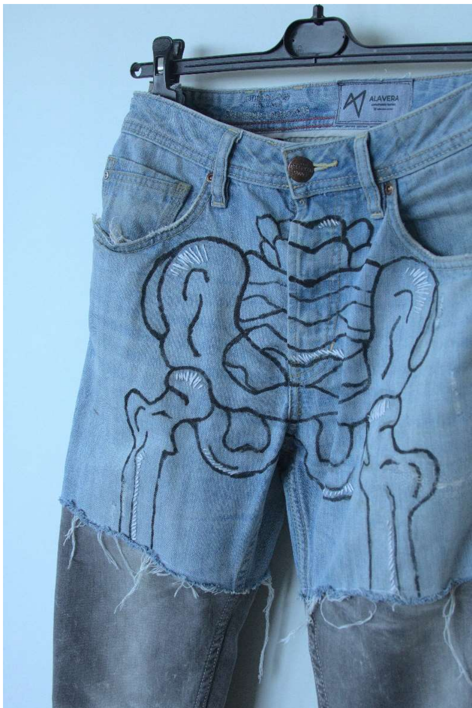
Slika 35 – outfit no.8, donji dio detalj