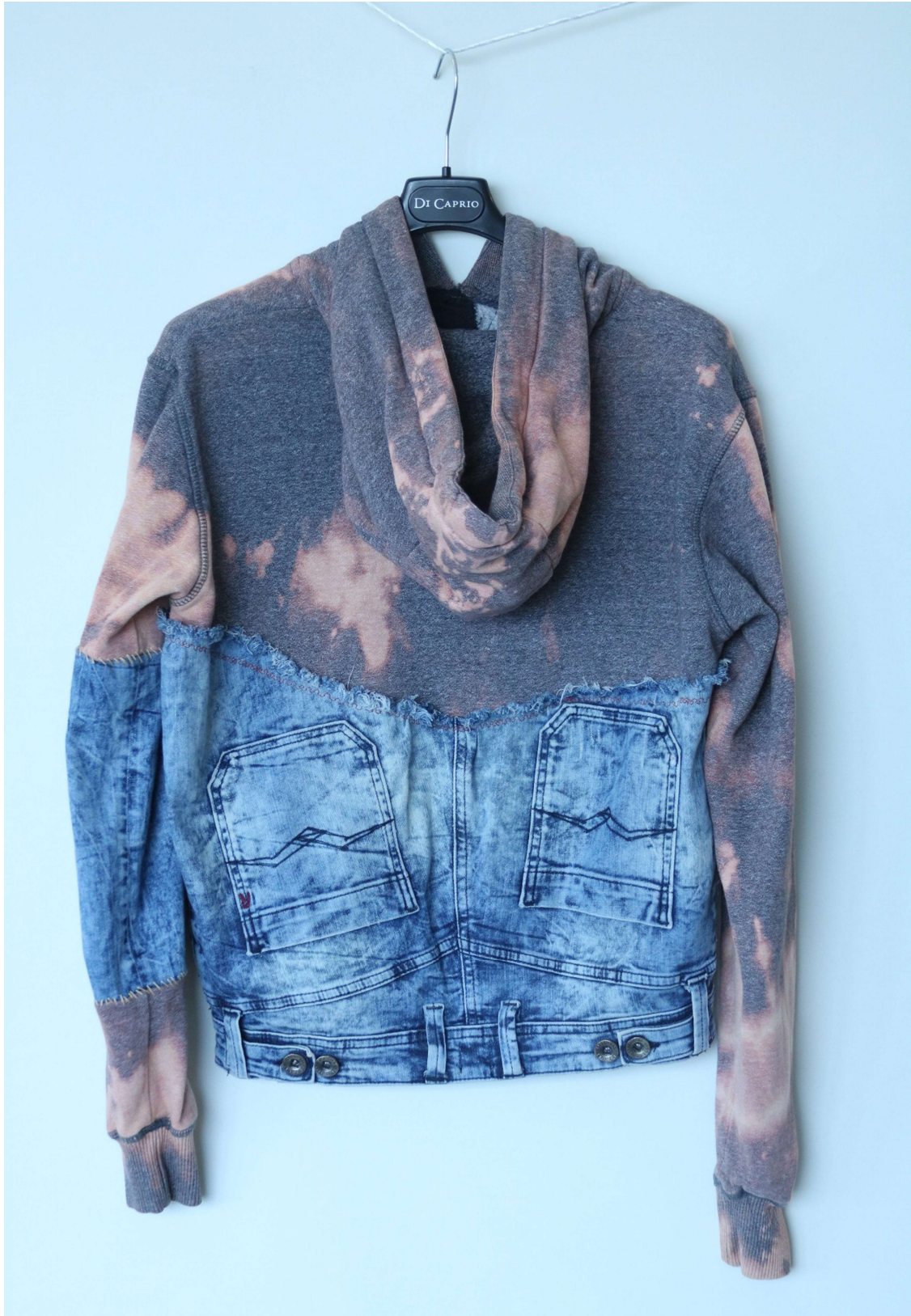
Slika 10 – outfit no.3, gornji dio