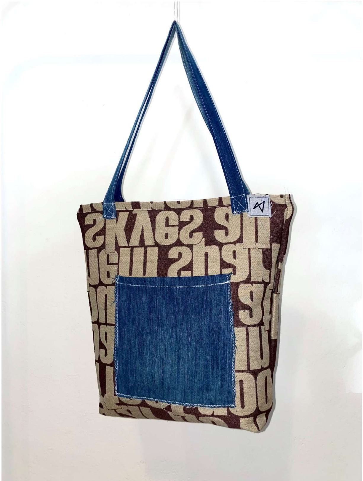
Slika 3 – tote bag za outfit no.1