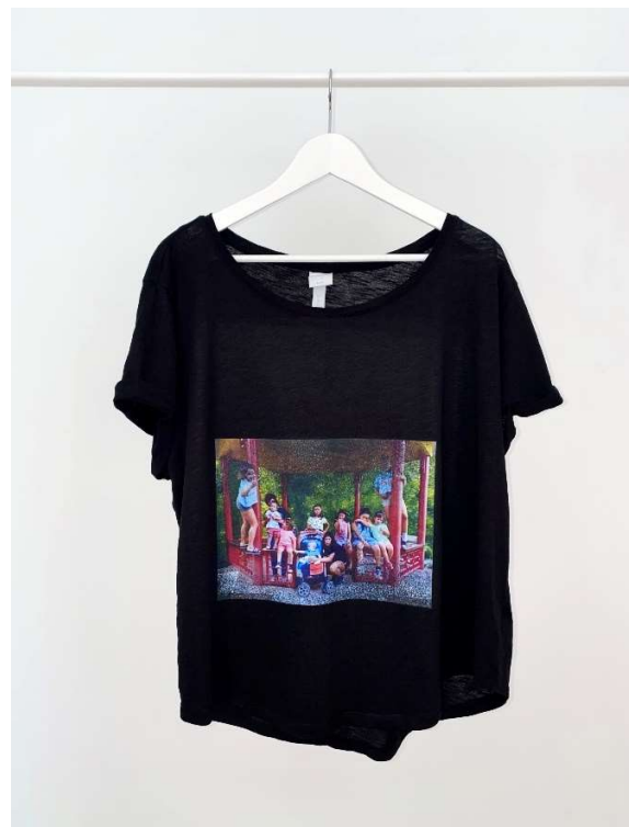
Slika 103 - dječji dom - outfit no.11 - poslije