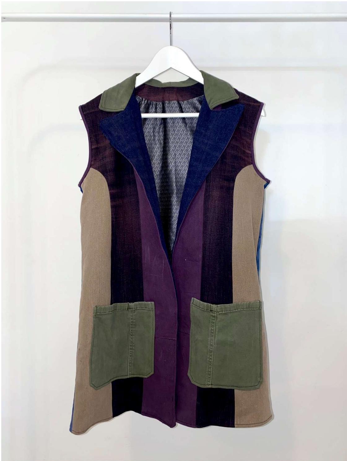
Slika 66 – outfit no.14, gornji dio, prsluk