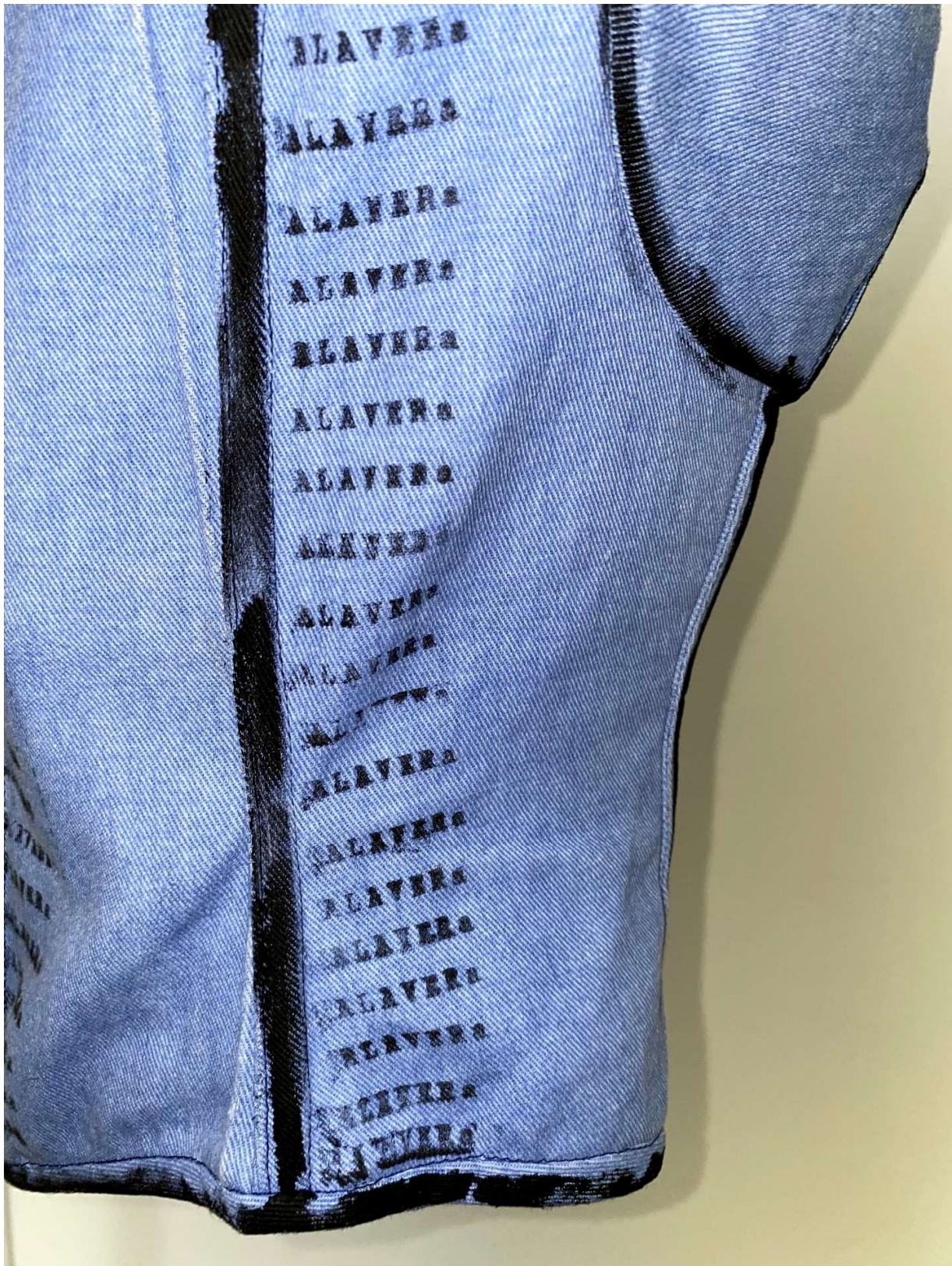
Slika 52 - outfit no.11 gornji dio, korzet, detalj