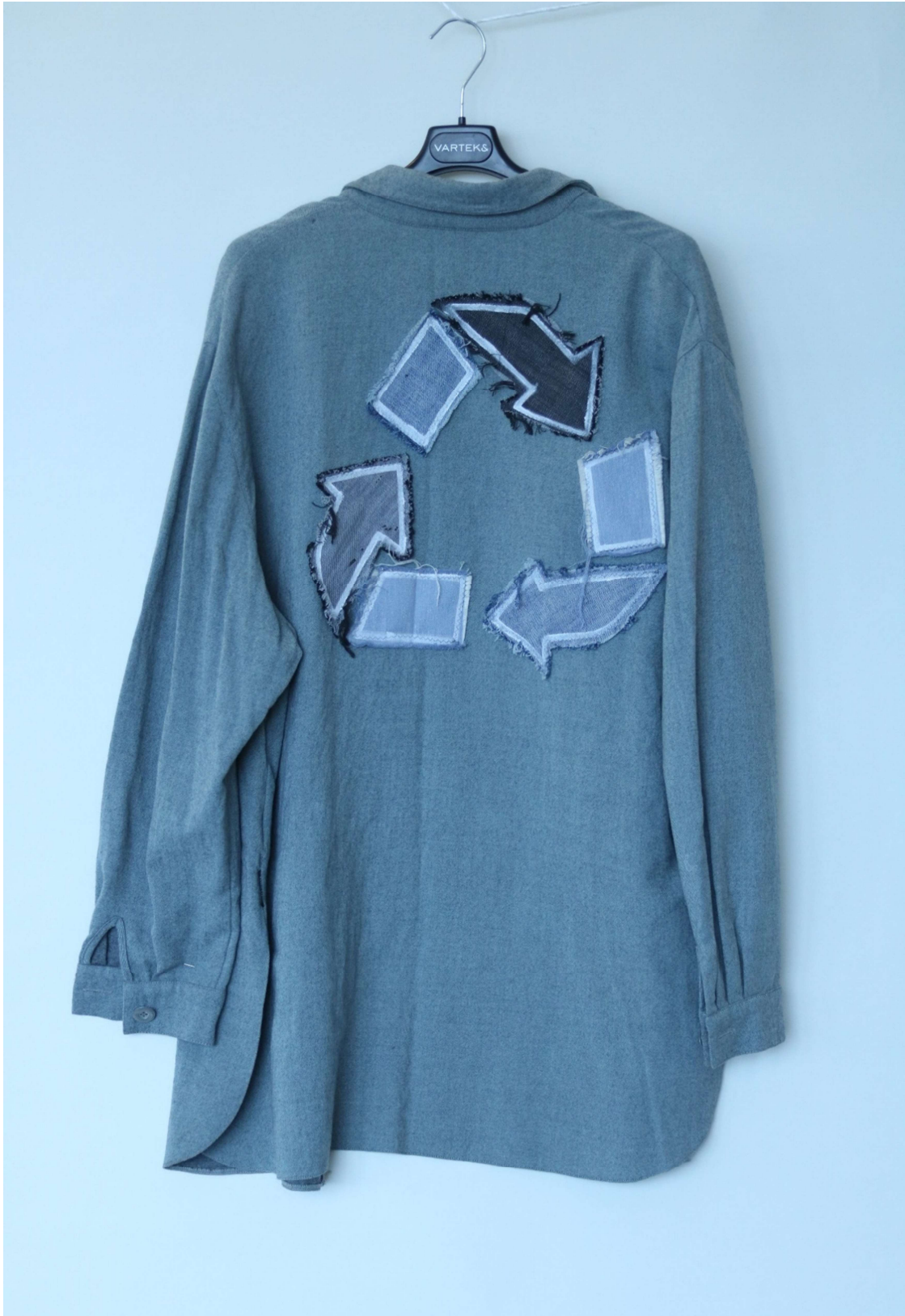
Slika 22 – outfit no.6, gornji dio odostraga