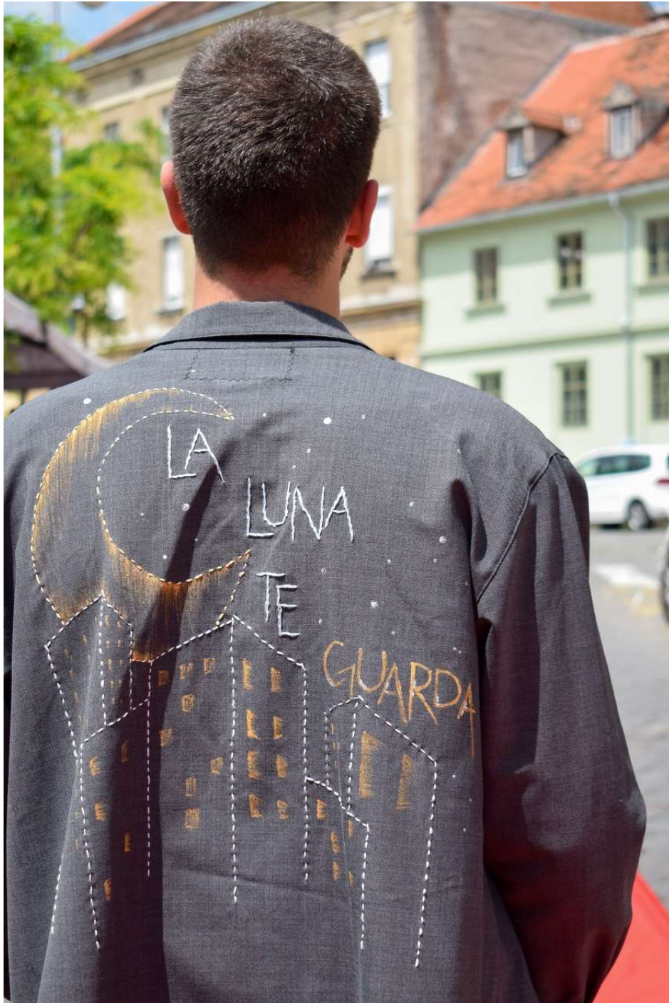
Slika 33 – outfit no.8, gornji dio straga