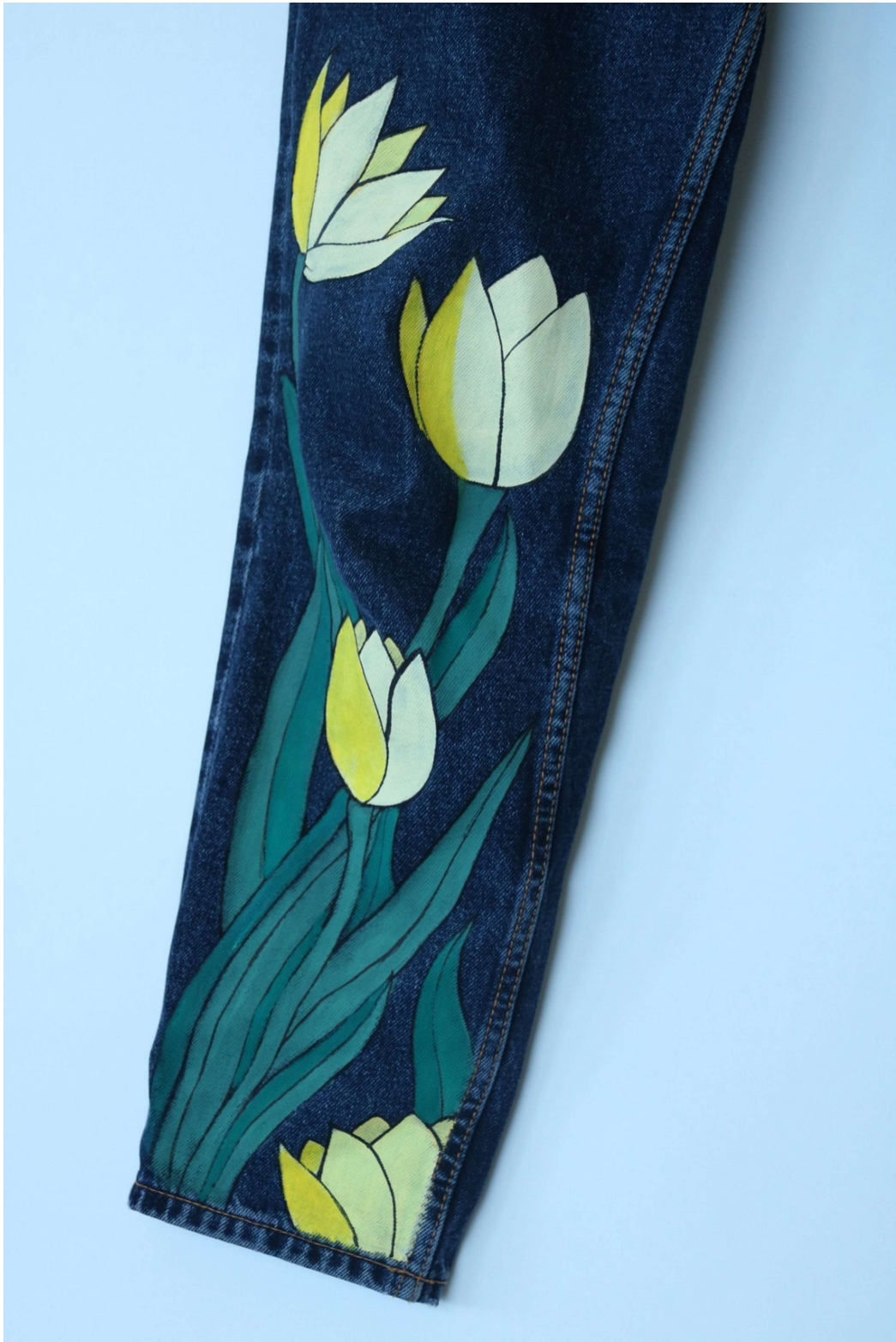
Slika 48 – outfit no.10, donji dio detalj