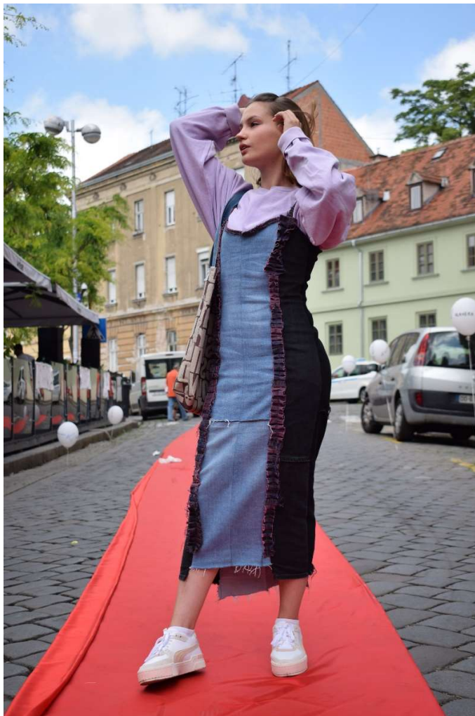
Slika 1 – outfit no.1

Torba je postignuta doniranim nam materijalima od Prostorie. Namijenjena je nošenju na ramenu, podnica i stranice torbe sašivene iz jednog komada. Također, na torbu je dodana etiketa Alavera napravljena tiskom loga na ostacima materijala od traperica te traper džep.