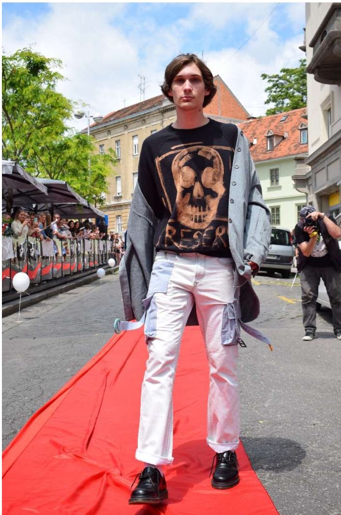
Slika 20 – outfit no.6

gumbima, dok su dijagonalni prednji, stražnji, te džepovi na bedrima iskrojani od restova doniranih od strane Prostorie. Hlače su inače uskog kroja, jednostavne, no intervencijom džepovima postaju cargo hlače (hlače sa džepovima na nogavicama) nakon što su našiveni sivi džepovi s teksturom tipične radničke mandure. Na sive džepove našivene su duže trake koje na krajevima imaju kopče u bojama koje odgovaraju gornjem dijelu outfita. Hlače postaju komad koji naginje streetstyle stilu koji cijeloj odjevnoj kombinaciji instantno daje notu modernosti.