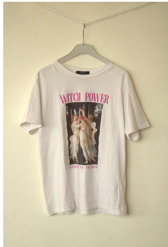
Slika 84 - dječji dom - outfit no.2 - prije