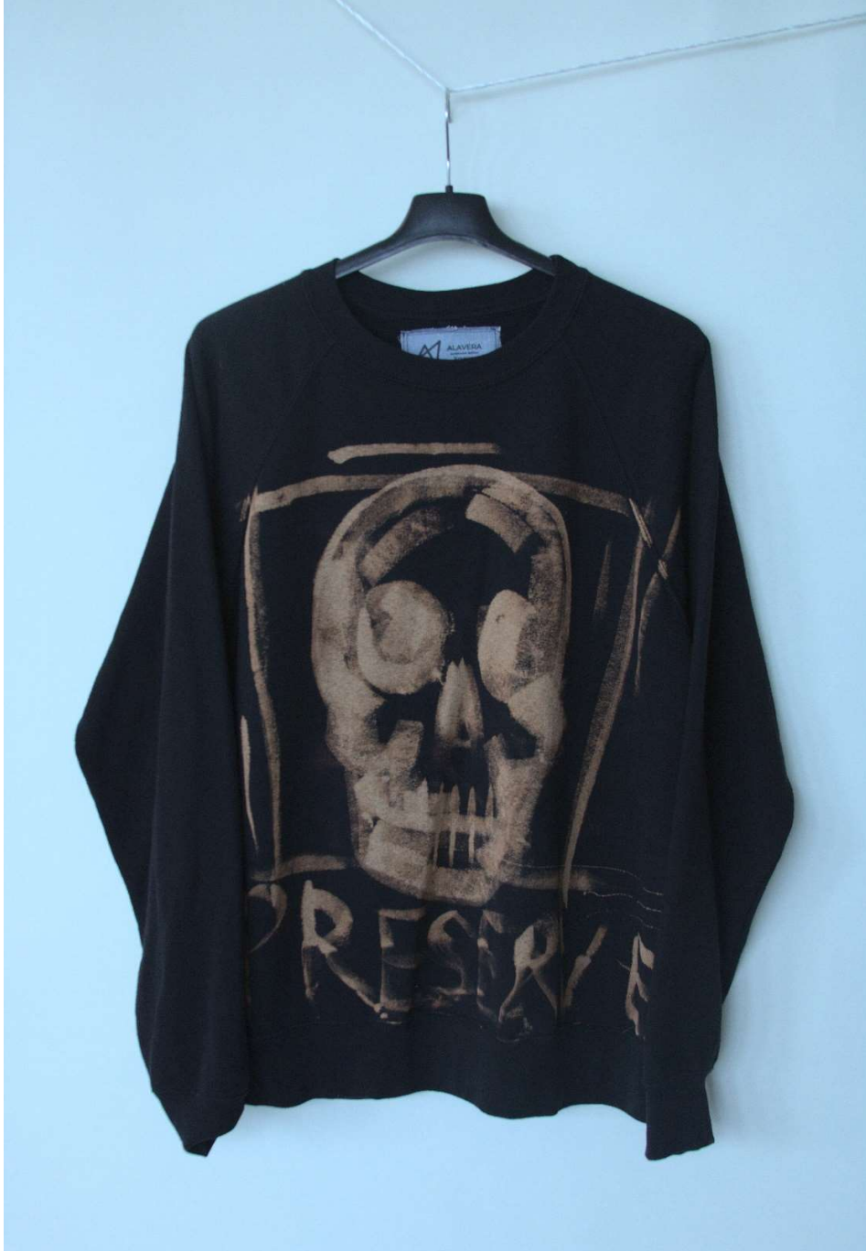
Slika 21 – outfit no.6, gornji dio