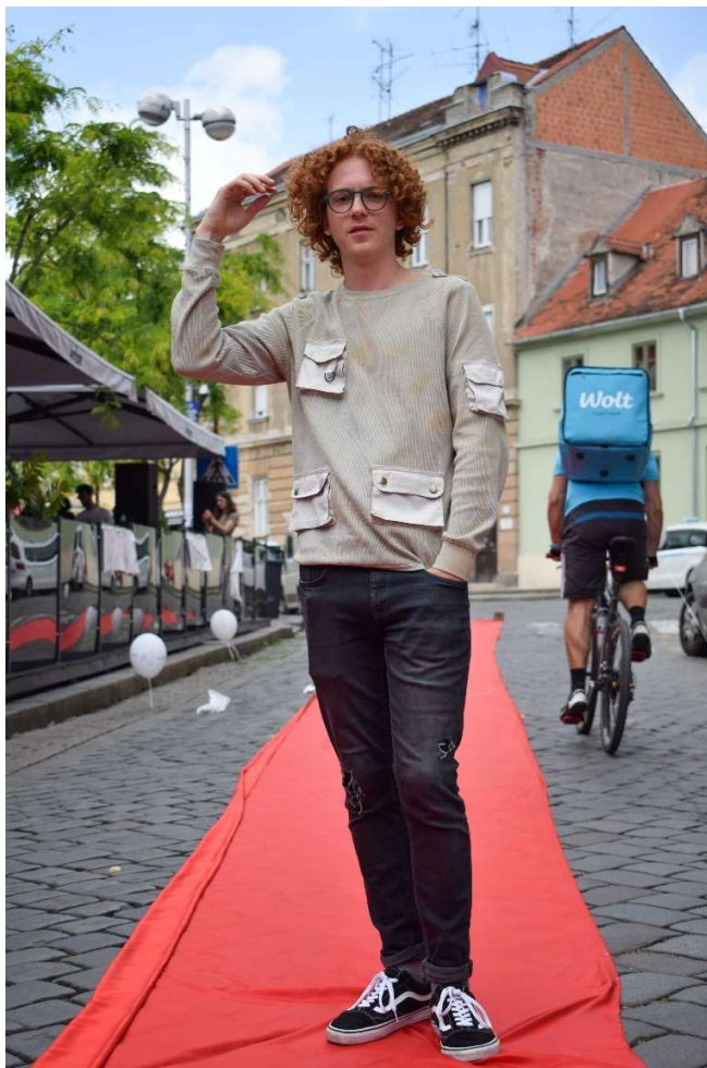
Slika 68 – outfit no.15

Boja se stavlja u bubanj za pranje sa svježje opranom tkaninom i odabere se odgovarajući ciklus pranja. Također mogu se bojiti manje količine tkanina izravno u posudi s kipućom vodom. Posebno nježne materijale mogu se ručno bojati i u loncu, čak na nižim temperaturama. Poslije završenog bojanja hlača u njihovu izvornu crnu, na području oko koljenja precizno su načinjene rupe paranog izgleda čime se outfit vraća izgledu nošenosti.