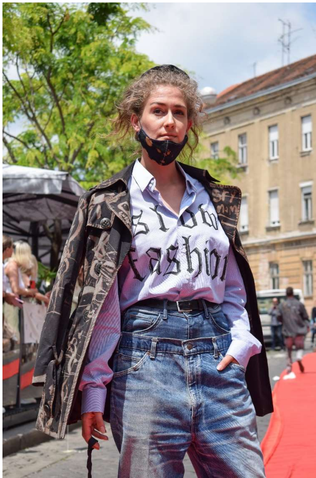
Slika 54 – outfit no.12

Baloner je u vidu kroja ostao netaknut, ali je zbog prirodnog izbjeljivanja crne boje prilikom deset godina korištenja te ekspozicije svjetlosti bio savršen komad za intervenciju izbjeljivačem. U ovome procesu, izbjeljivač je nanošen kistom od prirodne dlake i oslikani su razni urbani motivi i tipografski elementi u domeni spore mode 13 .