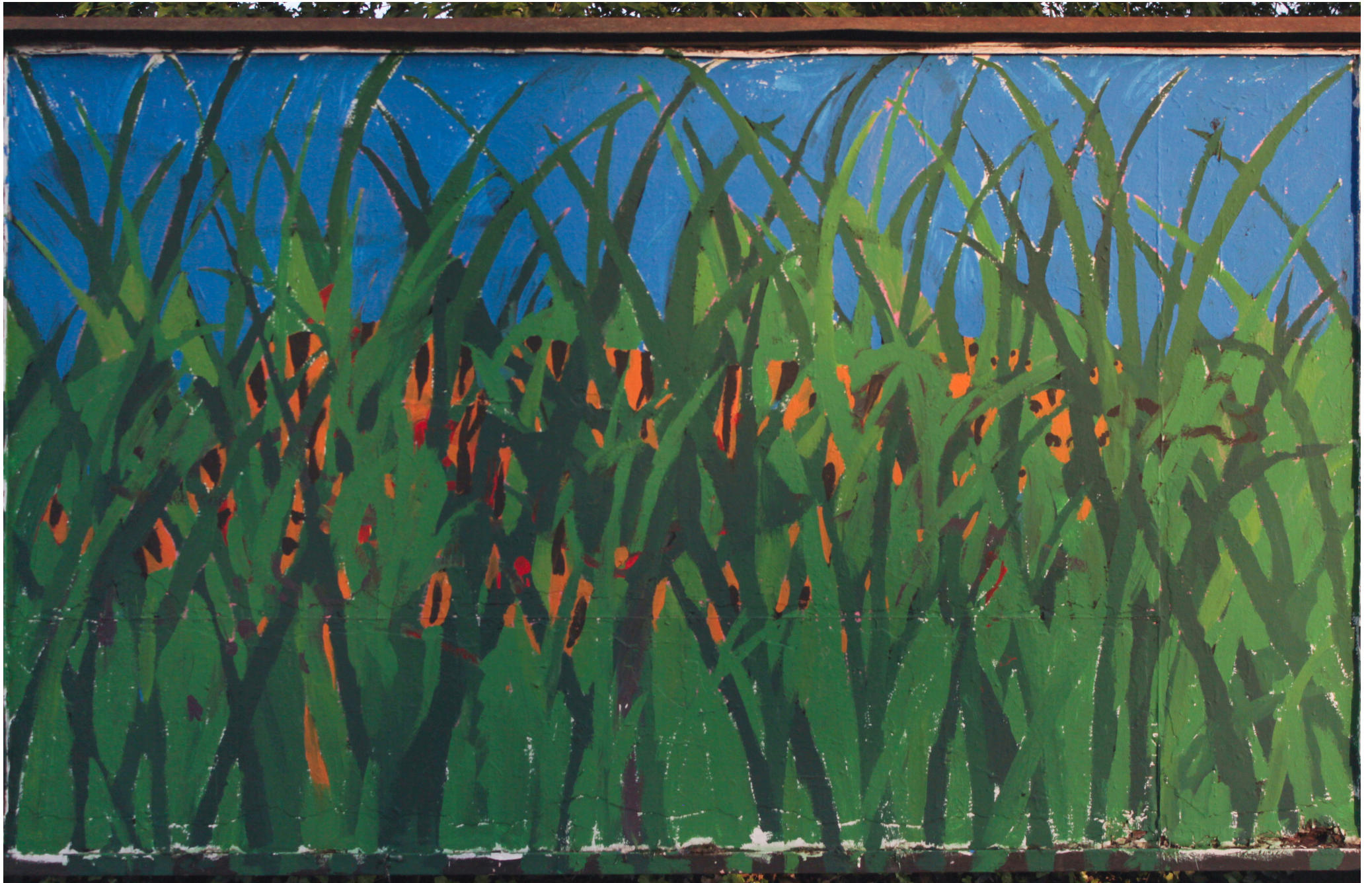
Helena Bonić, 4. godina integriranog studija – Konzerviranja i restauriranja umjetnina