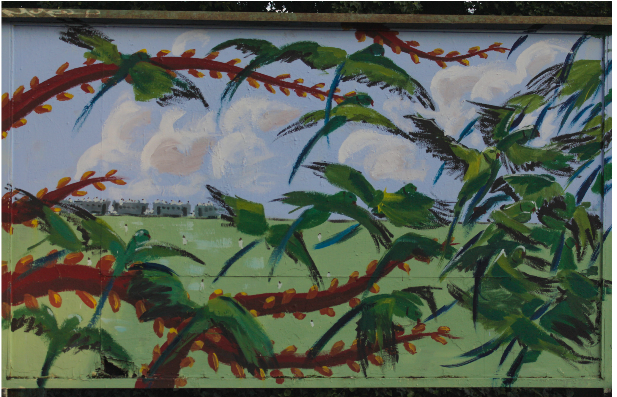
Helena Bonić, 4. godina integriranog studija – Konzerviranja i restauriranja umjetnina