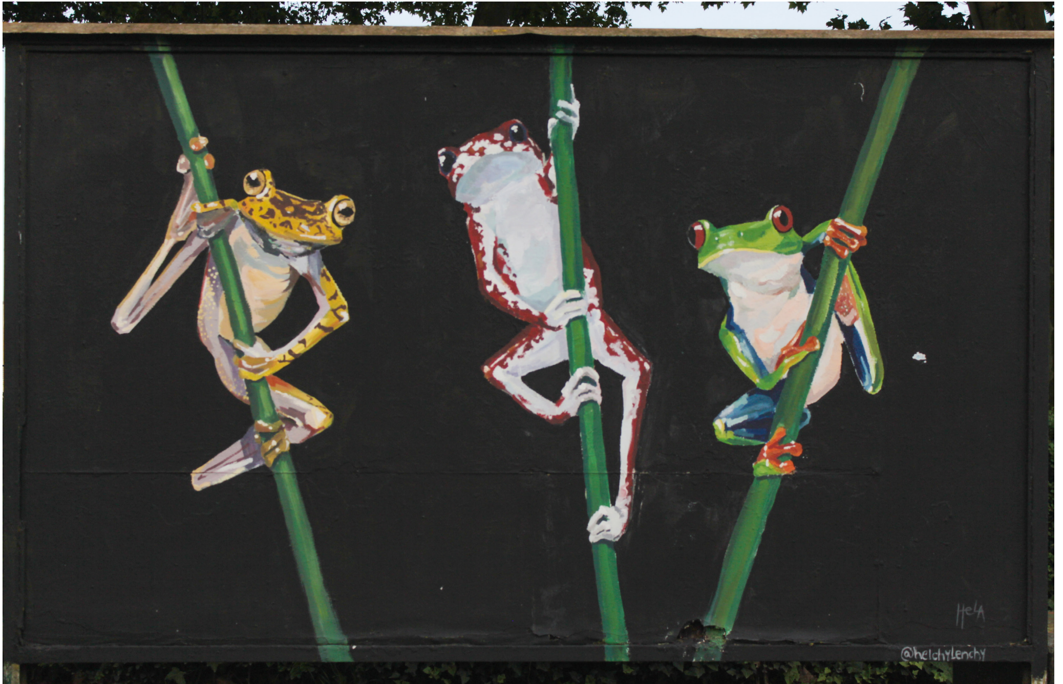
Helena Bonić, 4. godina integriranog studija – Konzerviranja i restauriranja umjetnina