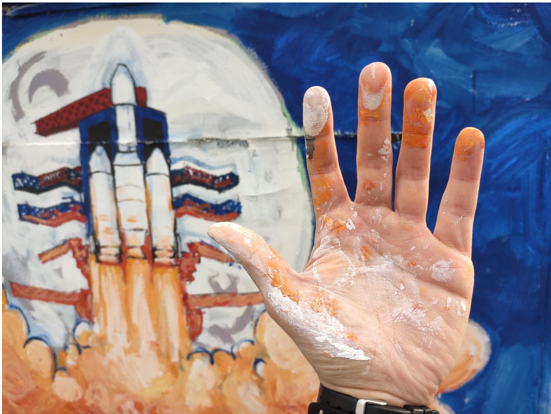
Slika 8 (gore), Slika 9 (dolje)